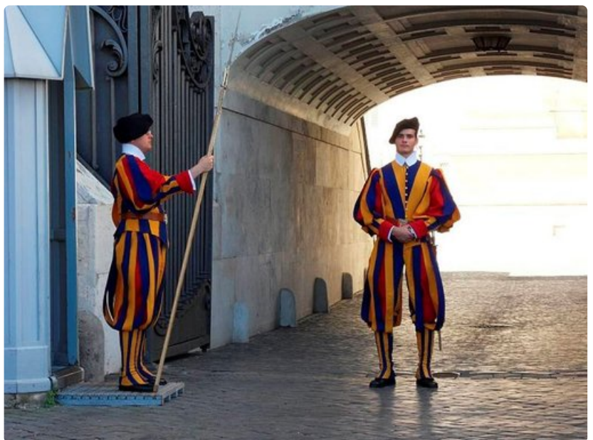
Vatikaania vartioi sveitsiläiskaarti komeissa puvuissaan.