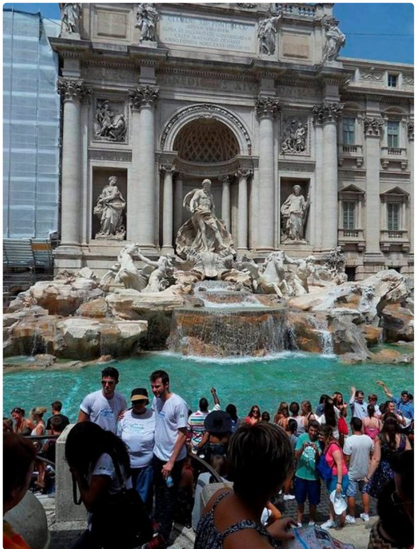
Varmista paluusi Roomaan heittämällä kolikko Trevin suihkulähteeseen.