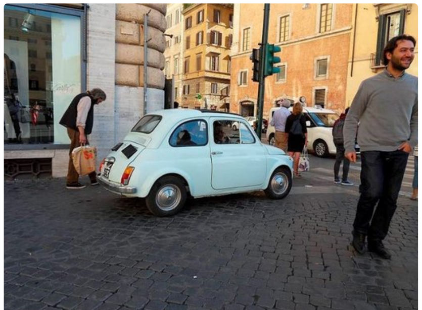
Historiallinen Rooma yllättää.