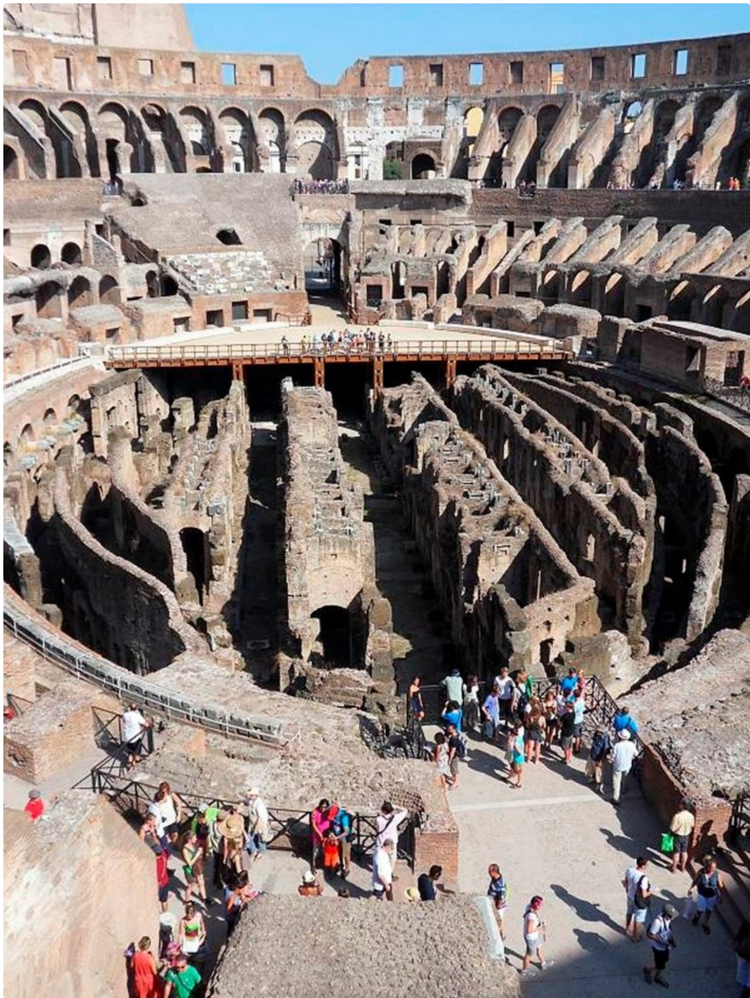
Colosseumilla historiankirjan tarinat heräävät henkiin.