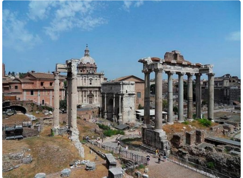
Forum Romanumilla on mukava paistatella päivää.

Euroopassa matkustellut on nähnyt niin paljon kirkkoja, ettei monikaan tee suurta vaikutusta. Pietarinkirkko tekee - jos ei muuten, niin ainakin valtavalla koollaan. Se on 220 metriä pitkä ja 138 metriä korkea. Kaikki muu Pietarinkirkossa on mahtipontista ja suurta paitsi nuoren Michelangelon veistämä herkkä Pietä, kuollutta poikaansa sylissä pitelevä Neitsyt Maria. Saman taiteilijan tekemä on kirkon upea kupoli, joka tekee kunnia Pantheonille metrin pienemmällä halkaisijallaan. Kupoliin pääsee katselemaan näköaloja yli Vatikaanin ja Rooman. Lukuisten arkkitehtien luoma sekamelska on kiinnostava. Kirkossa on nähtävillä Michelangelon hienostunutta renessanssia ja Berninin mahtipontista barokkia. Berninin tekosia ovat muun muassa