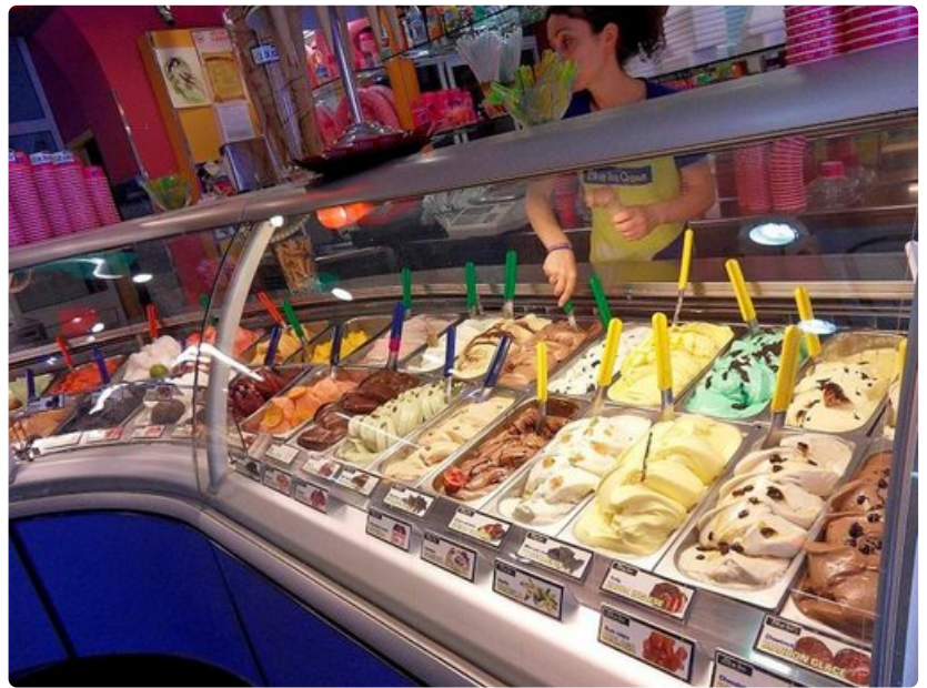
Vielä yksi kauhallinen suklaata, per favore.

Kaupunkikortti: 34 euron hintaisella Roma pass -kortilla pääsee kahteen museoon tai nähtävyyteen. Lisäksi sillä voi matkustaa kolme vuorokautta Rooman julkisessa liikenteessä. Parasta kortissa on se, että sillä välttyy Colosseumiin jonottamiselta. Vatikaanin museoon se ei käy.