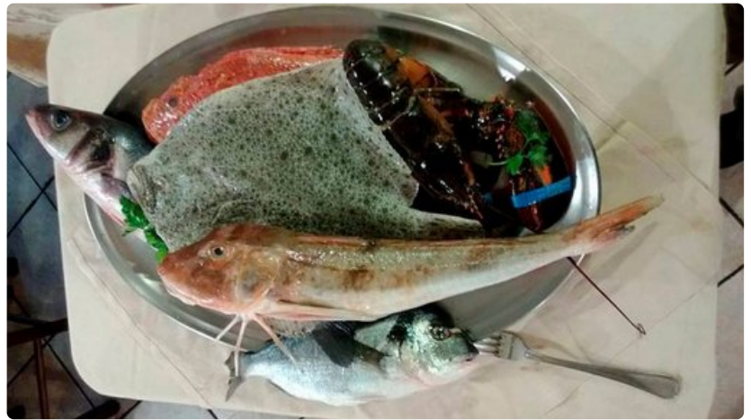
Päivän menu ravintola Ambasciata di Caprissa.