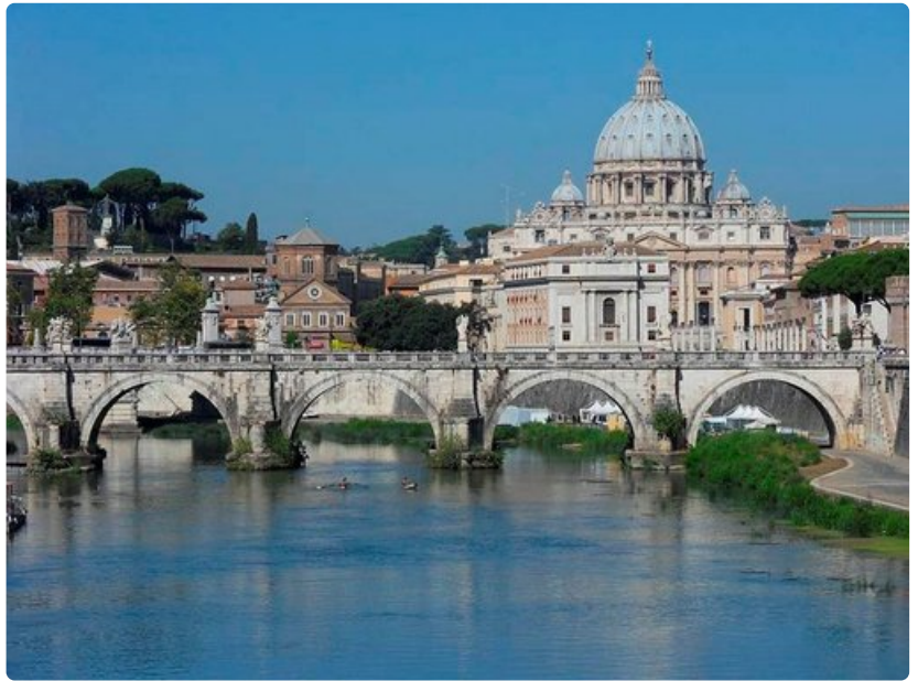
Pietarinkirkko on Rooman maamerkki.

Aurinkoisien päivien paras välipala on gelato , pehmeä ja täyteläinen