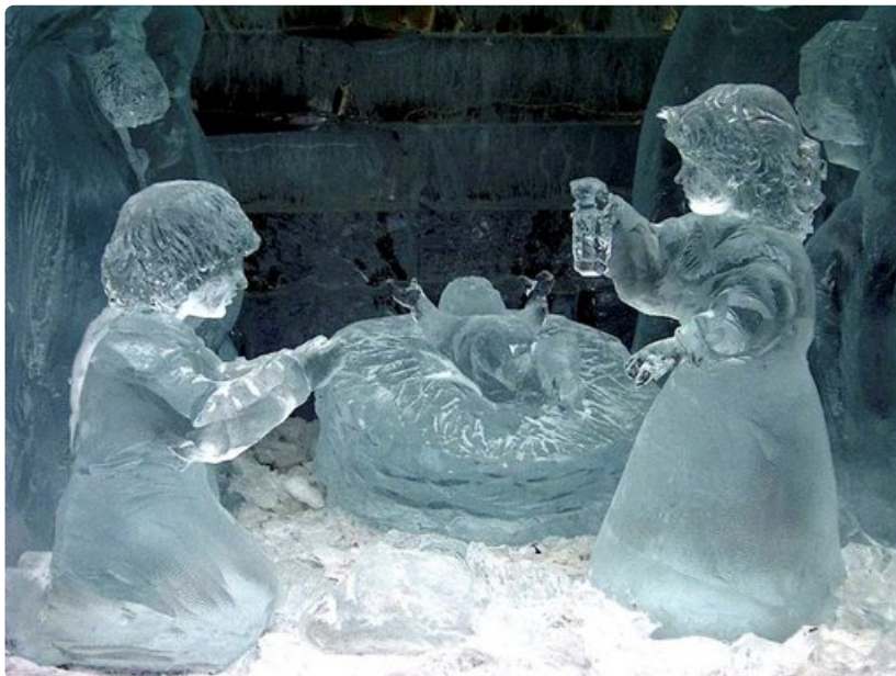
Jääveistoseksessä on kokoelma hienoja jääveistoksia.