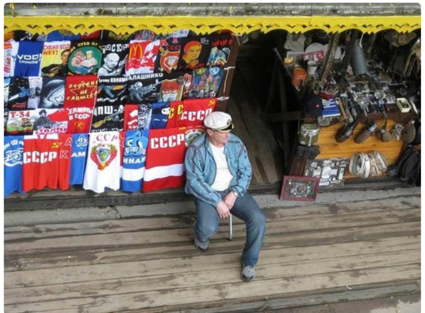
Izmailovon markkinoilta etsivä löytää paljon neuvostoaiasta esineistöä.