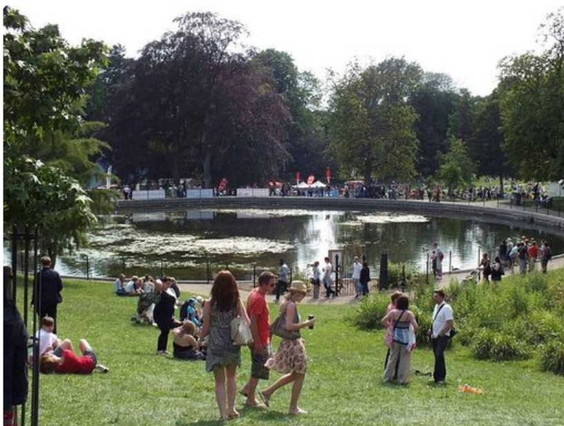
Gorkin puisto on moderni ja lapsiystävällinen.