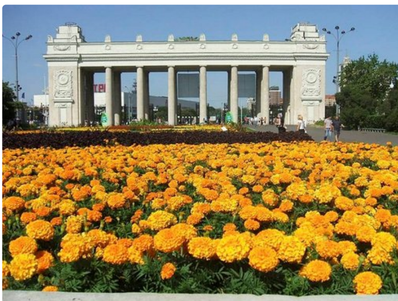
Gorkin puistosta on tullut Moskovan suosituin kohde.