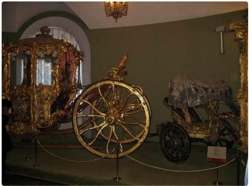
Kremlin asehuoneessa säilytetään ainutlaatuisia rikkauksia.