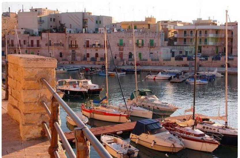
Etelä-Italian idyllisissä pikkukaupungeissa ei juuri näe ulkomaalaisia matkailijoita.