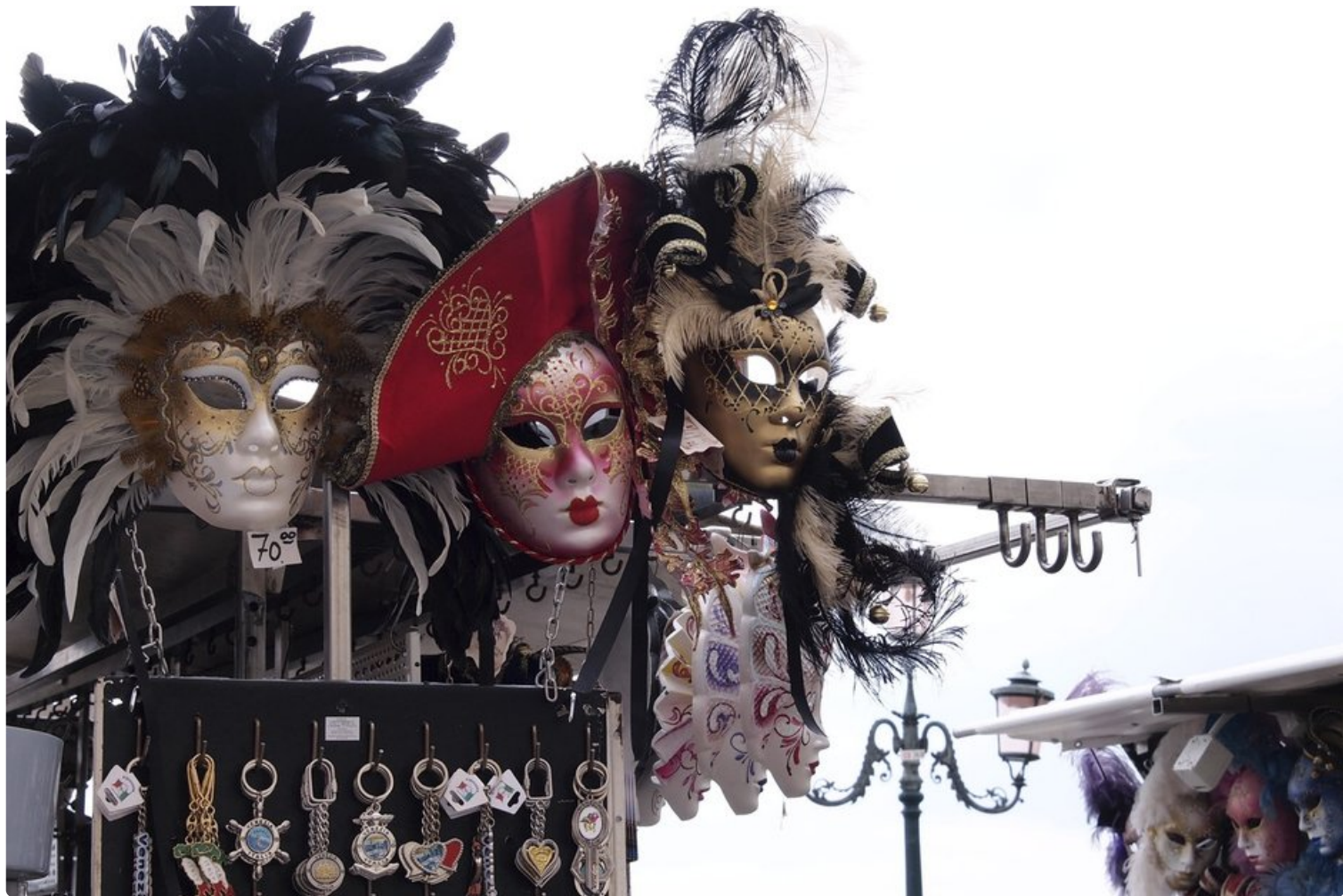
Venetsian naamiokarnevaaleilla on satojen vuosien perinteet, ja naamioita voi ostaa kaikkialta kaupungista.