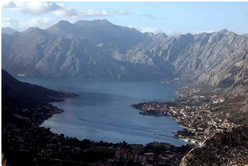
Kun ajaa tarpeeksi ylös mutkaista vuoristotietä, pääsee ihaillemaan Kotorin lahdelta avautuvaa, huikeaa näkymää.