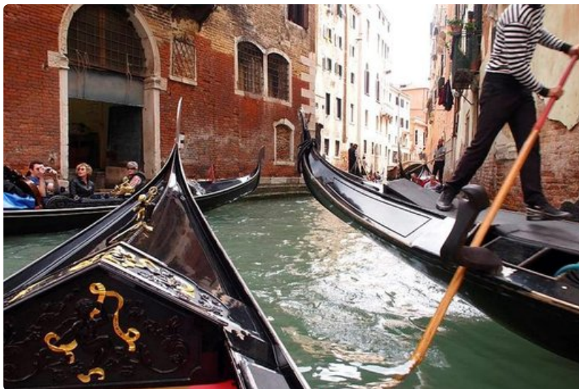
Venetsiassa kannattaa kokeilla gondolijaljelua. Vaikka elämys onkin kallis, se on myös ainutkertainen.