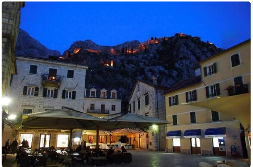
Kotorin yöt ovat lempeitä, ja ravintolat sekä pienet putiikit auki myöhään. Viereisten vuorten linnoitukset näyttävät iltavalaistuksessa satumaisilta.