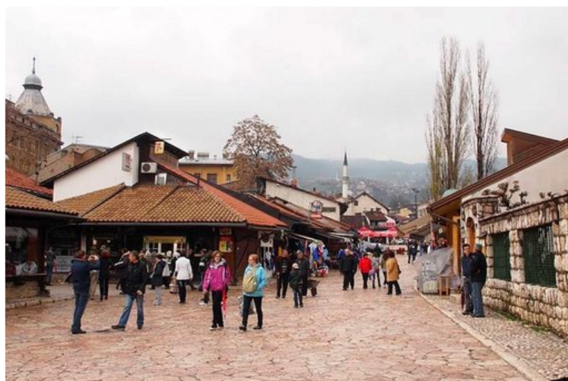
Sarajevon basaarikadut ovat täynnä edullisia pikku myymälöitä ja ravintoloita, joissa voi nauttia herkullisia, suuria, halpoja ja lihaisia annoksia.