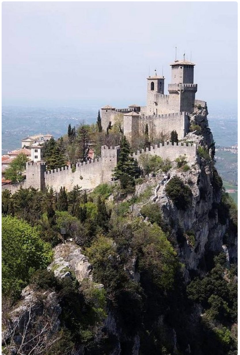
Italia ympäröi San Marinon kääpiövaltiota.