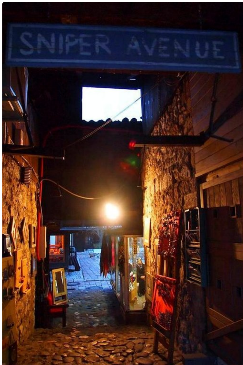
Muutamat Sarajevon kadut on nimetty maan julman historian mukaan.