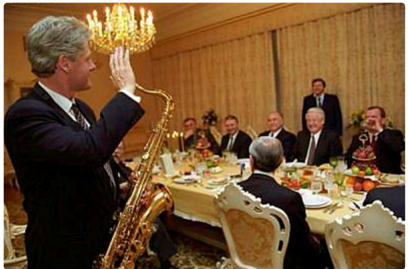
Lukuisia valtiovierailuja tehnyt Bill Clinton innostui toisinaan soittamaan isännilleen saksofonia.