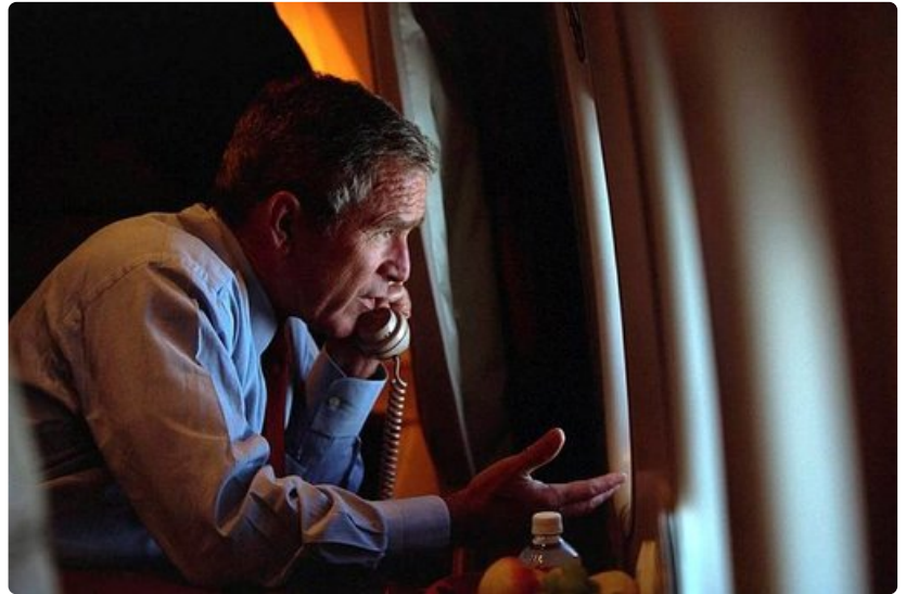
George W. Bush puhumassa varapresidenttinsä kanssa puhelimesta 11.9.2001.