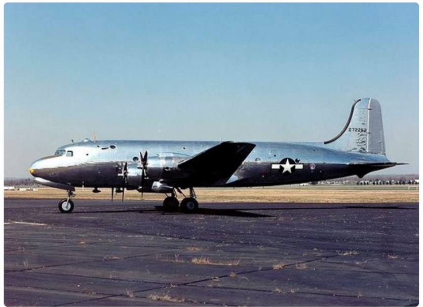
Douglas C-54 Skymaster, jota lehdistö kutsui nimellä Sacred Cow, oli käytössä vuosina 1944-1947.

Kutsumerkki "Air Force One" syntyi Eisenhowerin aikana sattuneen pienen kömmähdyksen vuoksi, kun Floridaan matkannut Columbine II eli Air Force 610 osui samaan ilmatilaan identtistä numeroa käyttäneen Eastern Airlinesin matkustajakoneen kanssa ja lennonjohto sekoitti koneet hetkeksi toisiinsa. Vaikka tilanteesta ei koitunut vakavaa vaaraa, päätti Eisenhowerin pilotti antaa presidentin koneelle ikioman, ainutkertaisen kutsumerkin. "Air Force One" oli lyhyt ja ytimekäs valinta, joka on pitänyt näihin päiviin asti. Nimi kuvastaa osuvasti koneen arvojärjestystä taivaalla, sillä presidentti tulee aina ensimmäisenä.