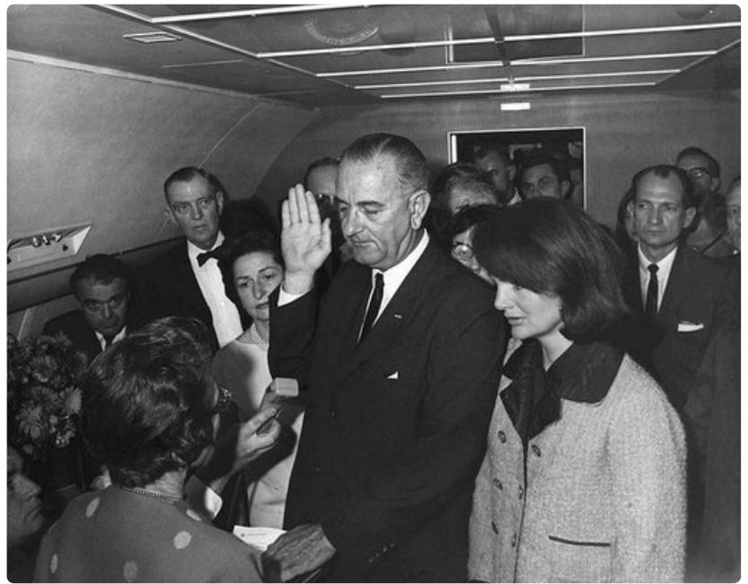
Lyndon B. Johnson vannomassa virkavalaa Air Force Onessa 22.11.1963. Rinnalla seisoo leskeksi jäänyt Jackie Kennedy.

Varapresidentti Gerald R. Fordin vannoessa virkavalaa 9. elokuuta 1974, Nixonia oltiin juuri lennättämässä kotiin Kaliforniaan. "Kansas City", kapteeni ilmoitti lennonjohdolle heti vallan vaihduttua, this was Air Force One. Will you change our call sign to SAM 27000? Roger, SAM 27000 , vastaus kuului Good luck to the President . Esimerkki osoittaa, että vain istuvaa presidenttiä lennättävän koneen kutsumerkki voi olla Air Force One.