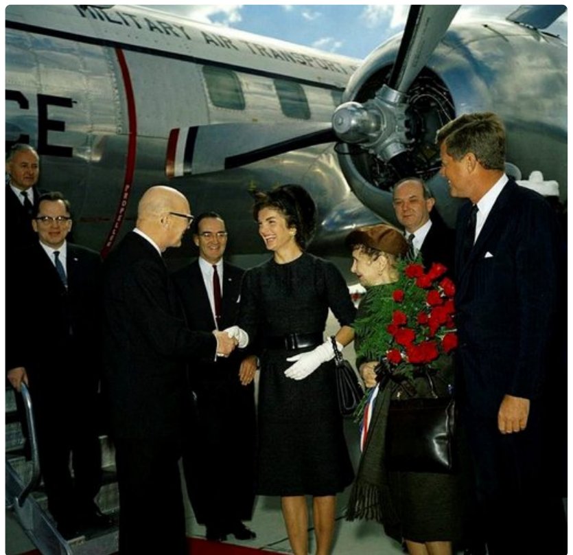
Tyylikäs Kennedyn pariskunta vastaanottamassa Urho ja Sylvi Kekkosta kylmän sodan kuumimpana vuonna 1961.