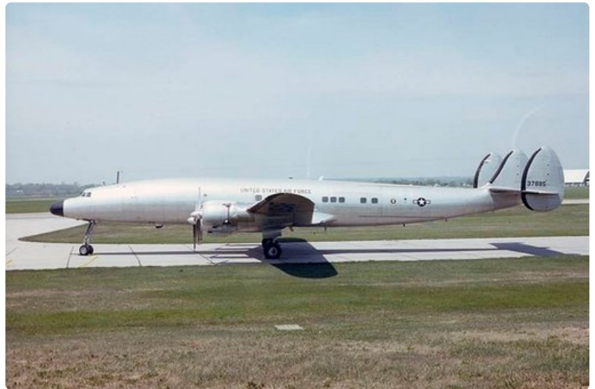
Eisenhowerin 50-luvulla käyttämä Columbine III on esillä Yhdysvaltojen ilmavoimien museossa Ohiossa.