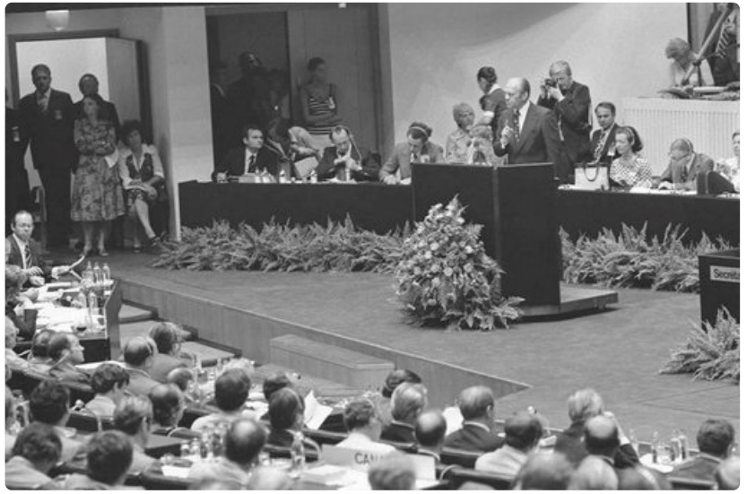
Gerald Ford puhumassa Helsingin ETY-kokouksessa 01.08.1975.

Kuvat: Presidential Libraries ja National Museum of the U.S. Air Force