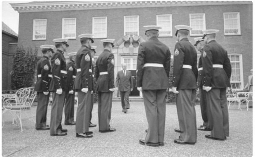
Gerald Ford poistumassa Yhdysvaltojen Helsingin-suurlähetystöstä elokuussa 1975. Suuntana on Neuvostoliiton lähetystö Tehtaankadulla.