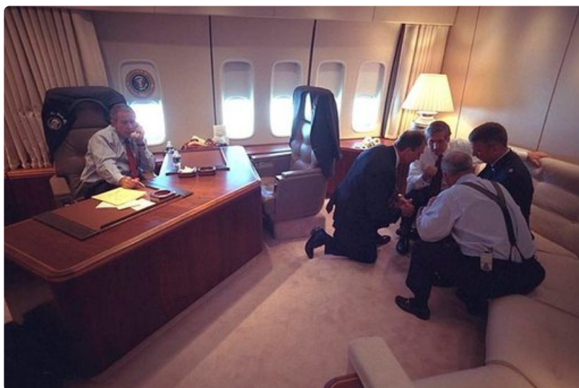
Air Force Onessa oli terrori-iskujen jälkeen intensiivinen tunnelma.