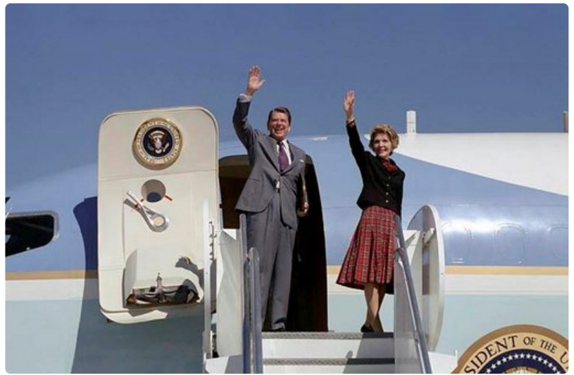
Ronald ja Nancy Reagan heiluttamassa yleisölle vuonna 1981.