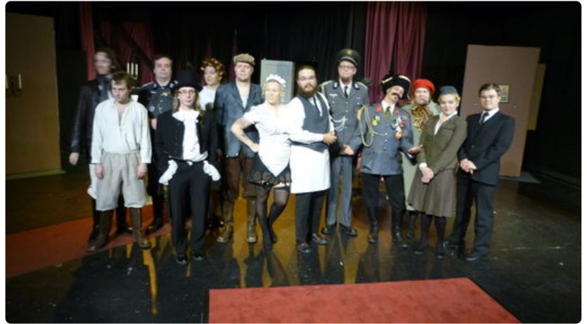
Maanalainen armeija iski jälleen, viimeksi tällä porukalla Lapuan ammattitaisoisessa amatööriteatterissa.