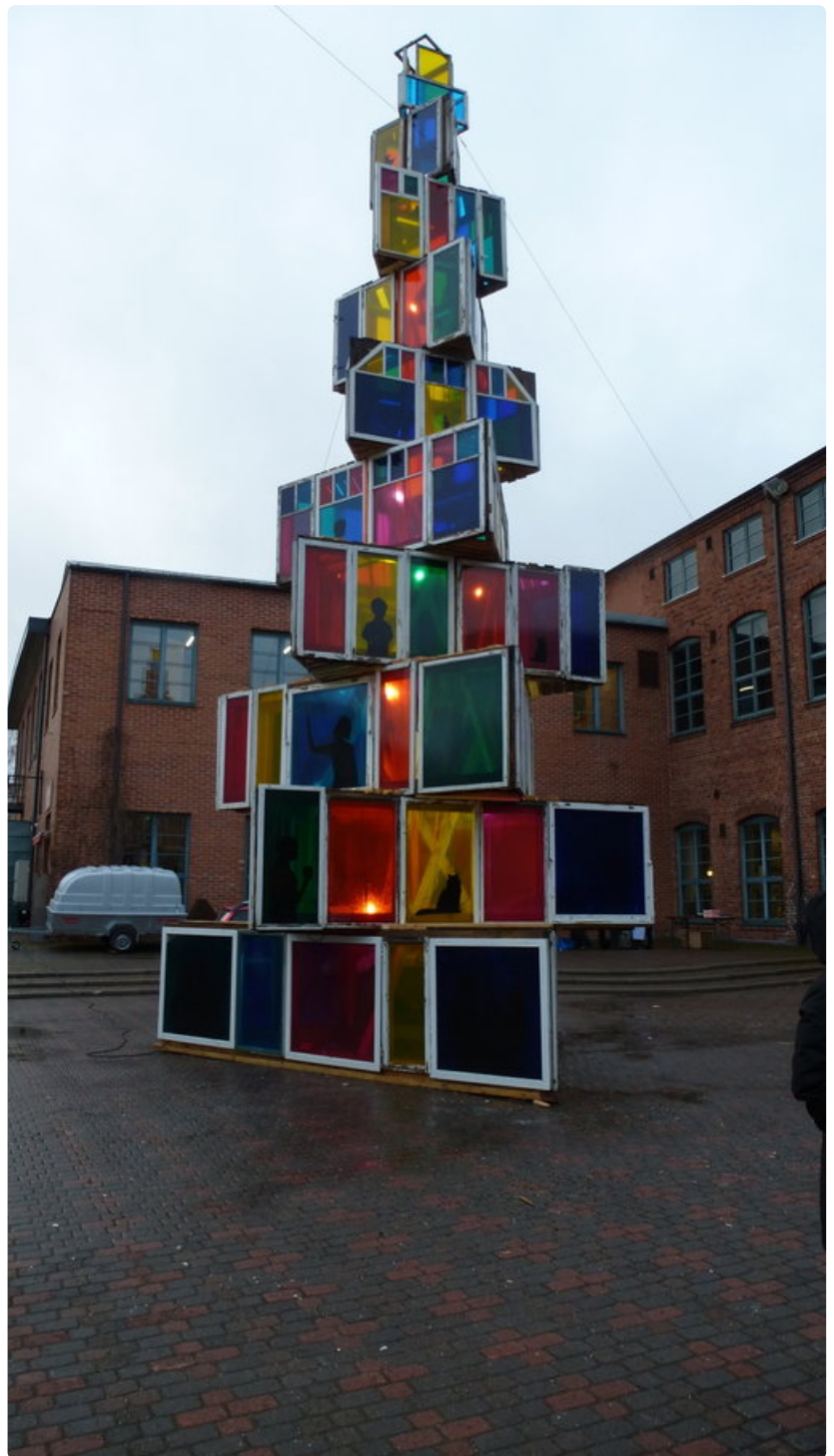
Lapuan ystävyyskaupunki Rakvere Virossa lahjoitti jälleen joulukuusen Kulttuurikeskus