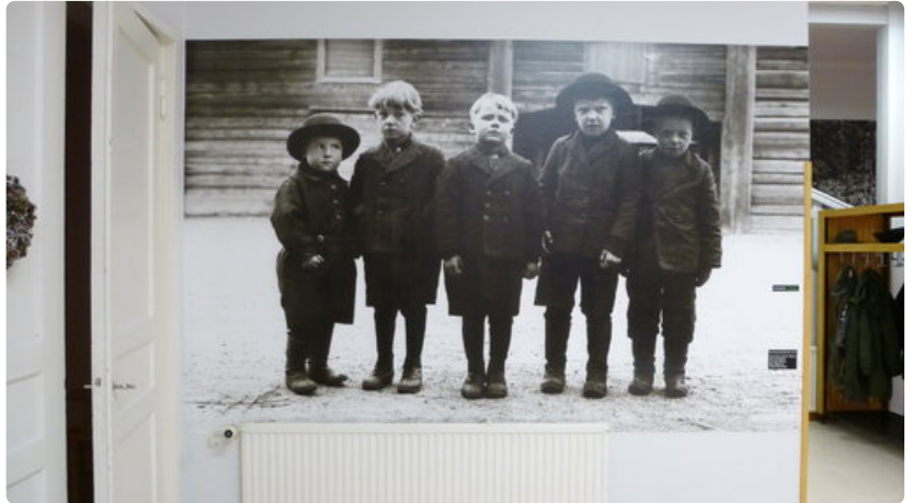
Lapualaispoikien pukukoodi 1930-luvulta. Valokuvasuurennoa Wanhan Karhunmäen seinällä tervehtii Körttimuseoon saapuvia.