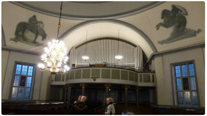
Suomen suurimmat urut soivat Lapuan tuomiokirkossa. Koko Pohjoismaista vain Göteborgissa on vielä suuremmat.