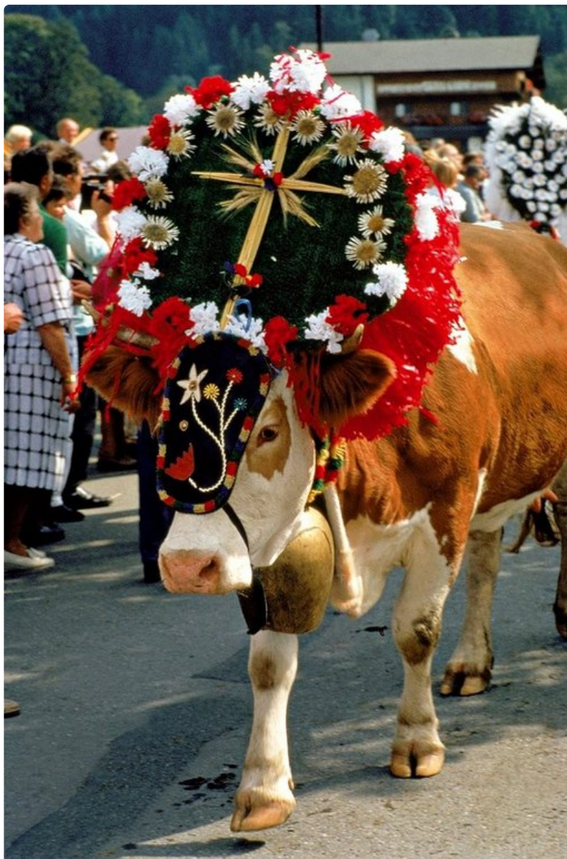
Tirolissa tapahtuu.

Dolomiittien jylhät alppimaisemat ovat ainutlaatuisia, sillä vuoret ovat muodostuneet punertavasta dolomiittikivestä. Vuoristokyllissä näkyy niin Italian kuin Itävallankin vaikutteita. Patikoinnin lisäksi nautitaan hyvästä ruoasta ja kulttuurista, viikon aikana vieraillaan Veronassa ja Venetsiassa. Vaellusten taso on koettu hyväksi ja kiitosta on saanut myös se, että aikaa jää kaupunkien tutustumiseen.