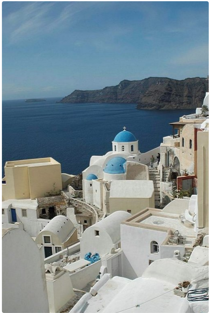
Santorinin värit avautuvat suomalaisille myös ensi kesänä.