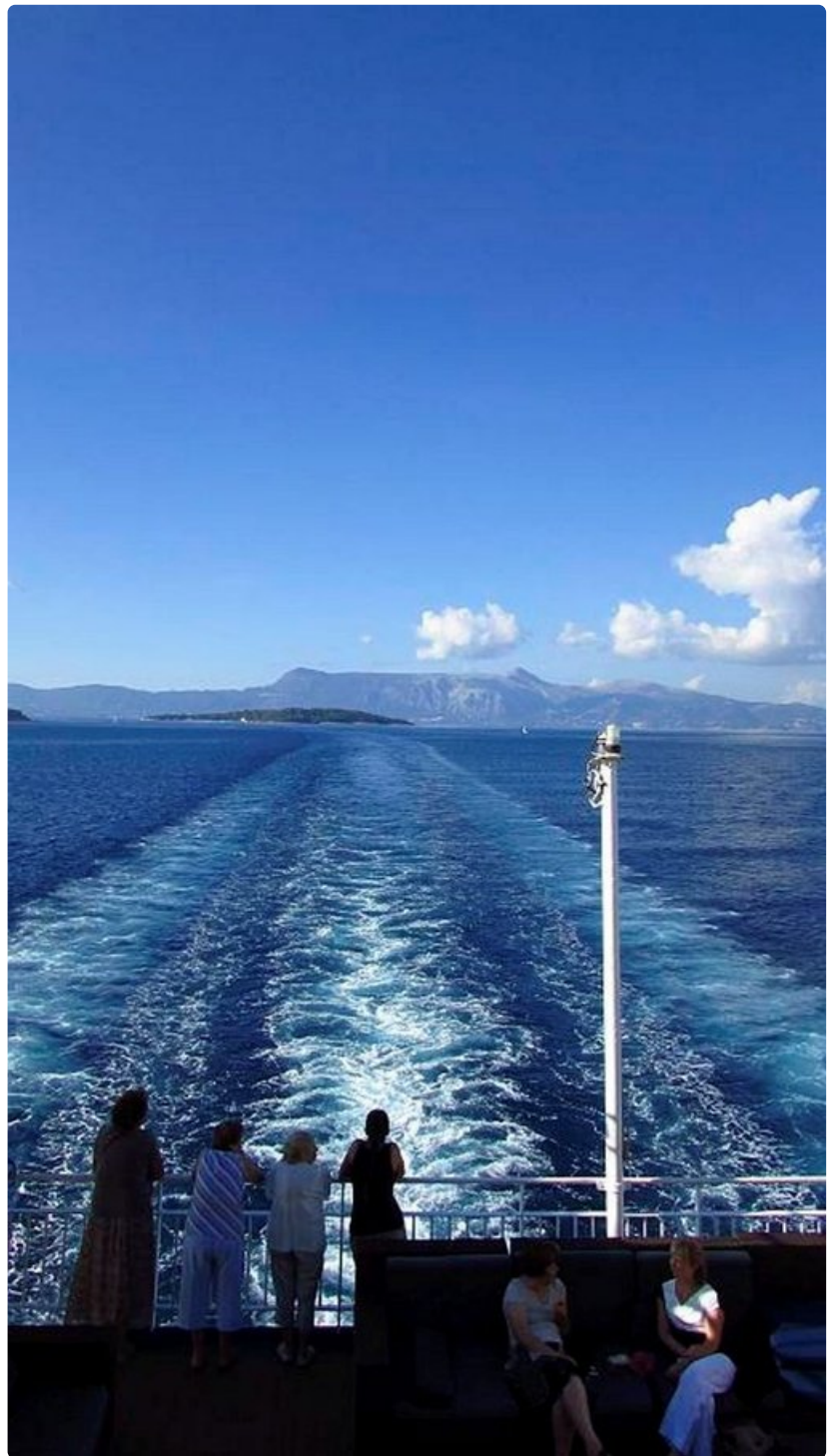
Erilainen all inclusive-loma Välimeren maisemissa sopii yksinmatkustaville, pariskunnille ja perheille. Viikon aikana vierailaan mm. Roomassa, Kreetalla, Ateenassa, Kusadasissa, Mykonoksella ja Santorinilla.

CrossNature® on ulkona tapahtuvaa kehonpainoharjoittelua. Harjoitus on yksinkertainen ja sen voi suorittaa luonnossa yksin tai