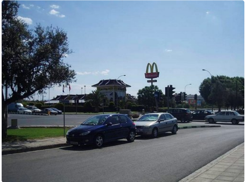
Drive-in McDonalds pääkaupunki Nikosian vilkkaassa risteyksessä.