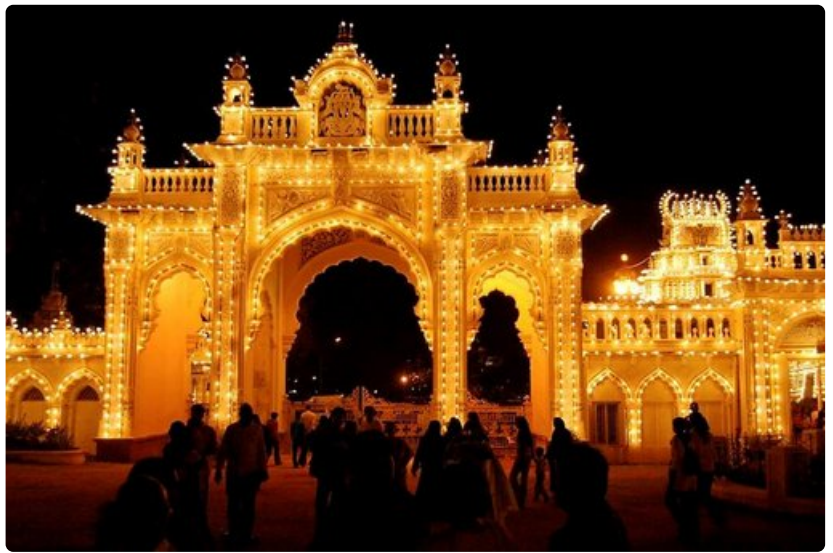
Mysoren palatsi kylpee iltavalaistuksessaan.