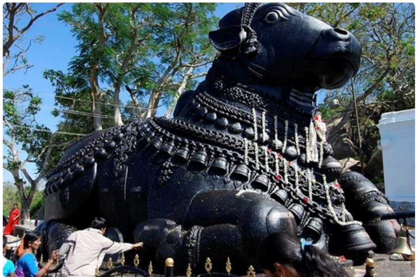
Nandi-härkä on suosittu pyhiinvaelluskohde.