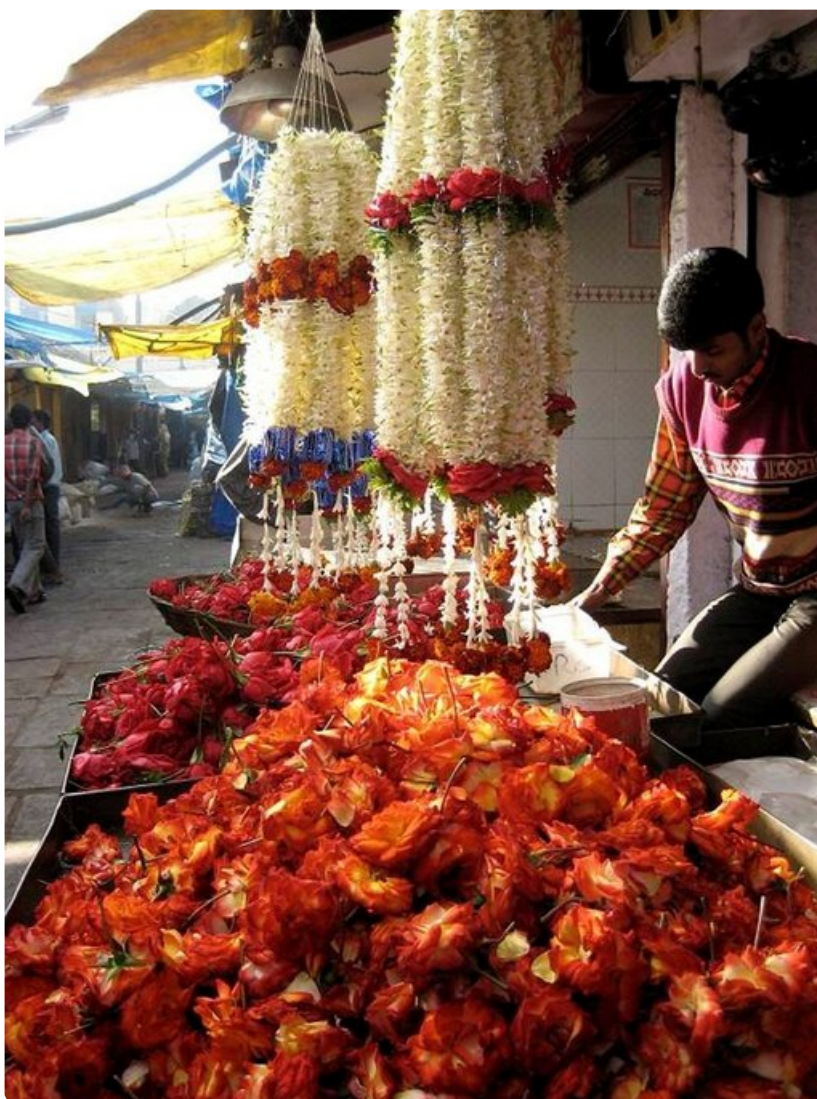
Devarajan torin kukkaloistoa.