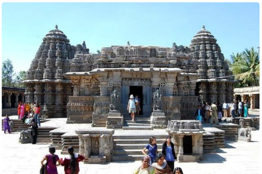
Somnathpurissa sijaitsee taidokas Keshava temppeli.