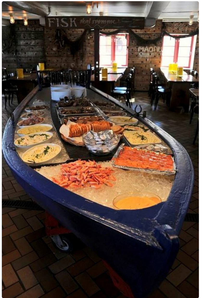
Seisova pöytä bornholmilaiseen tapaan. Kaikki on takuutuoretta.