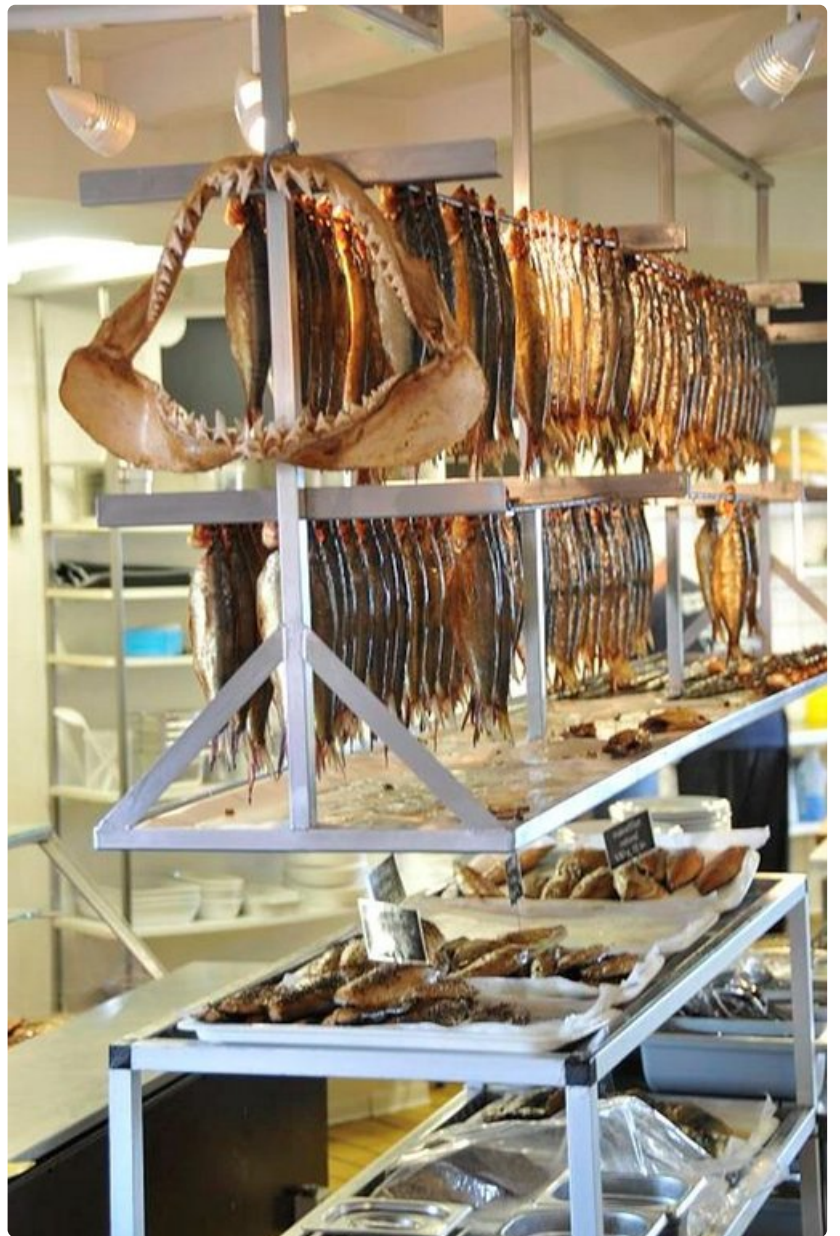
Vasta savustettua kalaa ja mukaan eksynyt hain purukalusto.