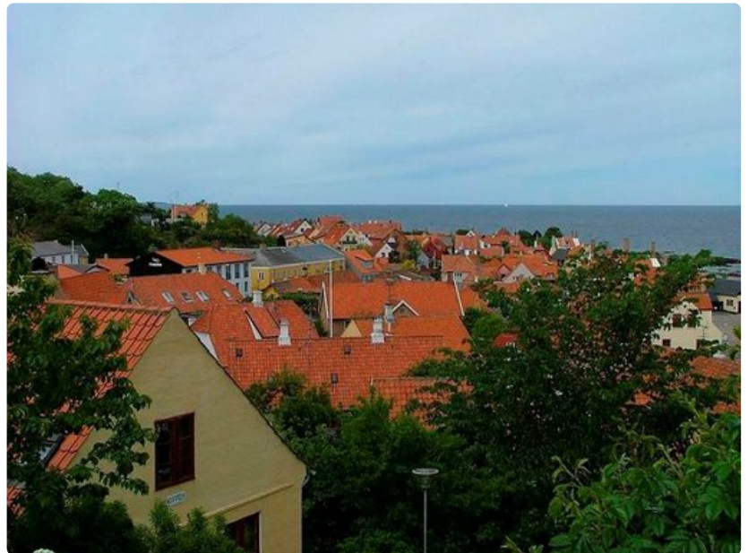
Gudhjem sijaitsee meren ääressä ja siellä on pienvenesatama.