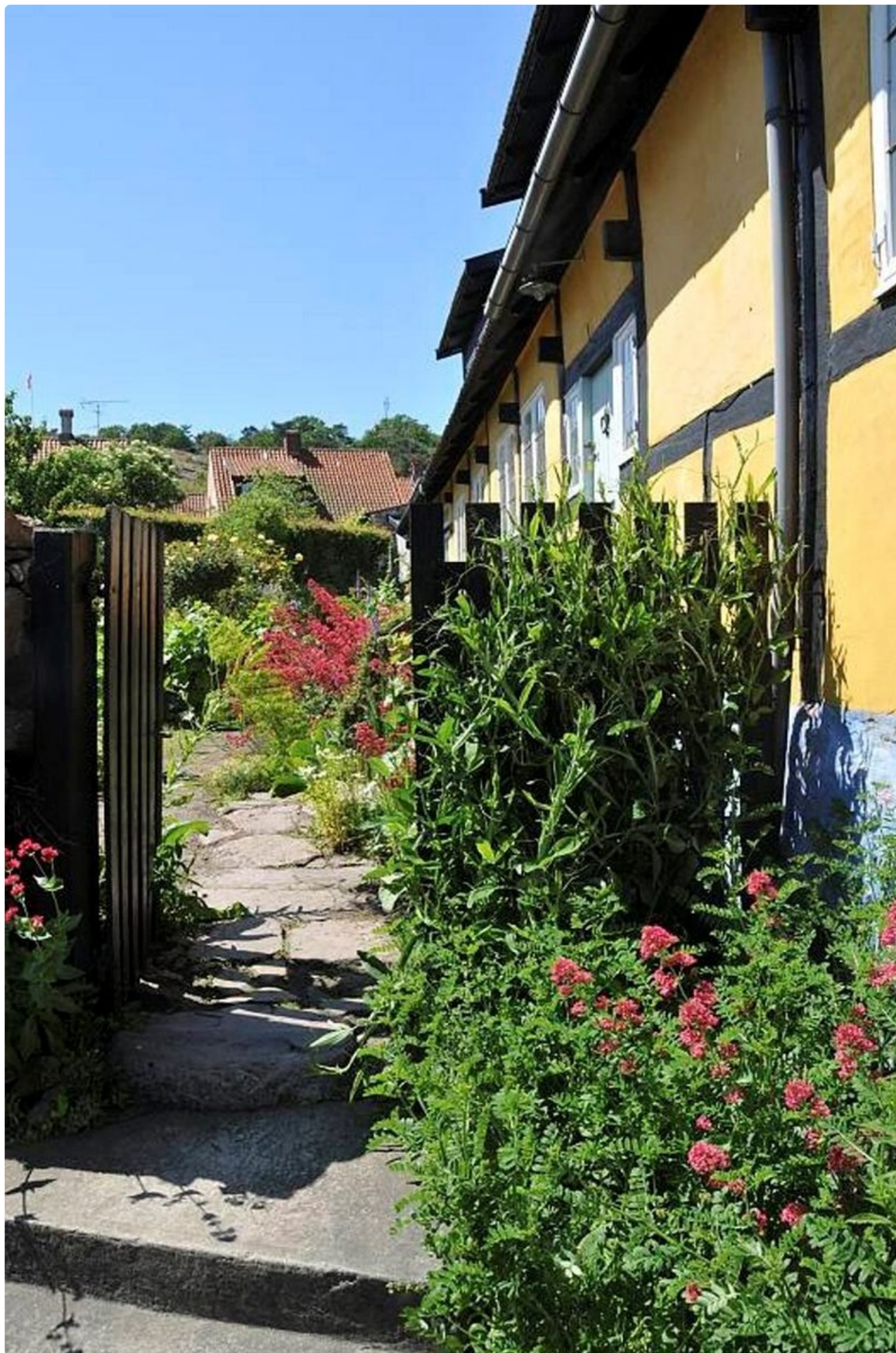
Bornholm - Itämeren vihreä jalokivi