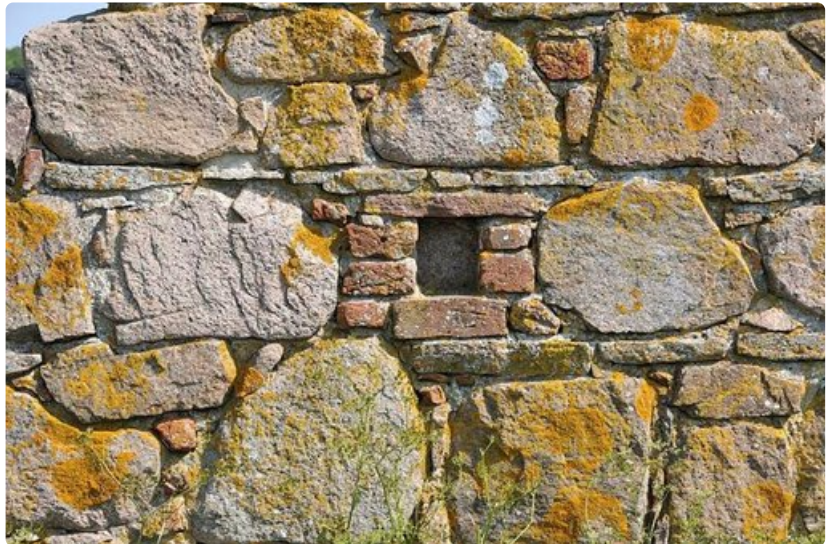
Linnoituksen koristeellinen ampuma-aukko.

Ronnesta voi vuokrata polkupyörän, mopon tai auton. Myös punaiset bussit vievät matkailijan sujuvasti eri kohteisiin. Bussilinjoja on yhdeksän ja päivälippu maksaa noin 18 euroa. Taksilla pääsee myös paikasta toiseen. Pisin matka Ronne-Nexö maksaa noin 50 euroa. Monet entiset kalasatamat toivottavat pienveneilijät tervetulleiksi suojaisille laitureilleen.