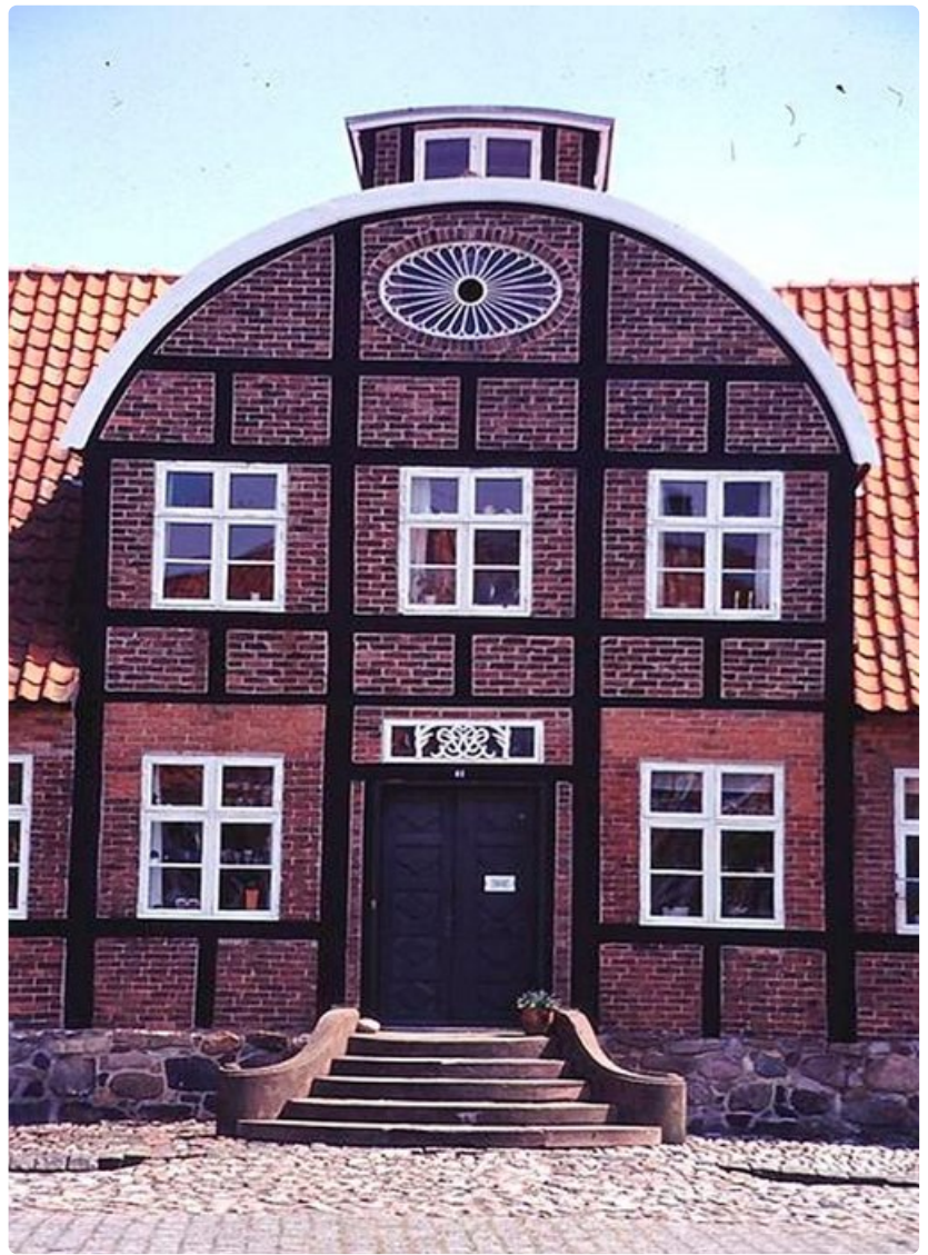
Perinteistä tiiliarkkitehtuuria 1800-luvulta.

Miten pääsee: saarelle on lukuisia suoria lauttayhteyksiä ja lentoja, ainoa lentokenttä on Ronnessa