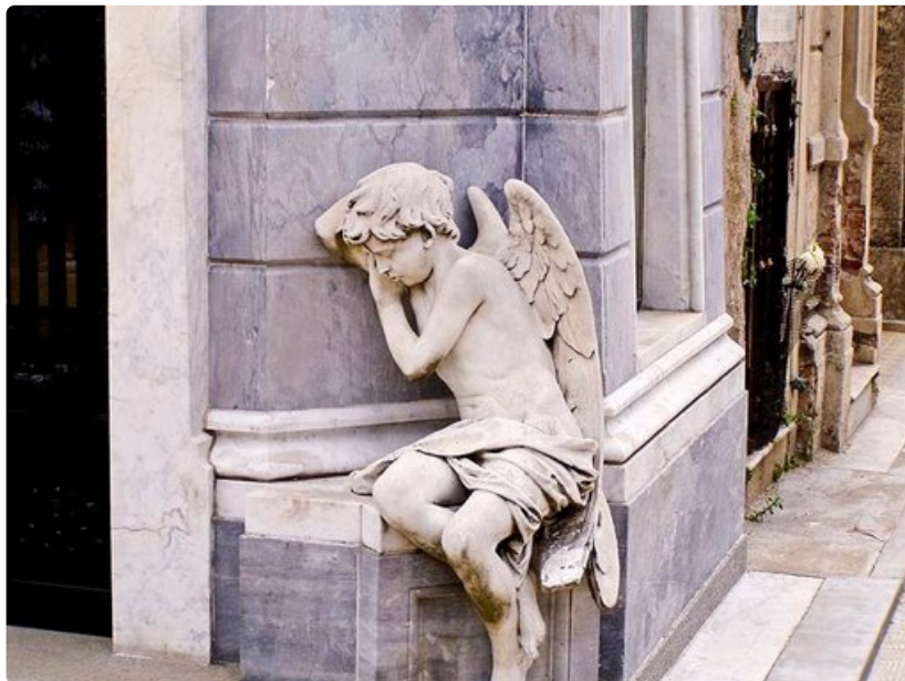
Cementerio de la Recoleta on monien tunnettujen henkilöiden viimeinen leposija.

Matkustusasiakirjat: Suomalaiset saavat maahan tullessaan automaattisesti 90 päivän viisumin. Passin tulee olla voimassa vähintään kuusi kuukautta matkan jälkeen.