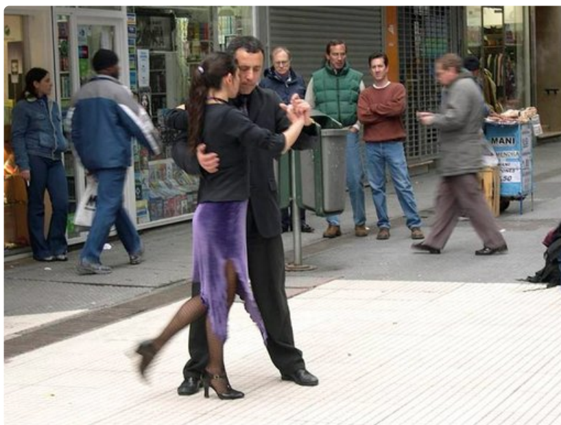
Tango on argentiinalaisten suuresti rakastama tanssi.