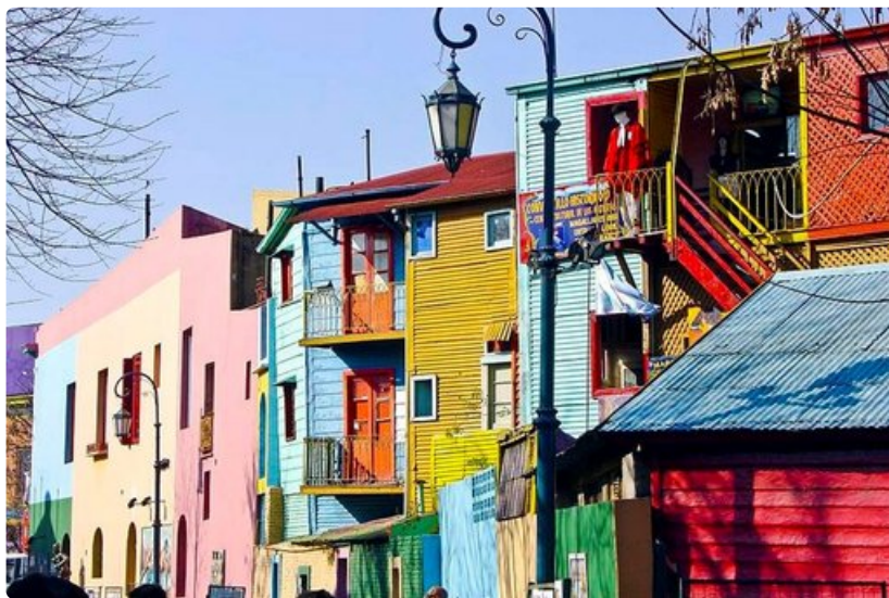
La Bocan värikkäät talot ovat herkkua silmille.

Argentiinan pääkaupunki Asukasluku: 13 miljoonaa Kieli: espanja, englantia ei puhuta yleisesti, joten ennen matkaa kannattaa opetella matkailusanastoa espanjaksi. Valuutta: Argentiinan peso (ARS) 1€ = 6,8 ARS