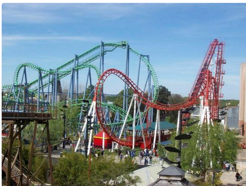
Parque de la Costa on Etelä-Amerikan suurin huvipuisto.