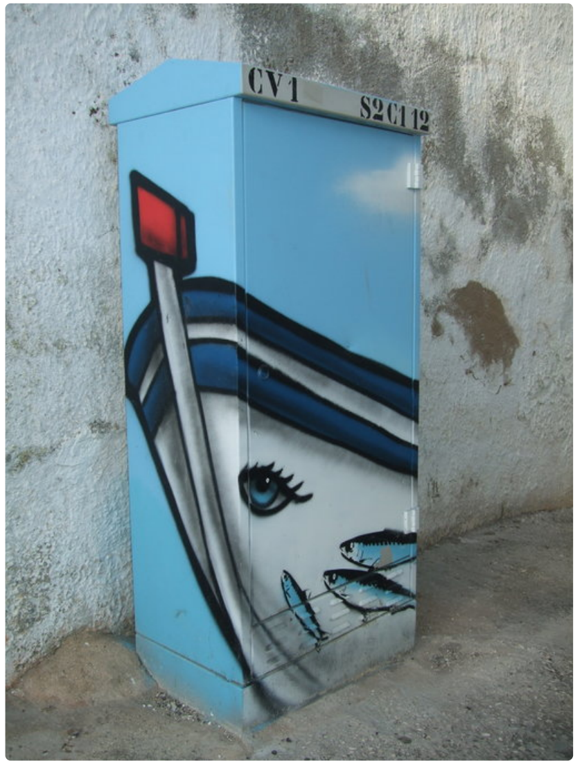
Merelliset aiheet muistuttavat Carvoeiron sijainnista Atlantin rannalla.