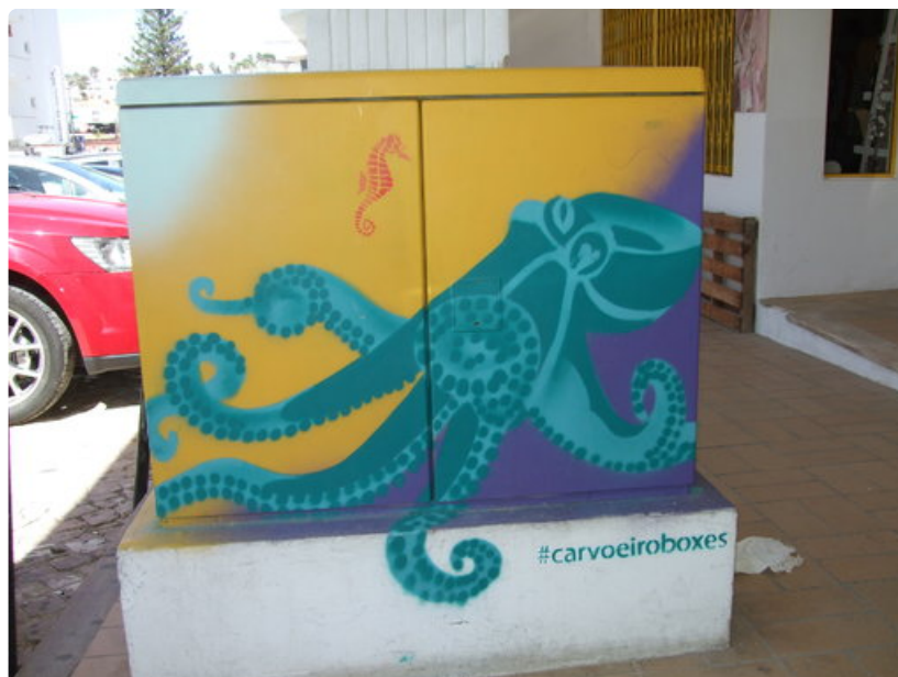
Paikallinen luonto on katutaiteilijoiden ensisijainen inspiraation lähde.