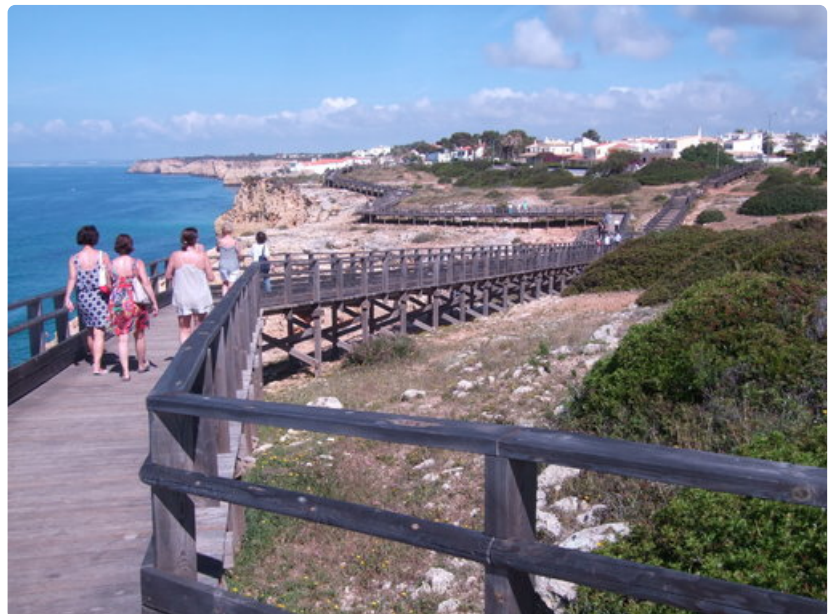
Rantatörmät ovat rosoisia. Patikointia on helpotettu satojen metrien pituisilla kävelysilloilla. *