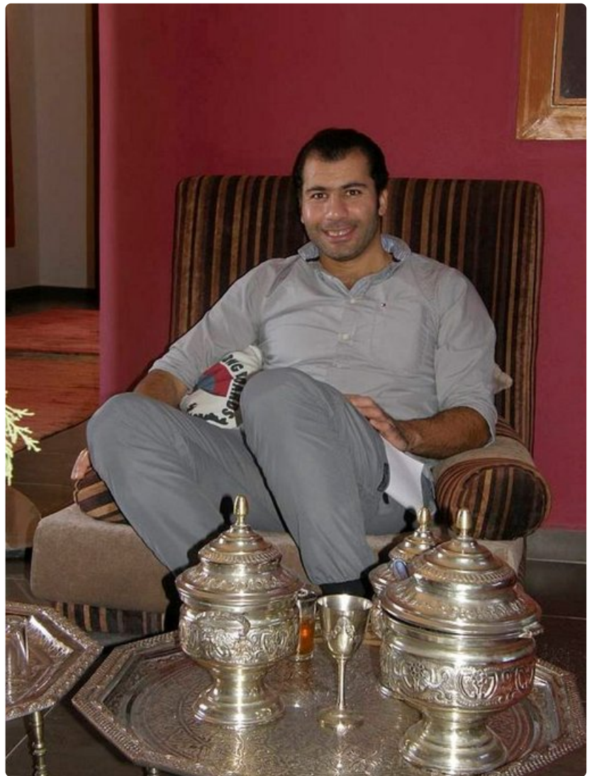
Marokossa tarjoillaan minttuteetä, eli berberiviskiä, joka puolella ja jokaisella kellonlyömällä. Astiastoon panostetaan ja moni tuo upean teesetin tuliaisina myös Suomeen.

Marrakesh on Marokon kolmanneksi suurin kaupunki ja Marokossa vierailevalle ehdoton kohde. Maan matkailijavirrat jakautuvat pääosin Agadirin ja Marrakeshin kesken, mutta rantalomaa kaipaavat joutuvat jälkimmäisessä turvautumaan joko retkiin Atlantin rantakaupunkeihin tai luksushotellien uima-altaisiin ja kylpyläosastoihin.