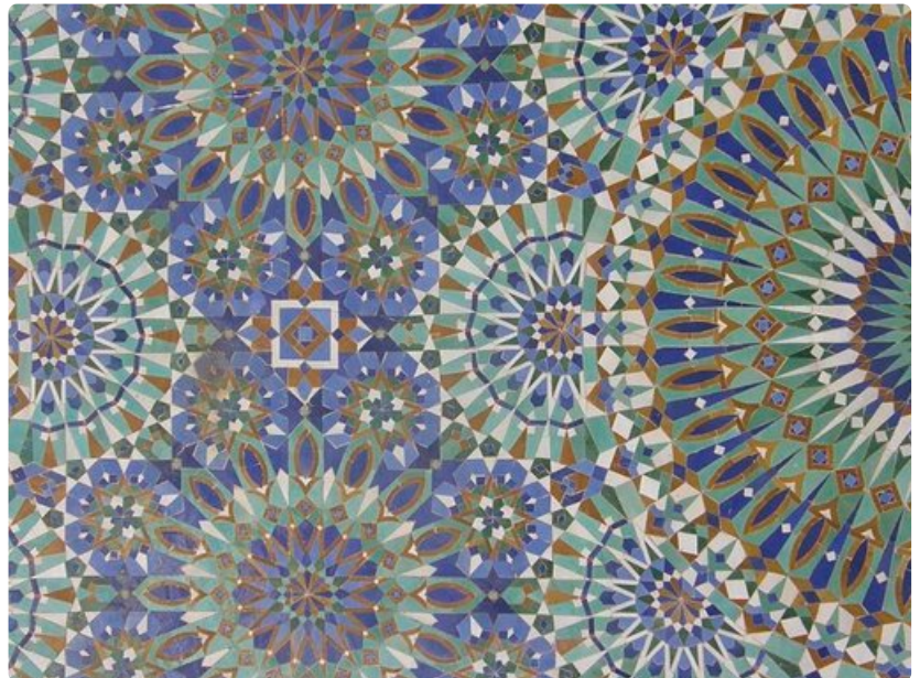
Marokon mosaiikkiosaaminen herättää kunnioitusta.