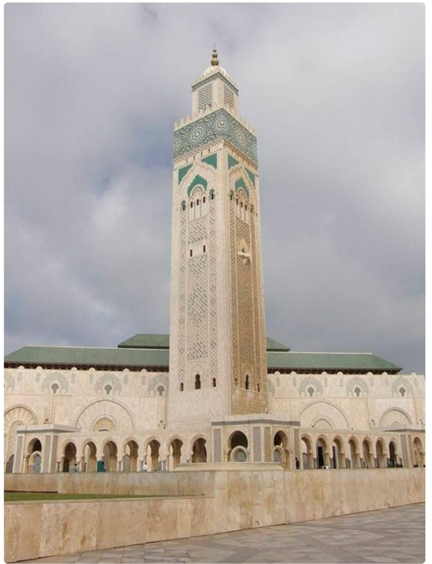
Hassan II:n moskeija Casablancassa on maailman toiseksi suurin moskeija. Sen sisätilat vetävät jopa 25 000 ihmistä.