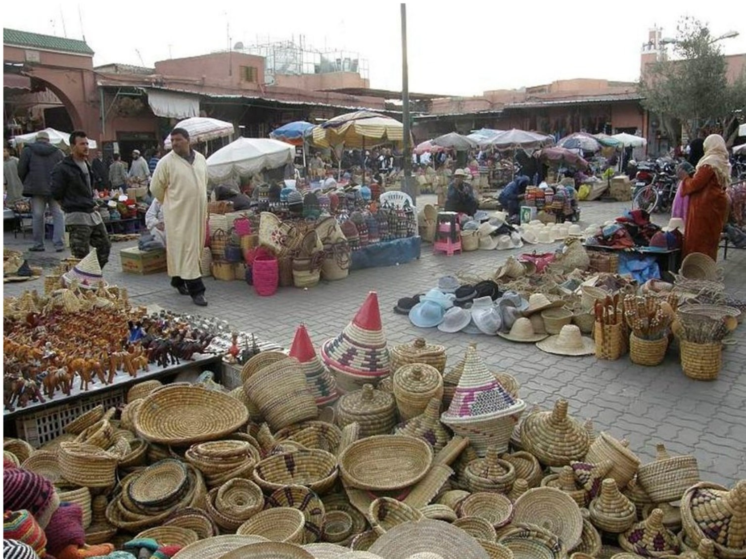
Marrakeshin Medinan kujat ovat täynnä houkutusia.