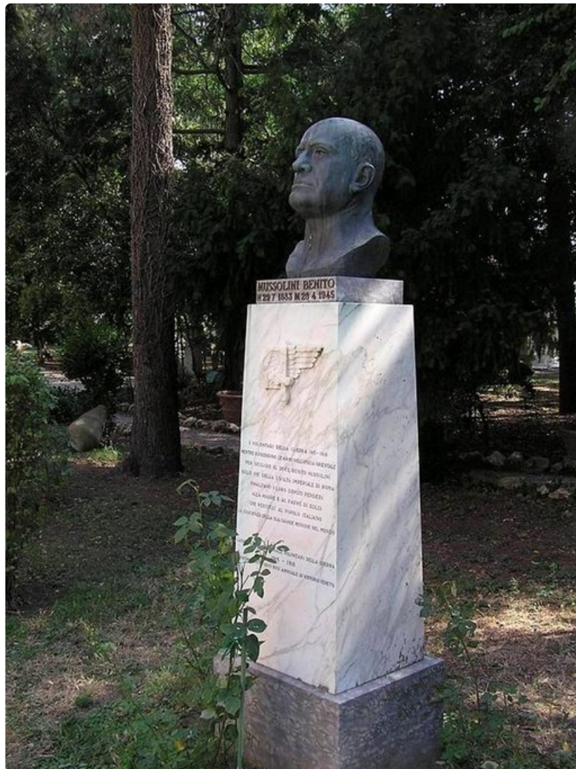
Diktaattorin patsas kotimuseon pihamaalla.

Kotimuseoon pääsee tutustumaan ainoastaan opastetuilla kierroksilla, jotka ovat pelkästään italiankielisiä. Talon henki avautuu kävijälle siitä huolimatta. Vaikka diktaattorin maine ei ole erityisen hyvä, inhimillistyy hän oman kotinsa seinien sisäpuolella historian henkilökseksi, jossa valta muuttui tragediaksi.