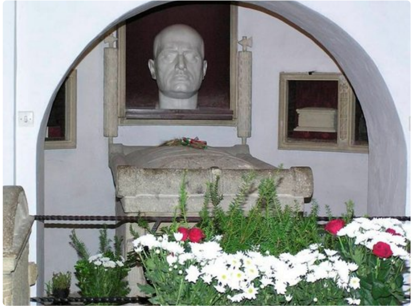
Benito Mussolinin hauta Predappion San Cassianon hautausmaalla on matkailunähtävyys ja kulttipaikka.