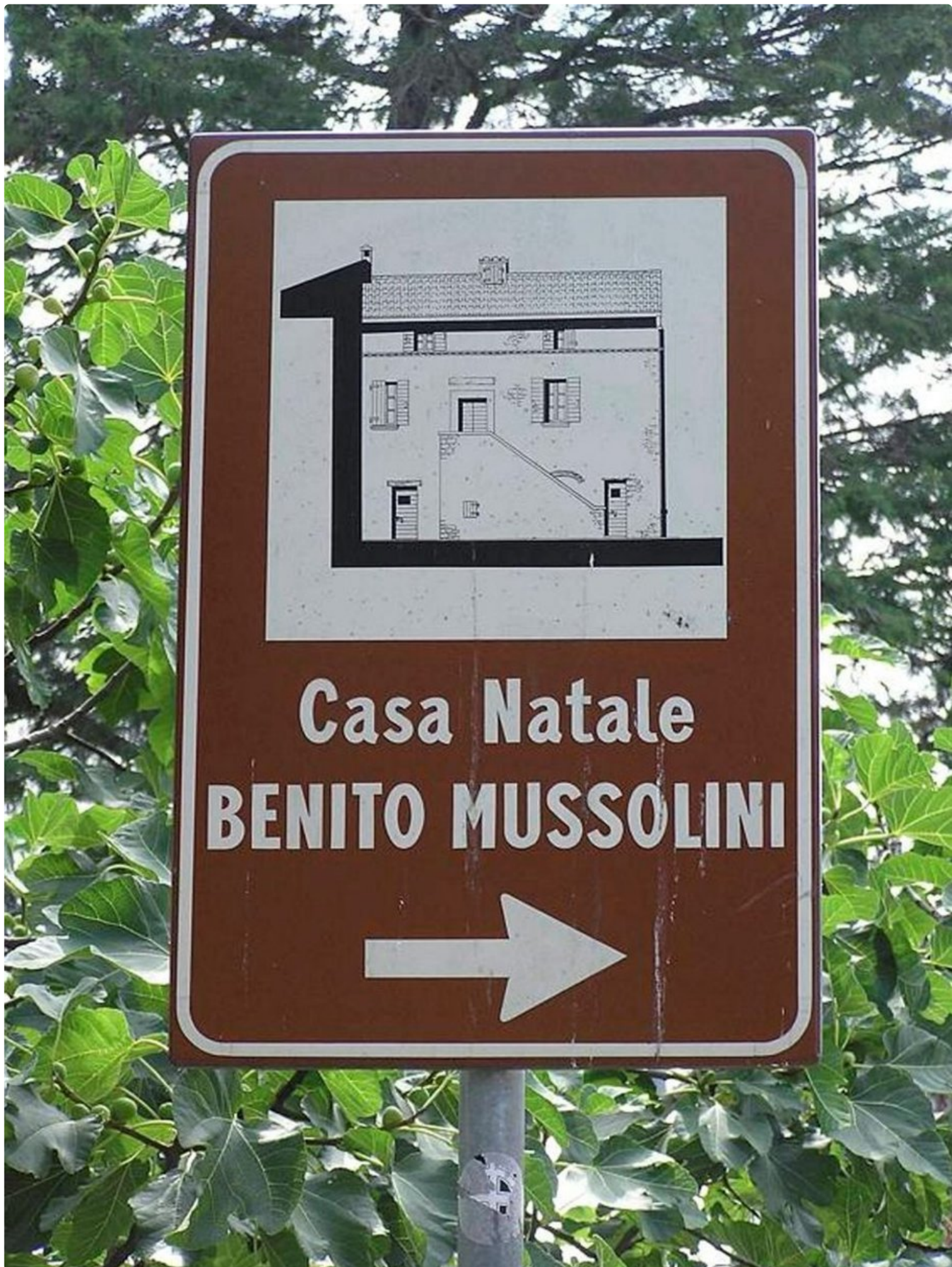
Opaste Mussolinin syntymäkotiin Predappiossa.

Diktaattorin muistot Italiassa - Poikkeuksellinen Predappio