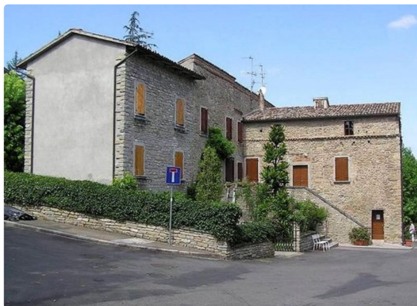
Villa Carpena oli Mussolinin siviiliasunto, jossa toimii nyt museo La Casa dei Ricordi.