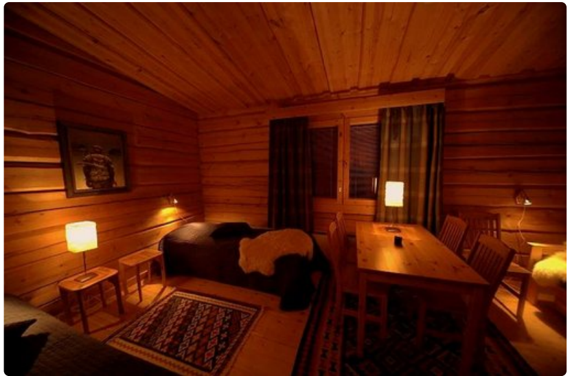
Aakenuksessa mahtuu yöpymään kaksikymmentä henkilöä.