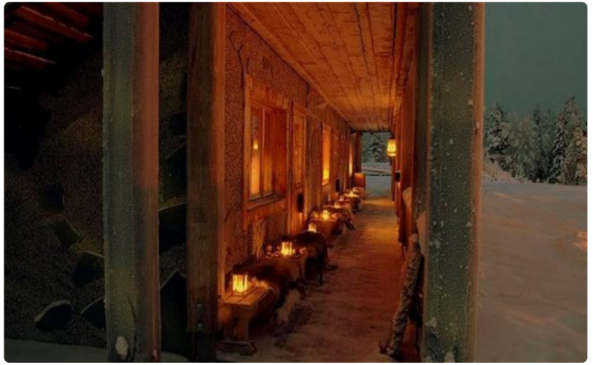
Erämaan keskellä sijaitseva hirsirakennus on tunnelmallinen lomanviettopaikka.

Destination Lapland: Loma-asuntojen vuokrausta Ylläksellä 25 vuotta. Tunturin suurimpia majoittajia 400 asunnollaan. Tarjoaa mökkien kokonaisvaltaisen vuokrauksen ja huollon. Viikkainpina vuosina 10 000 kotimaista ja 5000 ulkomaista matkailijaa.