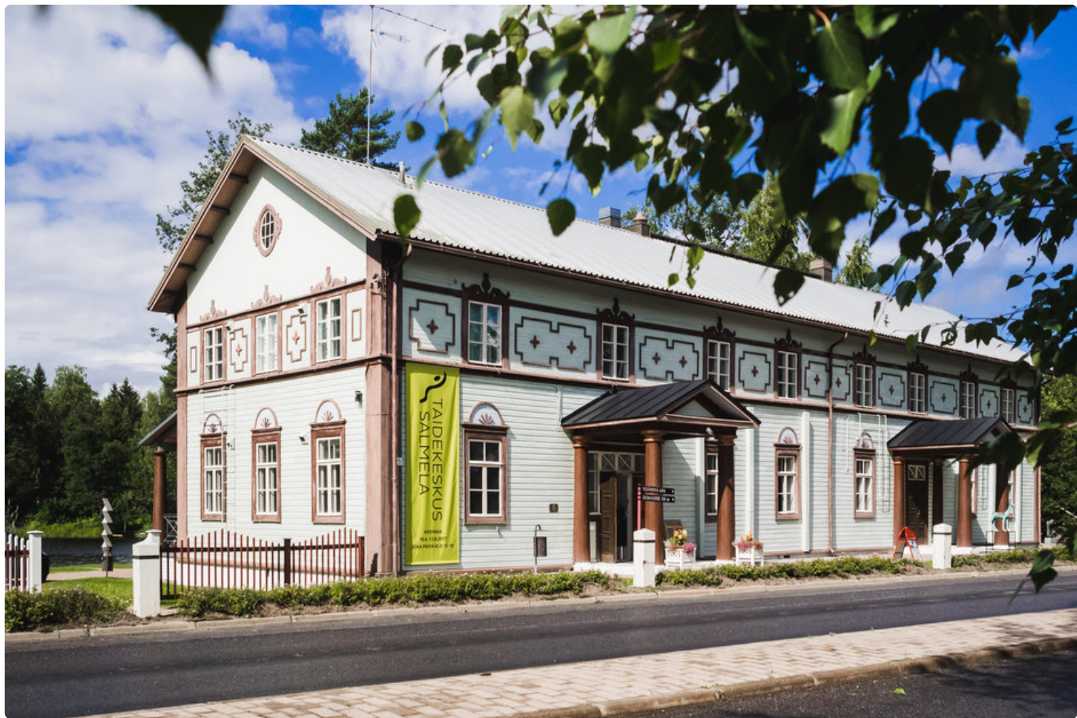
Salmelassa soi Elvis.