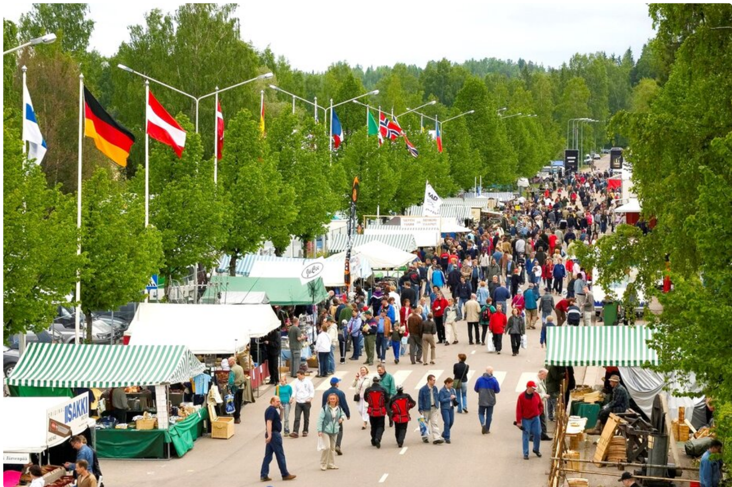
Erämessutunnelmaa vuodelta 2004.