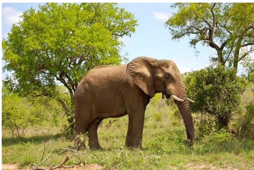
Yksi Krugerin kansallispuiston huippuhetkimästä on villien norsujen kohtaaminen.