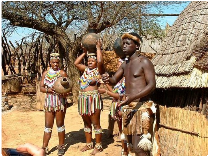
Paikallisten elämään pääsee osana kyliin kohdistuvaa päiväretkä.