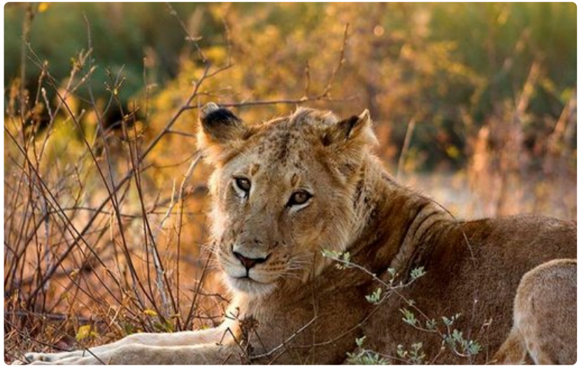
Krugerin kansallispuiston tarjontaan kuuluvat myös leijonat.