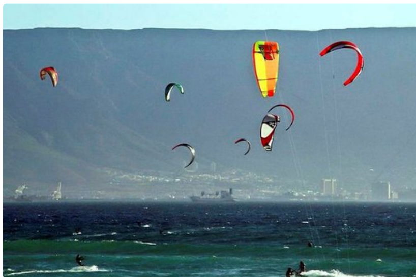
Vesiaktiviteetit ovat Etelä-Afrikan parhaita puolia.