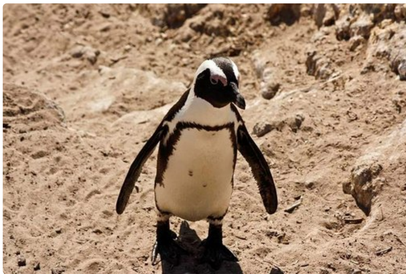
Pingviinejä näkee useilla rannoilla kuten Kapkaupungin lähellä Boulder Bayssä.

Rannat kuuluvat paikallisten arkeen ymmärrettävistä syistä. Rantalinjaa on yli 3000 kilometriä ja hiekkarantoja toistasataa. Suurin osa silmiä hivelevistä rantaviivoista on länsirannikolla ja useat rannat ovat täysin tyhjiä muista ihmisistä. Erikoista on, että vaikka länsirannikolla ilma voi olla hyvinkin kuumaa, niin vesi on lähtökohtaisesti jäätävää. Toisin on itäpuolella, missä lämpimät merivirrat tekevät vesivälitteistä huomattavasti nautinnollisempia.