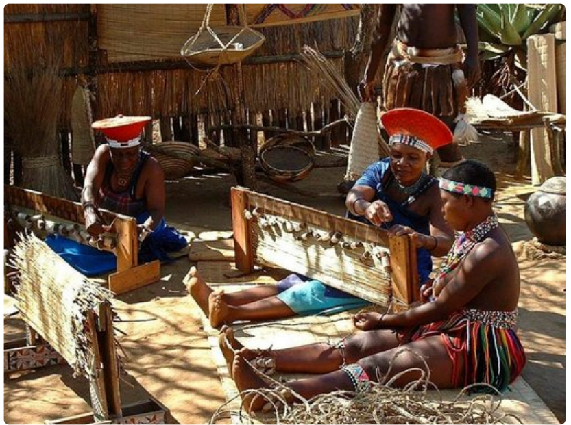
Paikalliset naiset valmistavat kutomalla erilaisia tuotteita.