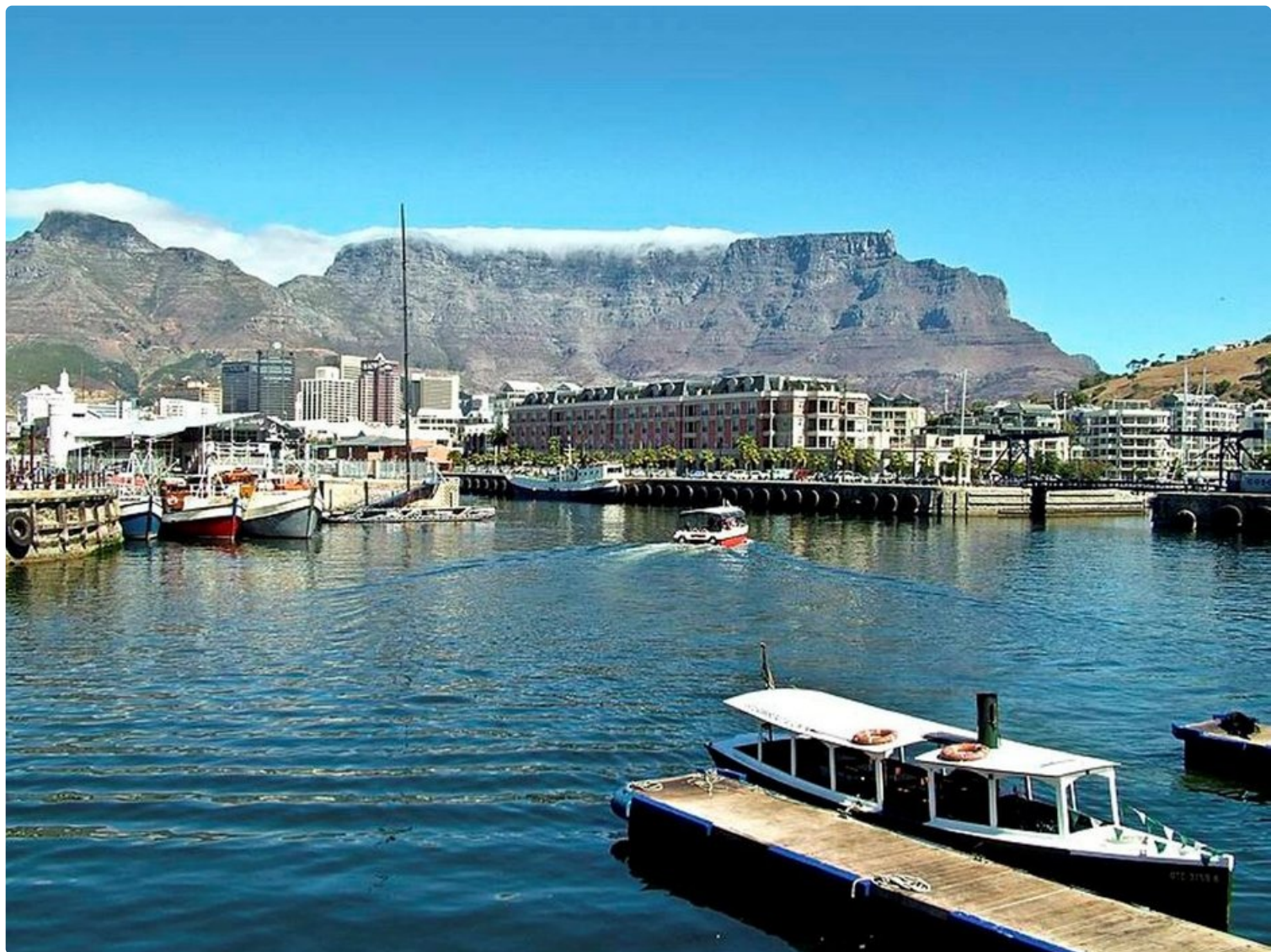
Kapkaupunki ja pöytävuori ovat Etelä-Afrikan parhaimmistoa.