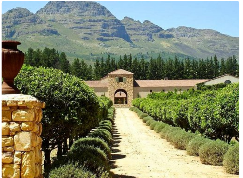
Etelä-Afrikassa on satoja viinitiloja, joissa pääsee maistelemaan maailmanluokan viinejä.