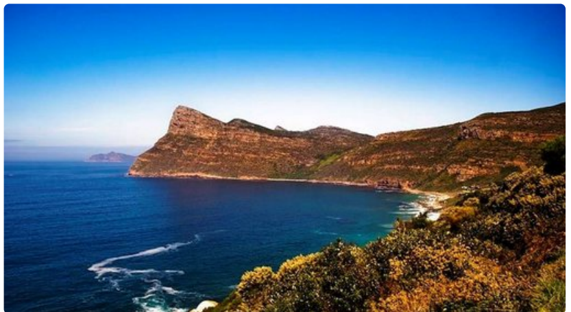
Etelä-Afrikasta eivät upeat rantalinjat lopu kesken.