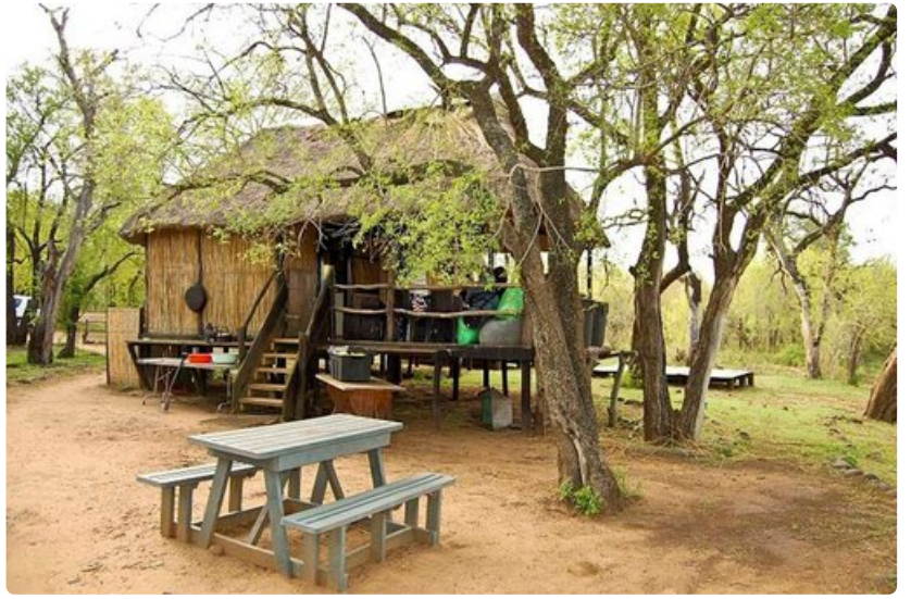
Kansallispuistovisiiteillä asumukset ovat yksinkertaisia, mutta hyvin hoidettuja.