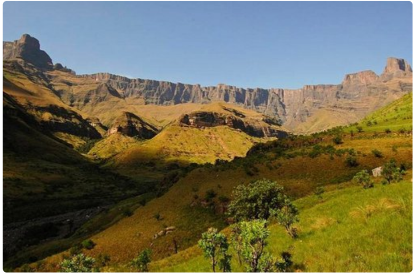
Drakensbergin vuoret ovat jylhiä ja sisältävät erinomaisia retkiä.