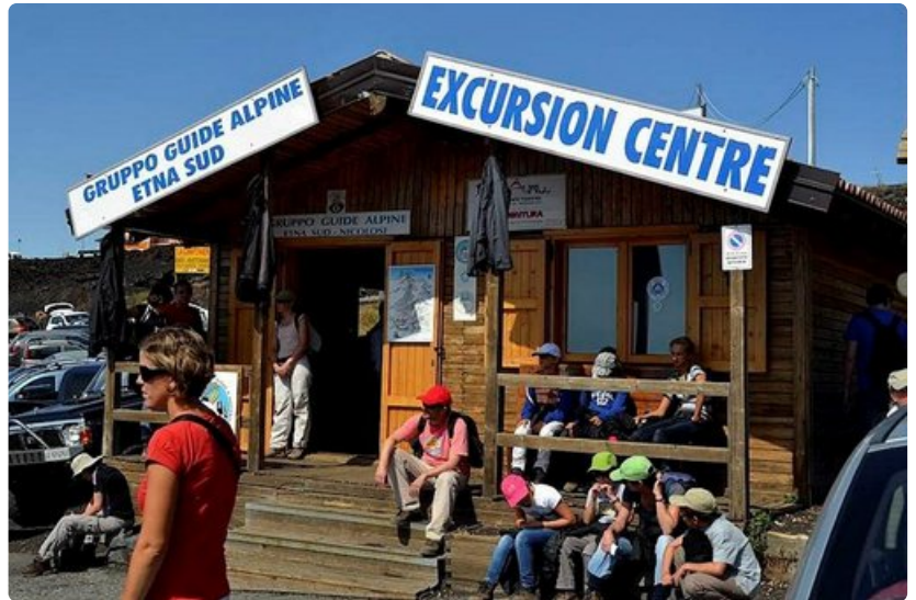
Opastetut patikkaretket Etnan huipulle lähtevät Excursion Centrestä Etnan etelärinteeltä. Turistit voivat vapaasti kierellä vuorella alle 2900 metrin korkeuteen asti. Sen yläpuolella on turvallisuussyistä sallittua liikkua vain koulutettujen vuoristo-oppaiden vetämissä ryhmissä.