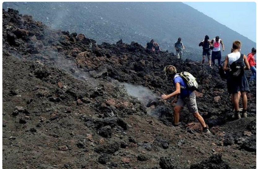
Maasto on paikoitellen vaikeakulkuista ja jäähettyneiden laavavirtojen ylittäminen vaatii tarkkaavaisuutta.