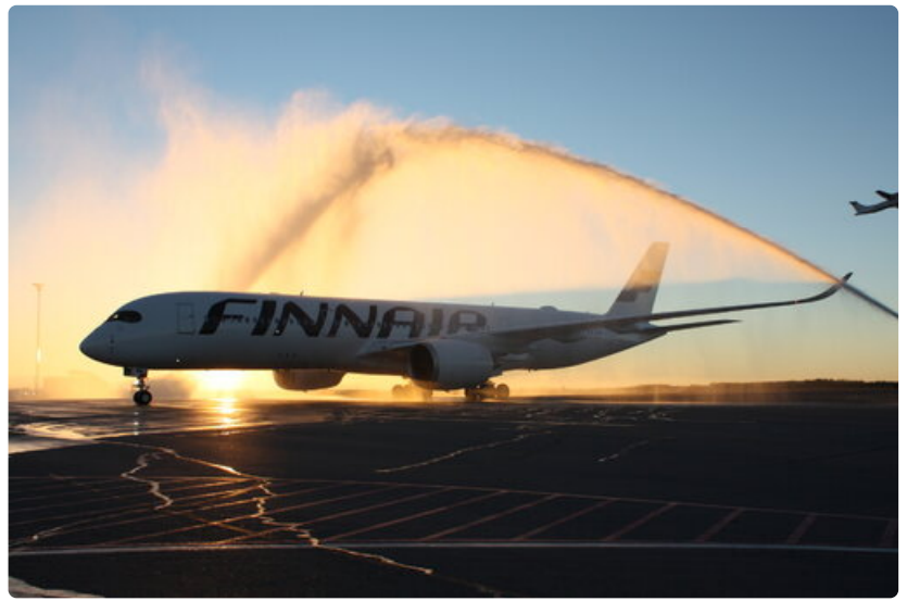
Finnairin ensimmäinen Airbus A350 laskeutui Helsinki-Vantaalle 7. lokakuuta 2015. Toimitusjohtaja Topi Manner ylistää koneen ominaisuuksia. Se on toimintavarma, huoltokustannukset ovat pienet ja niin henkilökunta kuin matkustajatkin tykkäävät siitä.

Tilannetta, että mahdollisen kapasiteetin loppuessa Aurinkomatkat alkaisi lentää jonkin toisen yhtiön koneilla lisäsarjaa vaikkapa Kreikkaan Timo Kousa ei pidä mahdollisena.