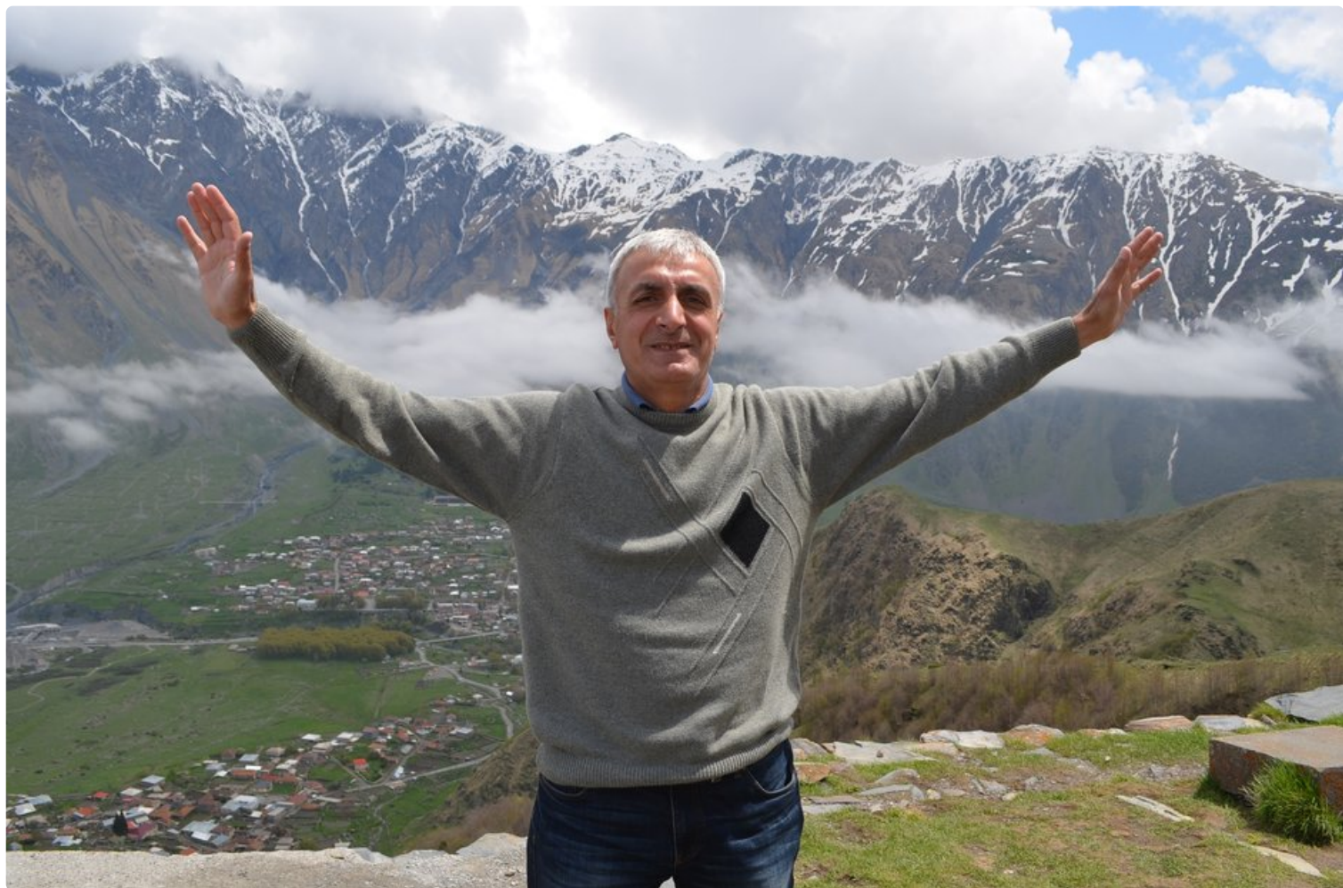
Kaukasusvuoristo hallitsee Georgian maisemia.