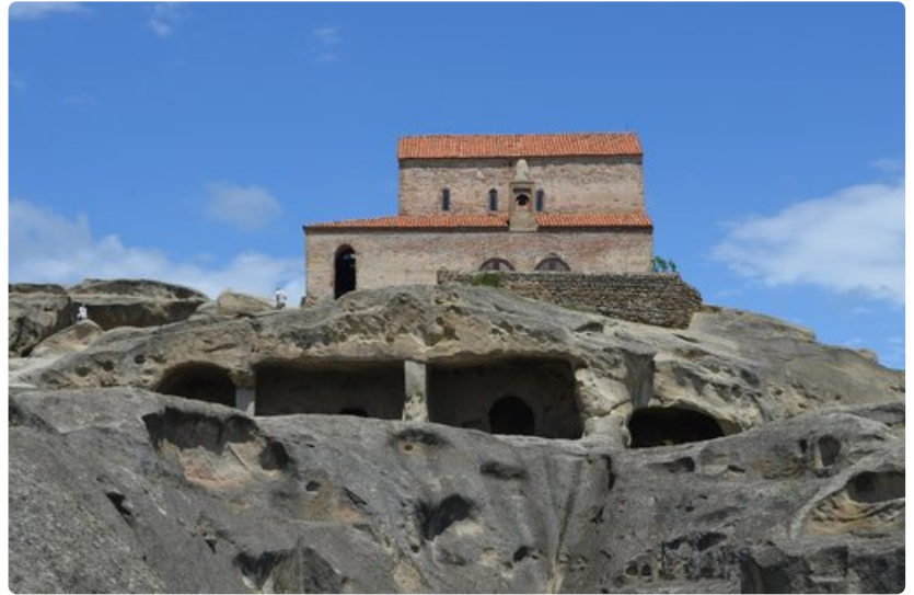
Uplitsikhessa asuttiin näissä luolissa tuhansia vuosia sitten.