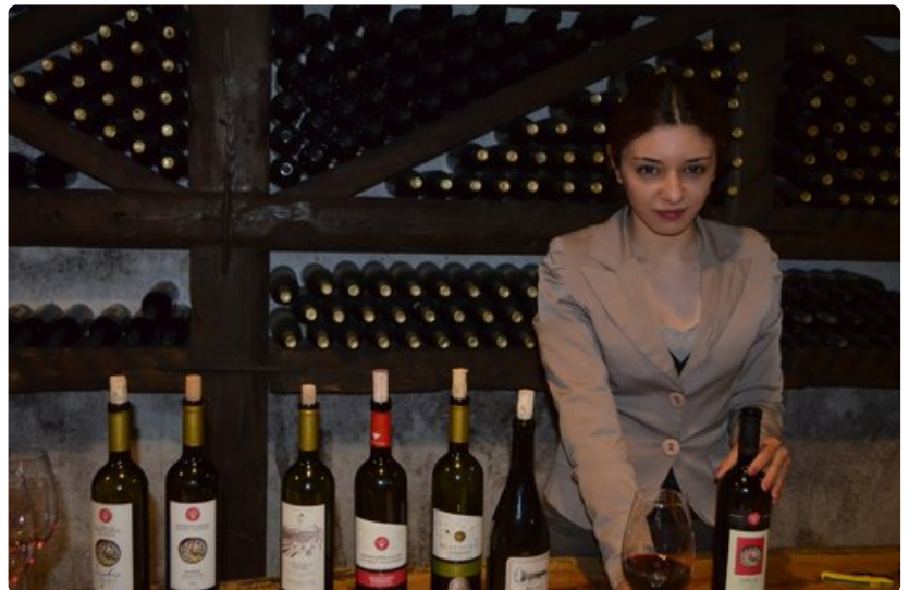
Georgiassa on tehty viiniä 7000 vuotta.