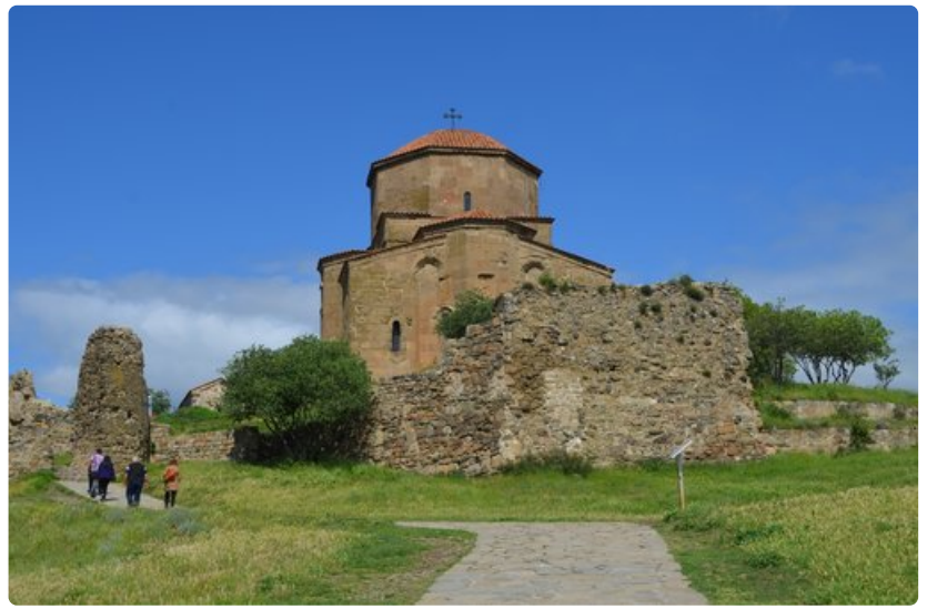
Kristinusko tuli Jvarin luostariin 300-luvulla.

Sopii lopettaa Signagiin, "rakkauden kaupunkiin". Kaunis turistikaupunki on ympäröity neljän kilometrin pituisilla muureilla: kun muualla muureja purettiin, täällä kaupunginmuurit rakennettiin vasta 240 vuotta sitten, varmuuden vuoksi. Otamme loppuksi kahvilassa tšatšan, joka maksaa neljä laria. Kaupunki on täynnä turisteja, yllätys yllätys, Venäjältä. Viisumivapaus, kuten suomalaisillakin.