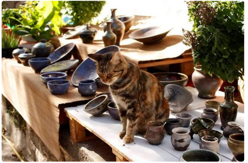
Kissaemo seuraa arvopaikaltaan maassa telmivää poikastaan.