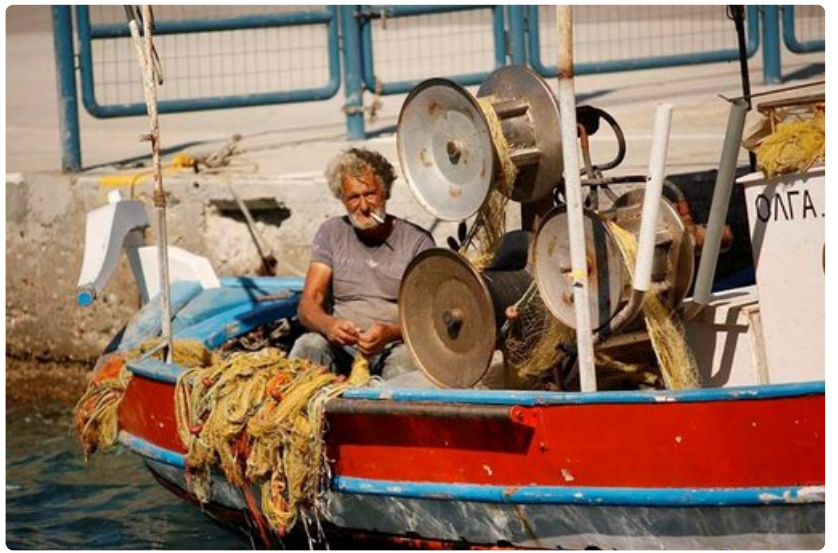
Aamuvrhainen kalareissu on takana. Kreikkalaisen kalastajan päivä kuluu välineitä kunnostamalla.