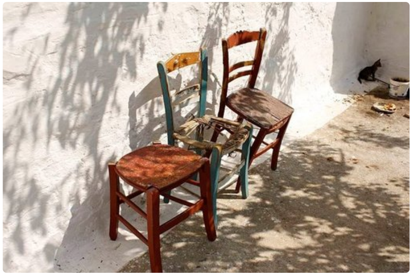
Mummon tai papan jakkara on käytössä kulunut.