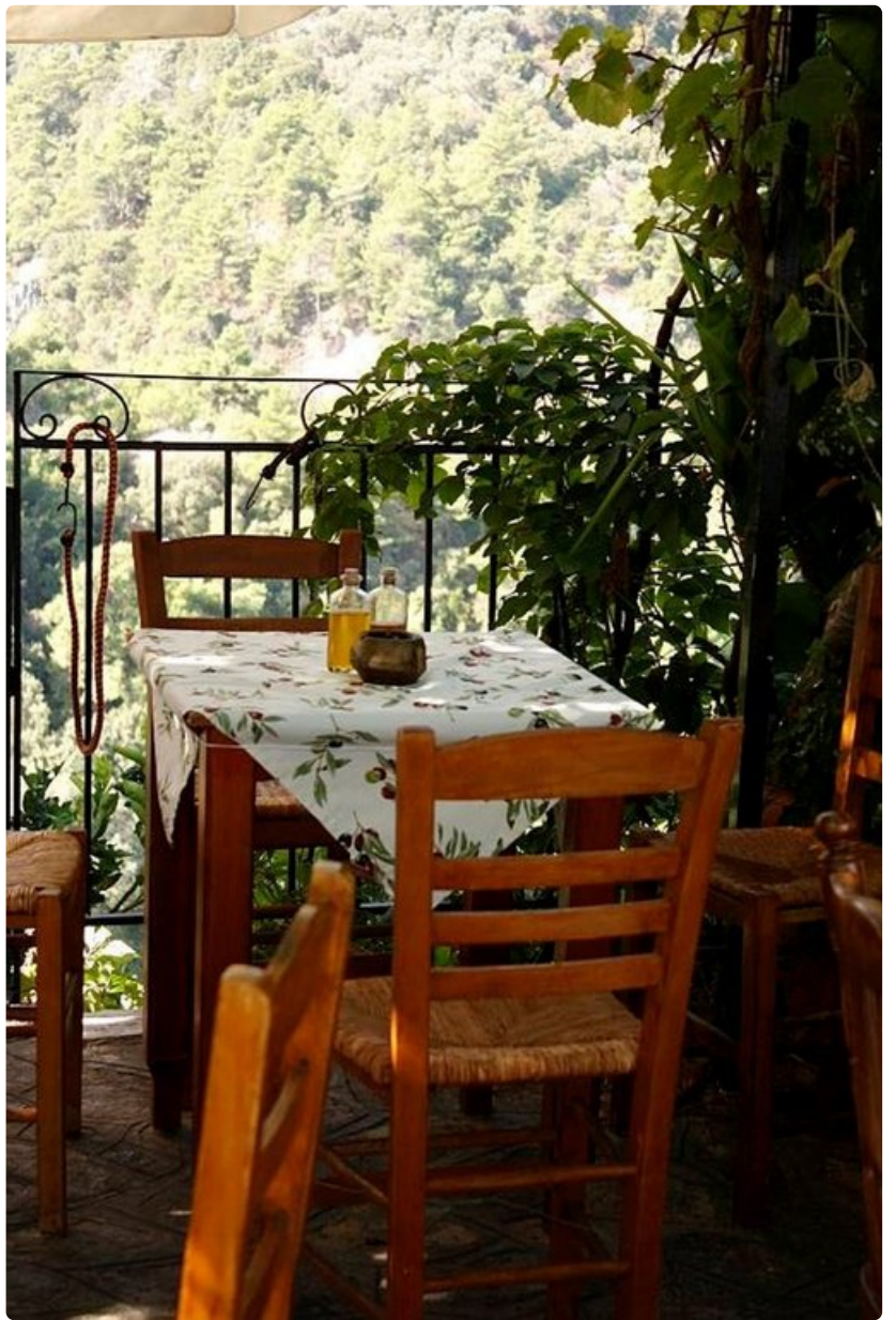
Yksinkertainen mutta houkutteleva tavernapöytä odottaa.