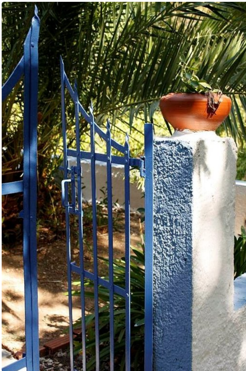
Kreikan sininen ja valkoinen ovat aina yhtä kauniita.