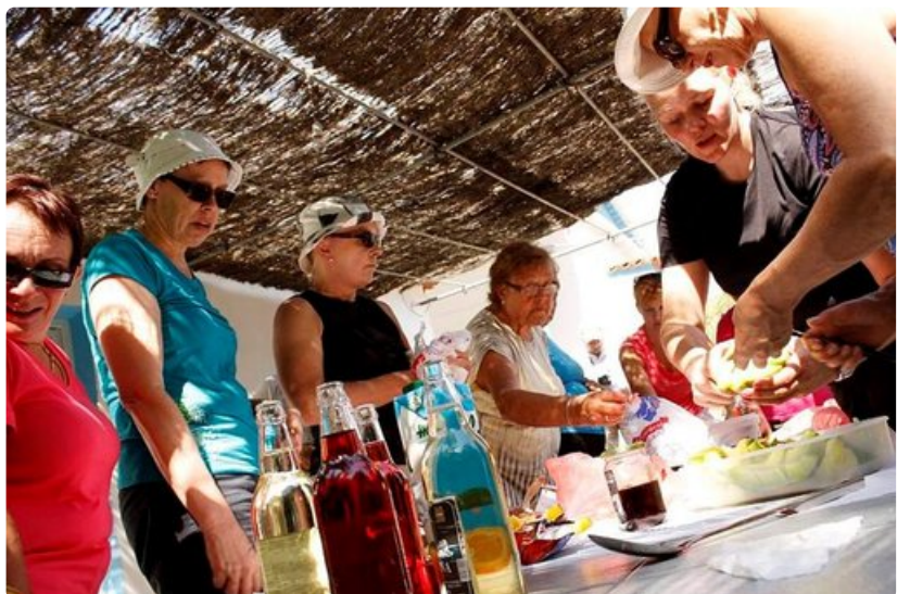
Vaelluksen välillä päästiin maistelemaan kreikkalaisia herkuja.