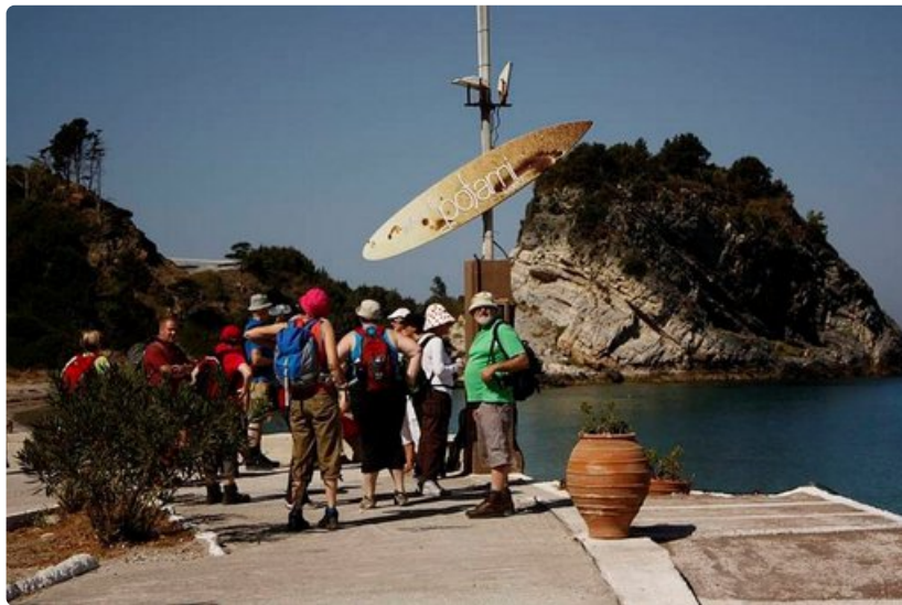
Samoksen vaelluksella mukana oli sekä retkeilijöitä että eri puolilla maailmaa vaeltaneita konkareita.

Viimeisenä vaelluspäivänä innokkaimmat suunnittelivat jo seuraavaa matkaa. Monet saivat rohkeutta siitä, että vaelluksella pärjää myös ulkomailla erilaisesta lämpötilasta huolimatta. Vaativuustaso tällä matkalla ei ollut kuitenkaan kolmosluokkaa eli vaativinta vaan kakkosluokkaa. Vaelluksen ohjelma oli laadittu niin, että saapuminen aikaisin takaisin hotelliin ja bussikuljetukset paikasta toiseen antoivat aikaa elpymiselle. Päivämatkat ovat seitsemästä kymmeneen kilometriin, mutta matkan pituudella ei ole merkitystä vaan sillä, millaisessa maastossa liikutaan. Loivaa vuorenrinteen hiekkatietä pitkin jaksaa vaeltaa pitempäänkin, mutta pientä kivikkoista polkua pitkin jyrkästi ylös taapertaminen käy voimille. Jyrkimmissä kohdissa piti edetä nelinkontin.