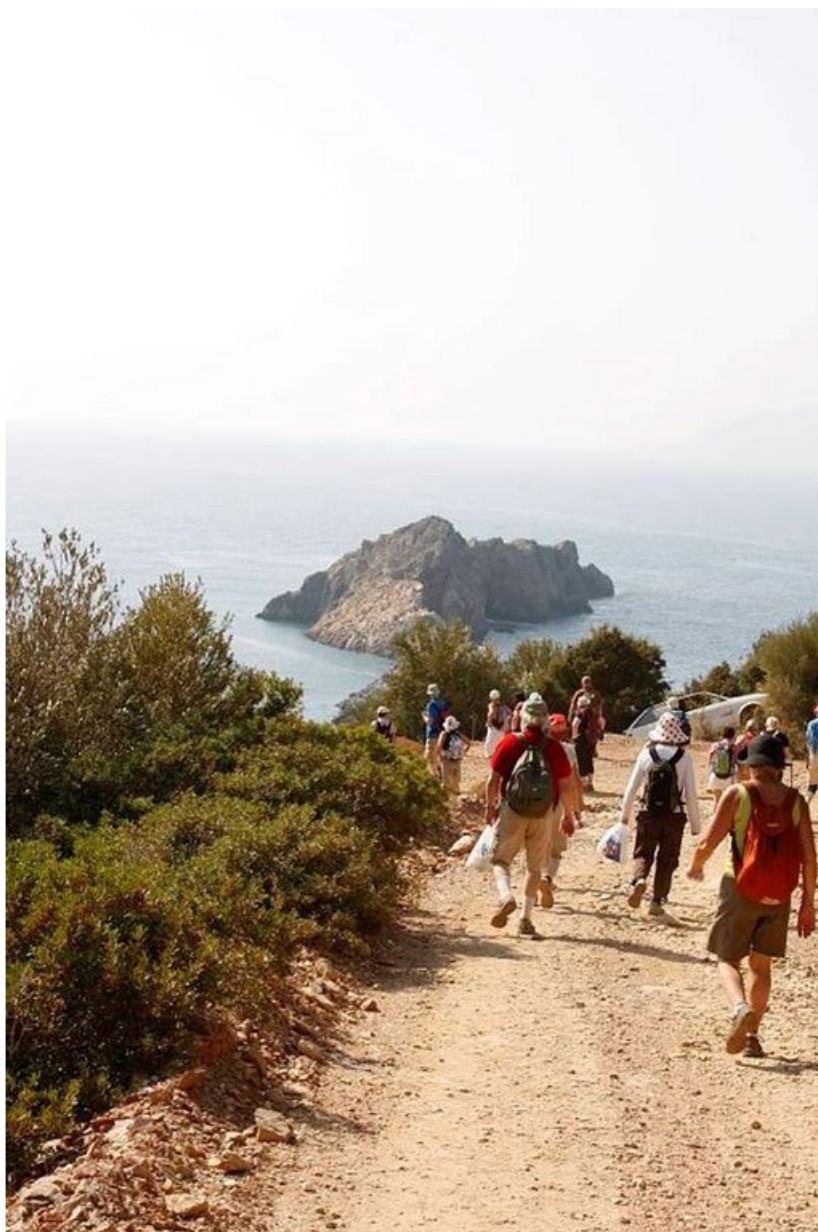
Vaelluksella avautuu upeita maisemia jatkuvasti.