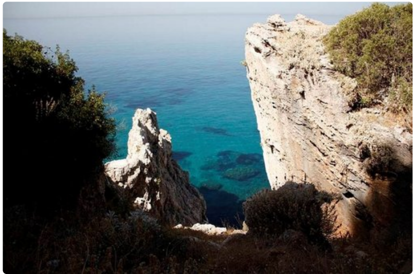
Turkoosin kirkas vesi peilaa kallioiden välistä niin, että merenpohjan muodot voi havaita jo kaukaa.