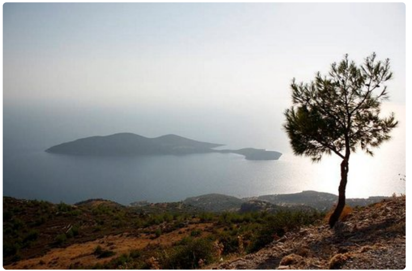
Aamuinen usva haihtuu nopeasti ja auringon lämpö kirkastaa maisemat.