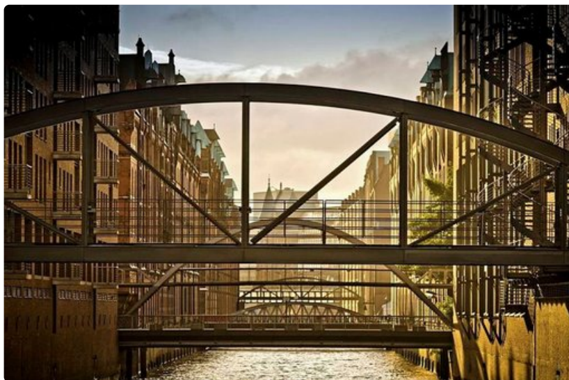
Valossa kylpevä satama-alue oli aikanaan kahvin, teen ja mausteiden välivarasto.

600 metrin mittainen ja 250 metrin levyinen Kontorhausviertel on edelleen toimistokäytössä, mutta viime vuosina sinne on perustettu matkailijoiden iloksi ravintoloita.