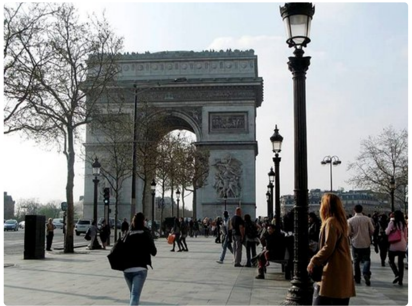
Ilman tarinoita Napoleonista ja Hitleristä Riemukaari ja Champs Elysée olisivat vain omituinen alikulkupaikka ja tavallinen leveä katu Pariisissa.