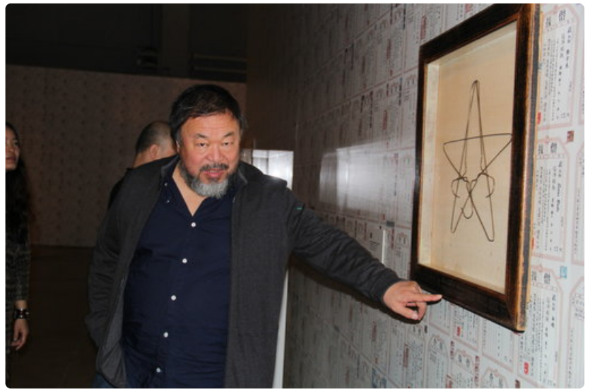
Taiteilija Ai Weiwei esittelee teostaan Kolme vaateripustinta tähden muodossa (metalliset vaateripustimet puukehyksessä, 1987-88).