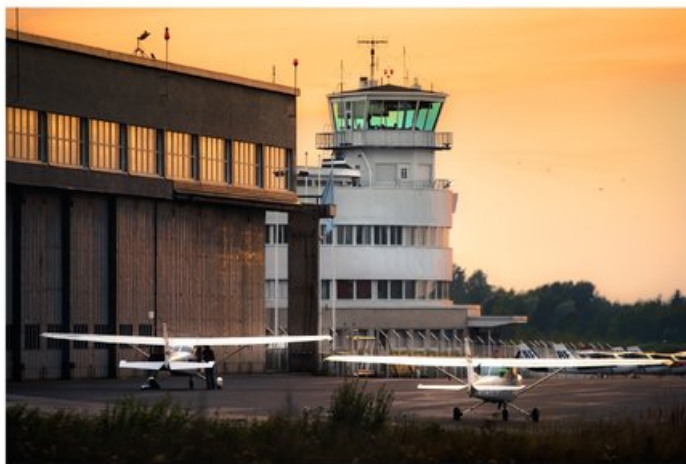
Hangaari oli valmistuessaan yksi Euroopan suurimmista rakennuksista.

Hyvönen on huolissaan myös virkamiesten jaksamisesta: "Kansalaiset ovat kovin vihaisia, ja vaikka yhdistyksenä pyrimme pitämään tilanteen rauhallisena, tulee virkamiehille varmasti paljon painetta. Toivottavasti ilmailukäytön jatko saadaan varmistettua pikaisesti, että tilanne rauhoittuu