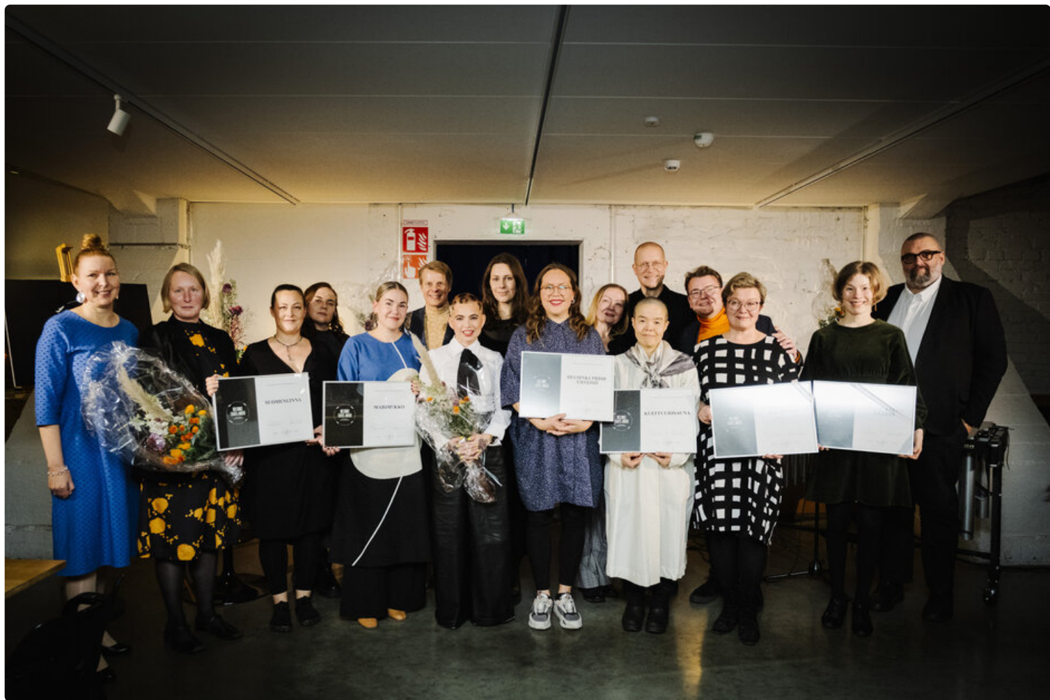
Helsinki Travel Award -palkitut ryhmäkuvassa.