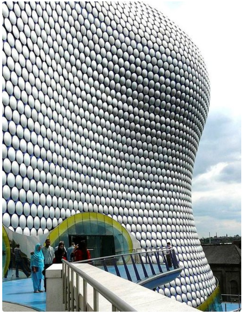
Keskustan moderni arkkitehtuuri jakaa mielipiteitä.