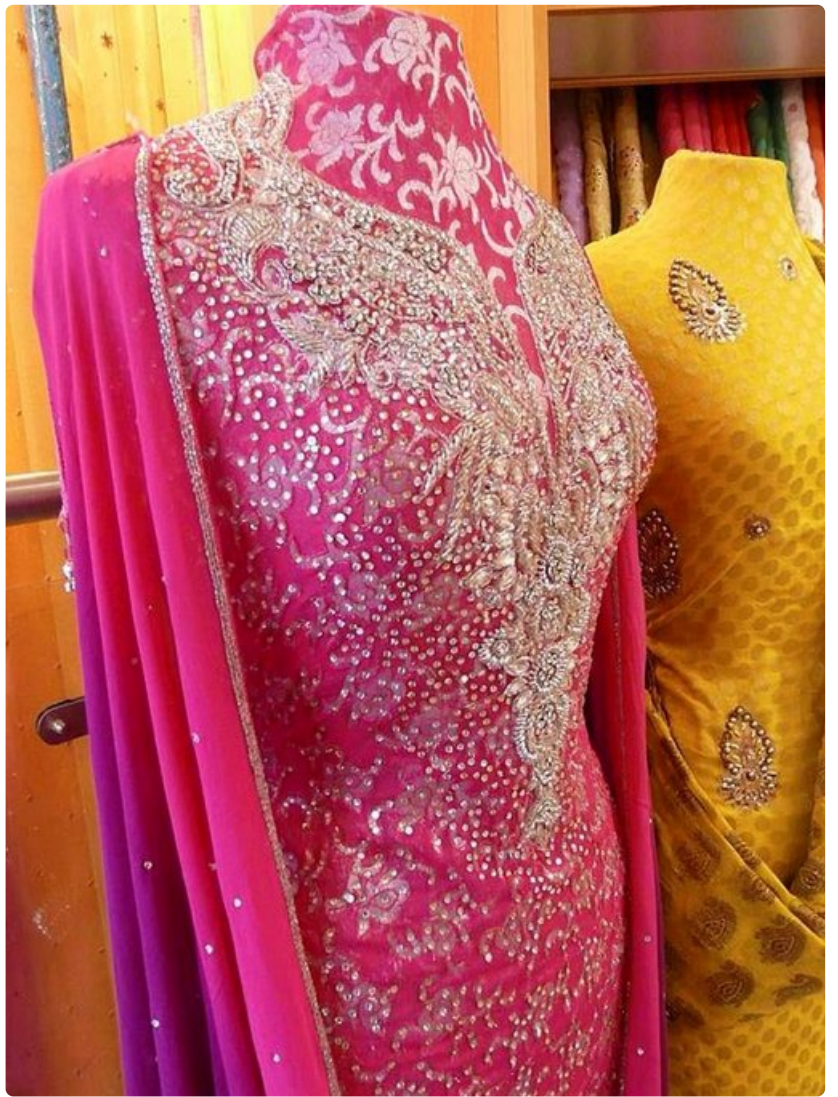
Ladypool Roadin varrelta löytyy upeita sarikangaskauppoja.