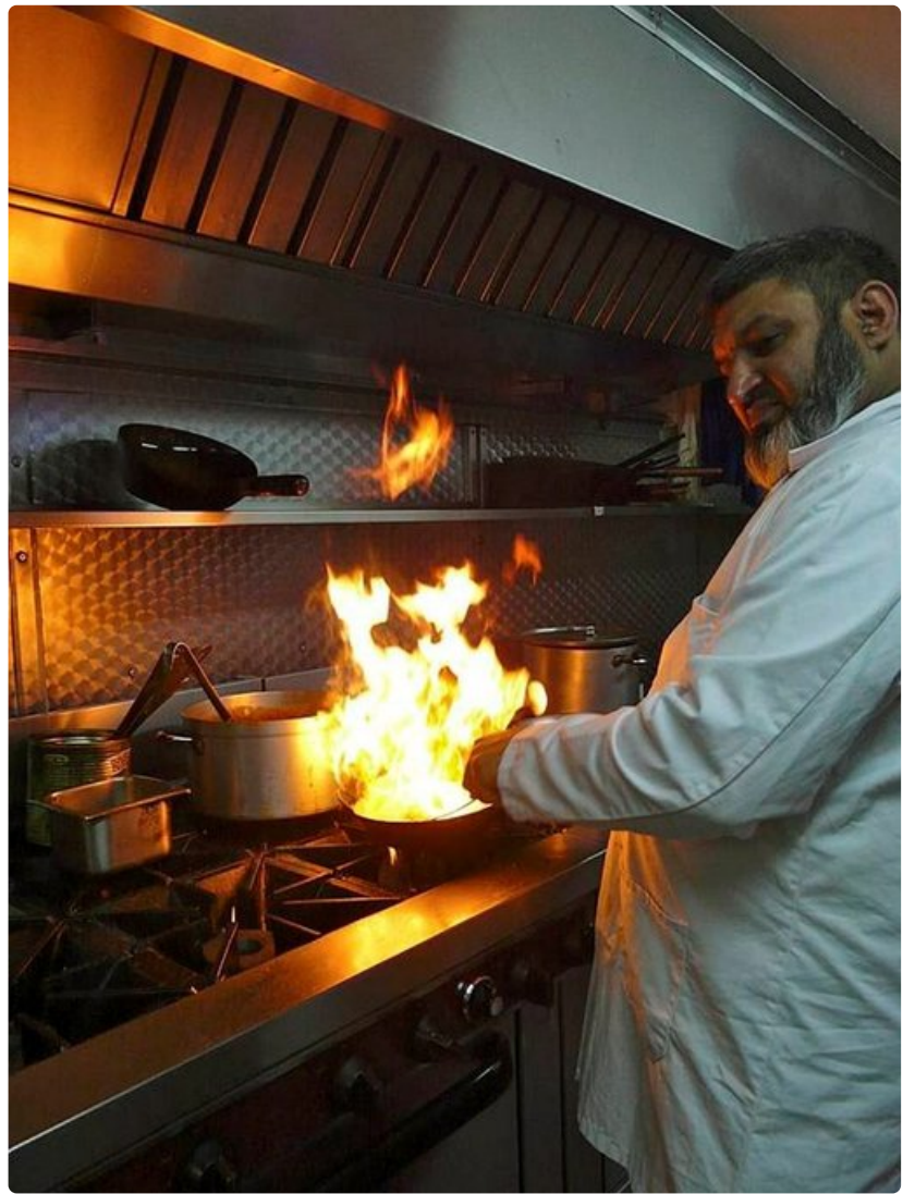
Perinteinen balti valmistetaan suoraan tarjoiluastiaan.