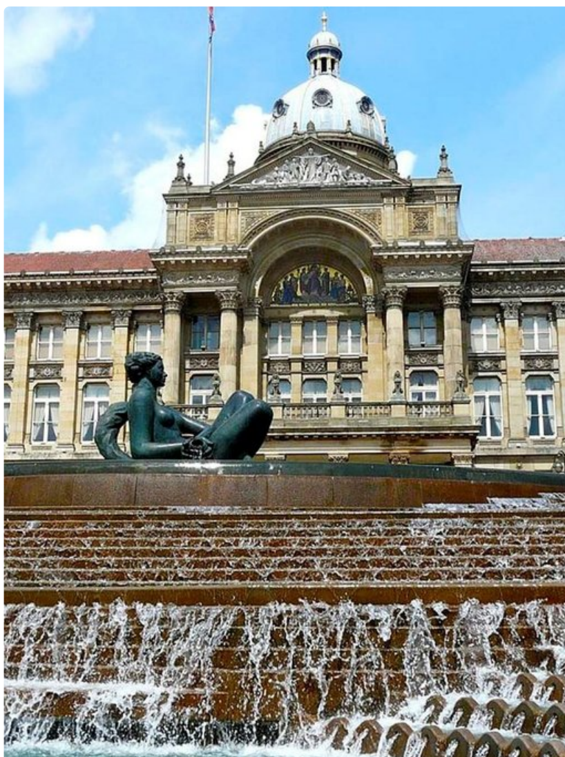
Birminghamin vaikuttava valtuustotalo sijaitsee kaupungin keskustassa.

Baltin peruskastike syntyy valkosipulista ja inkivääristä, johon lisätään kanaa, lammasta tai kalaa. Ruoka maustetaan esimerkiksi korianterilla. Balti tarjoillaan tulikumasta valmistusastiasta, joka säilyttää maun pöytään asti.