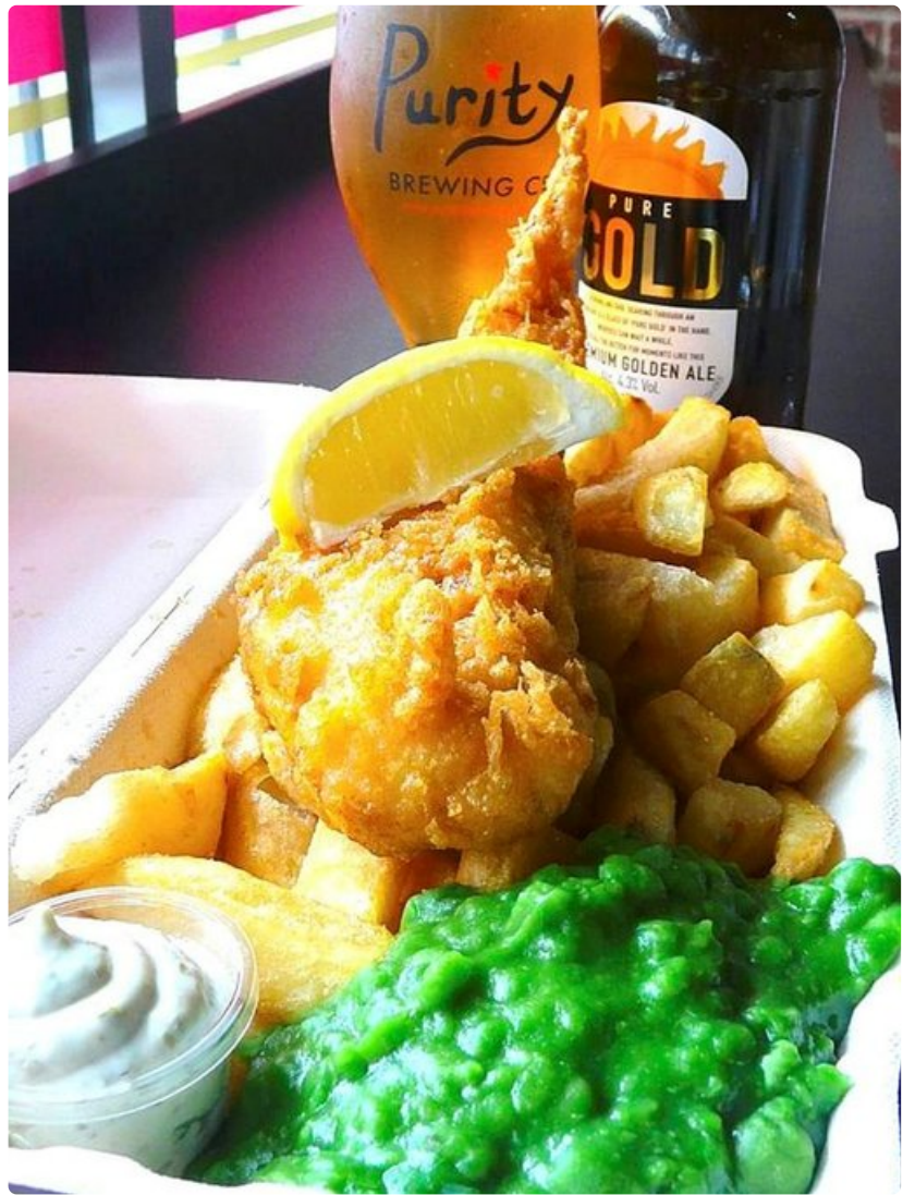
Fish and chips tarjoillaan hernemuusin kera.