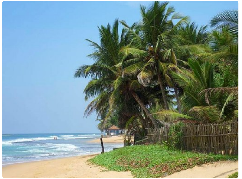
Rannat ovat siistejä ja hiljaisia.

Sukellukseen ensimmäinen antava Discover tarkoittaa pientä, mutta kattavaa teoriaosuutta, välineiden testaamista ja kahta sukellusta. Koko sukelluskurssin voi Hikkaduwassa suorittaa neljässä päivässä ja se vie taskusta noin 260 euroa. Kannattaa ehdottomasti valita Padi-tunnuksen omaava sukelluskoulu, jotta saa parhaan palvelun ja välttää ammattitaidottoman opastuksen. Poseidon Diving Station on luotettava ja asiantunteva keskus.