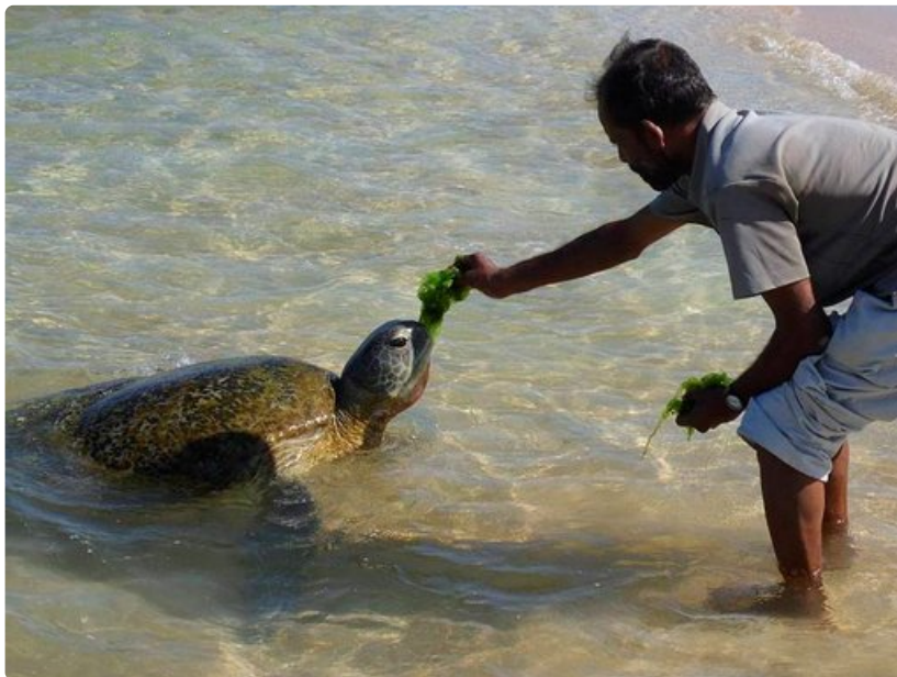
Hellyttävät kilpikonnat nousevat merestä päivittäin paikallisten ruokittaviksi.

Mahdollisuuksia majoittua on ranta täynnä ja vaihtoehdot ovat viihtyisiä. Kahden hengen huoneen hinta on kuudesta eurosta yöspäin. Siistejä ja kodikkaita paikkoja ovat muun muassa Dewasiri Guesthouse, Sunny's Beach ja Hotel Appolo. Hyvänkokoisien uima-altaan omaava Nippon Villa vuokraa huoneita alkaen 12 euroa. Kuumaa vettä, jääkaapin, ruoanlaittomahdollisuuden ja pienen parvekkeen saa VIP Hotellista 25 eurolla. Rannalta löytyvän Why Notin cabana on miellyttävä lomakoti, noin 19 euroa yö.