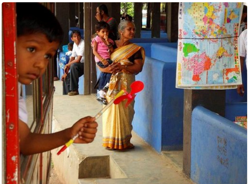
Paikallinen kulttuuri tulee tutuksi raiteilla matkustaessa.