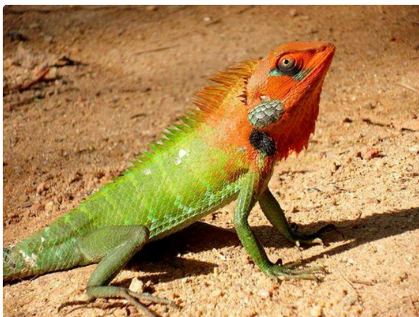
Sri Lankan luonnossa näkee monenväristä elämää.