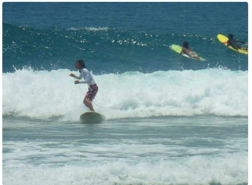
Surffauskilpailuja järjestetään vuosittain.