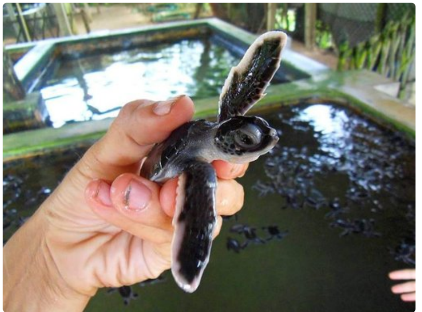
Kosgodan kolmen päivän ikäiset kipittäjät tekevät luonnonsuojeluprojektia tunnetuksi.