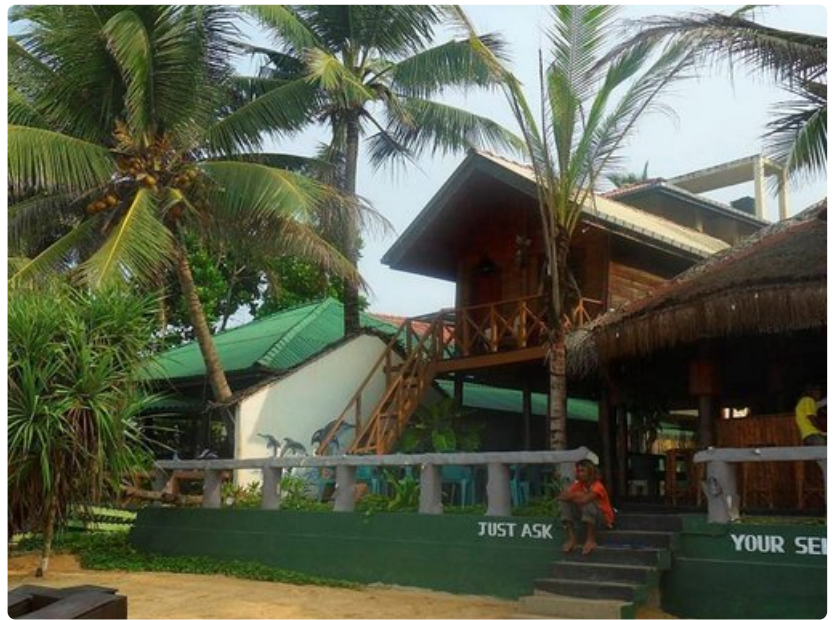
Why Not? sopii kaveriporukalle, joka tahtoo nauttia sekä päivän että yön parhaista puolista.