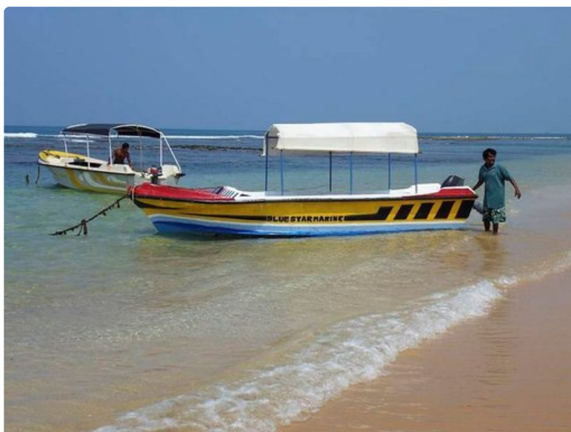
Hikkaduwan rannasta voi tehdä retkiä lähirannoille.