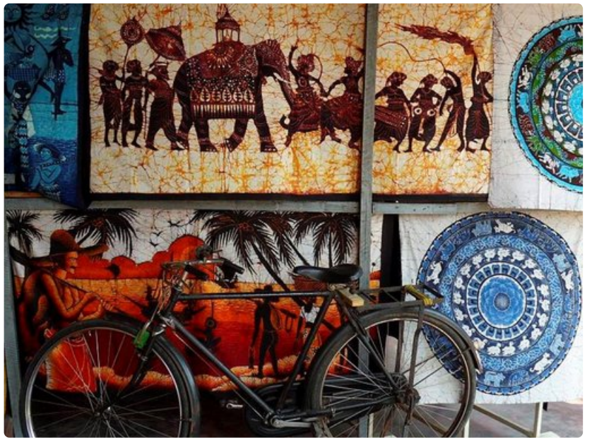
Batiikkikankaita myydään useissa pikkuliikkeissä.