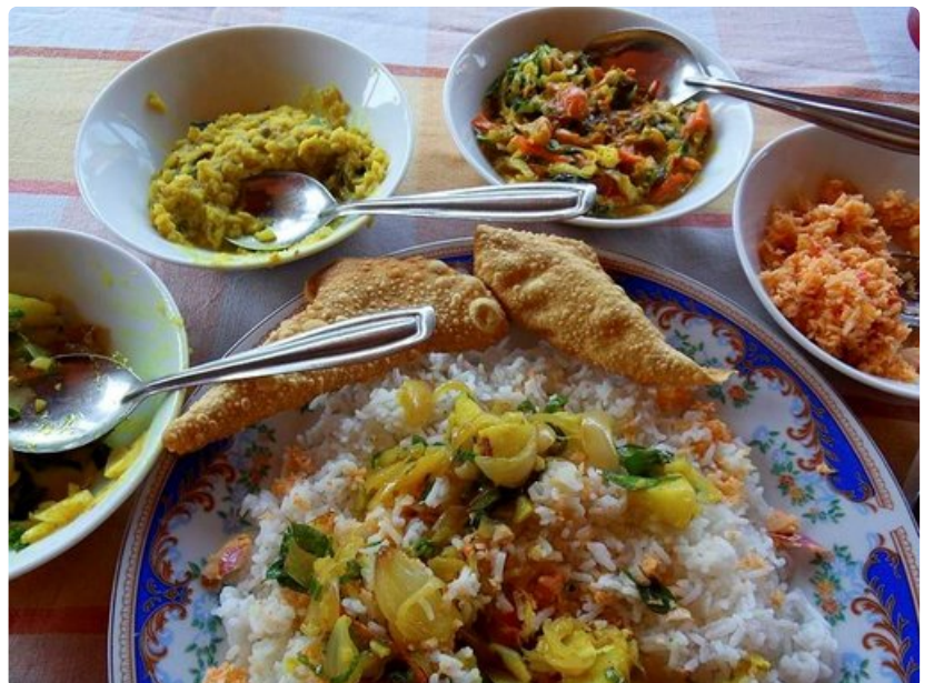
Sri Lankan riisi ja curry Cool Spot -ravintolassa saattaa koukuttaa vierailemaan uudelleen.