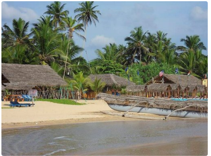
Pienet viehättävät rantaravintolat pääsevät oikeuksiinsa auringonlaskun aikaan.