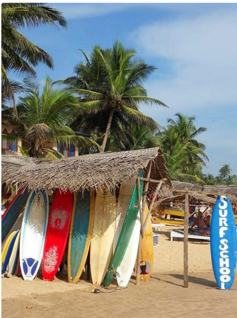
Surffilaudan saa päiväksi noin kahdeksalla eurolla, mutta hinta putoaa, jos muistaa tinkiä.