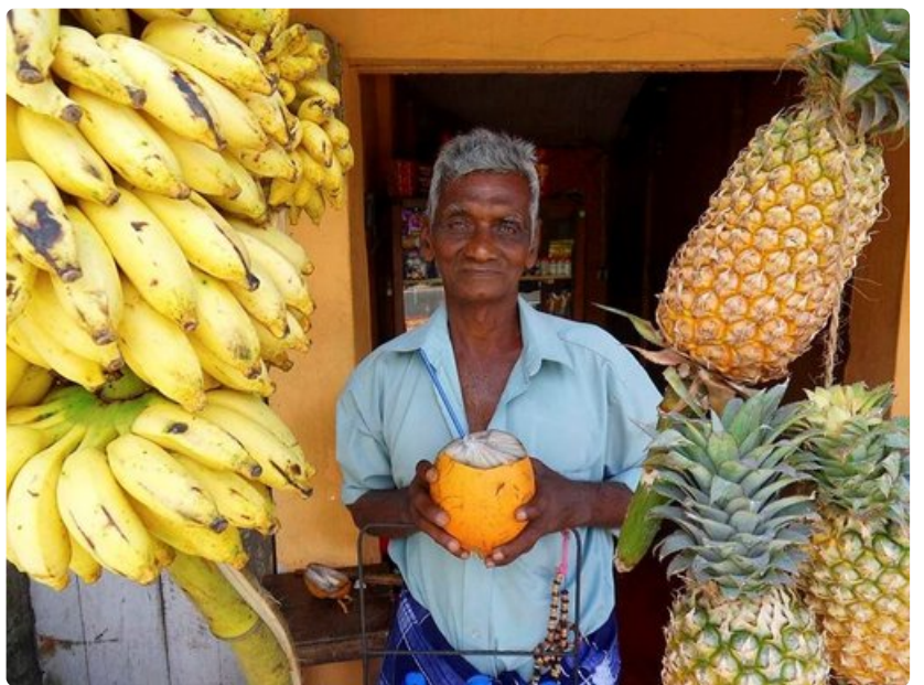
Paras juoma kuumuudessa on kookosmaito.