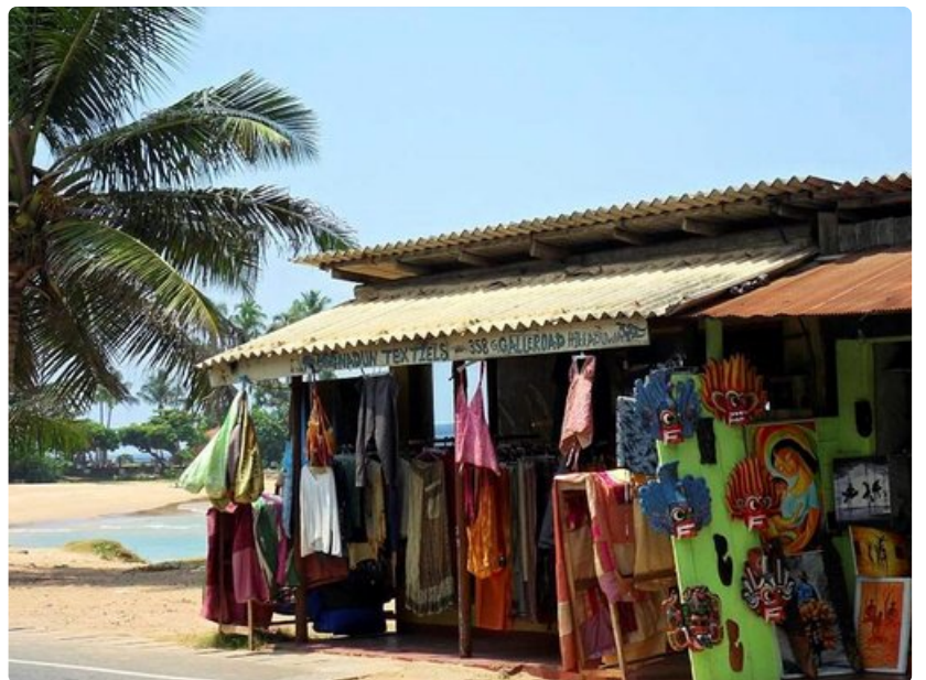
Puueistoksia ja batiikkitoita on myytävänä lähes joka kaupassa Galle Roadin varrella.