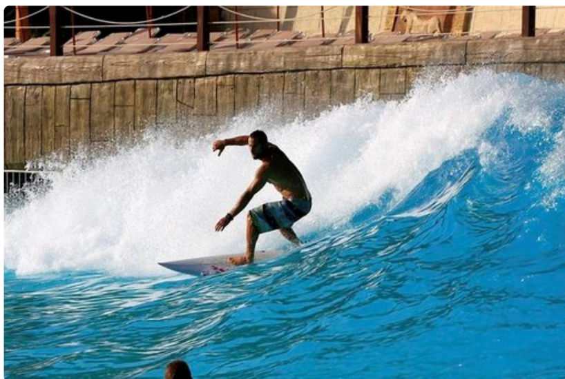
SiamParkista löytyy jopa aaltokone.