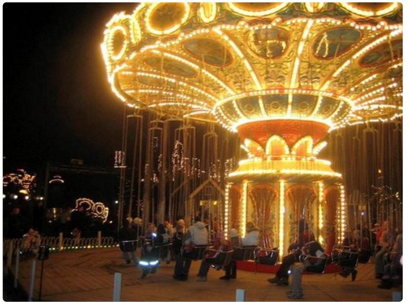
Kööpenhaminan Tivoli tarjoaa entisajan tunnelmaa.