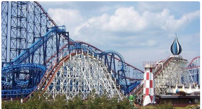
Ei ole vaikea arvata, mistä Blackpool Pleasure Beach on tunnettu.