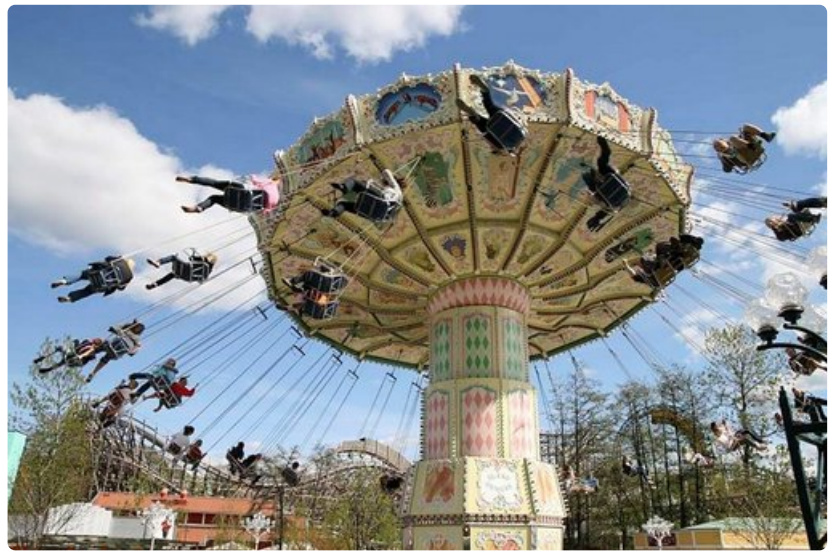
Liseberg on keskittynyt perinteisiin koko perheen laitteisiin.