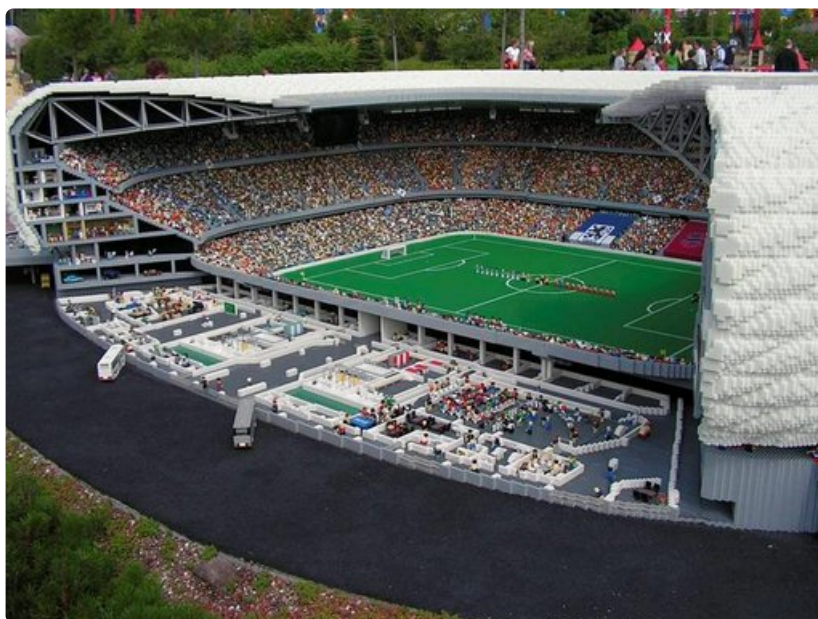
Legolandin rakennelmat hämmästyttävät niin lapsia kuin vartuneempiakin.