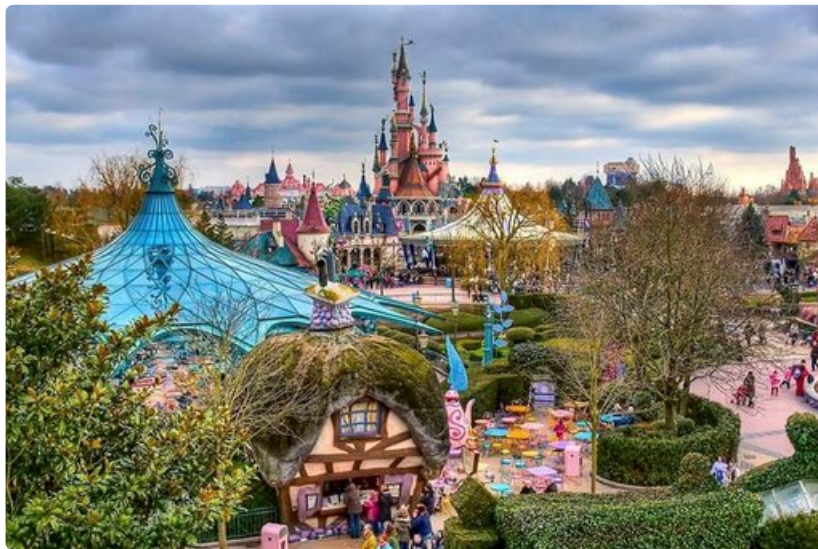
Pariisin Disneyland on Euroopan suosituin huvipuisto.