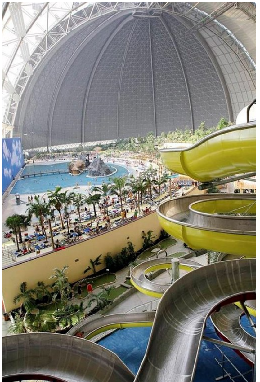
Tropical Islands Resort tarjoaa aidon aasianlaisen tropiikin keskellä Saksan peltoa.