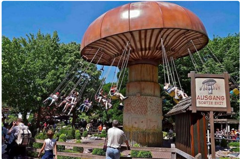
Saksan Europa Park on jättimäinen niin kooltaan kuin kokemuksiltaan.