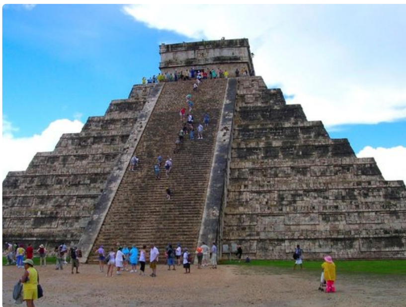
Chichen Itza on Meksikon kuuluisin Maya-temppeli.