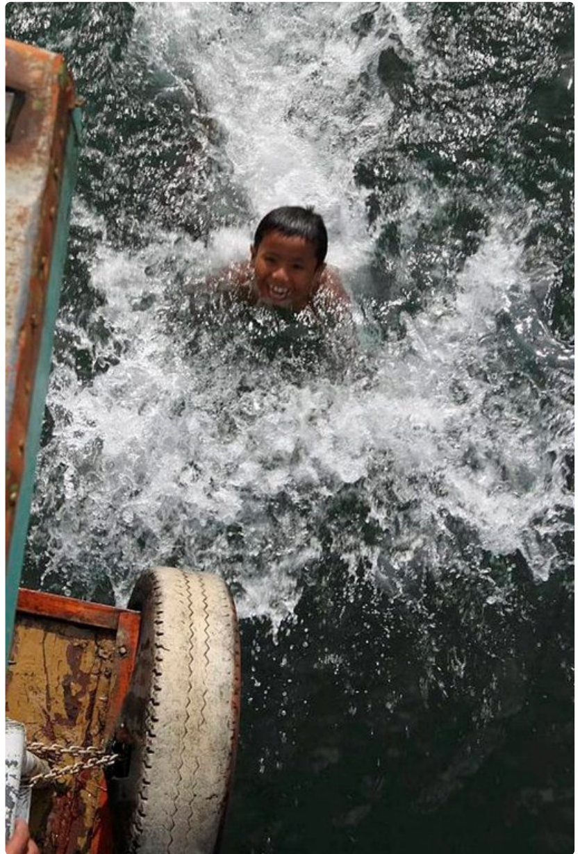
Lasten päätä ei paljon huimaa hurjissa leikeissä.

Medanin kentältä Lake Toba on noin kolmen tunnin ajomatkan päässä. Kentällä on busseja ja takseja, joilla pääsee perille 7-50 euron hintaan.