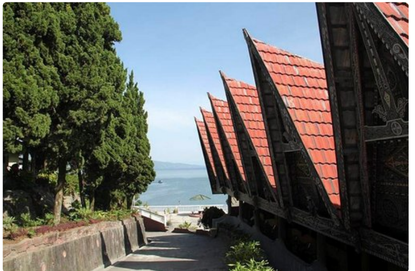
Batak-heimon kulttuuri näkyy muun muassa kattojen omaperäisissä muodoissa.