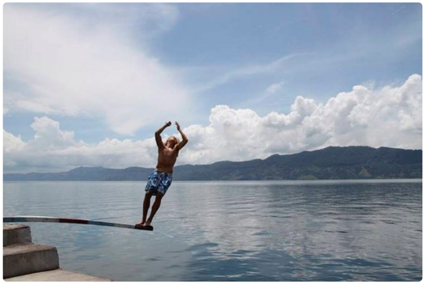
Kauttaaltaan siniseen maisemaan voi huoletta sukeltaa.