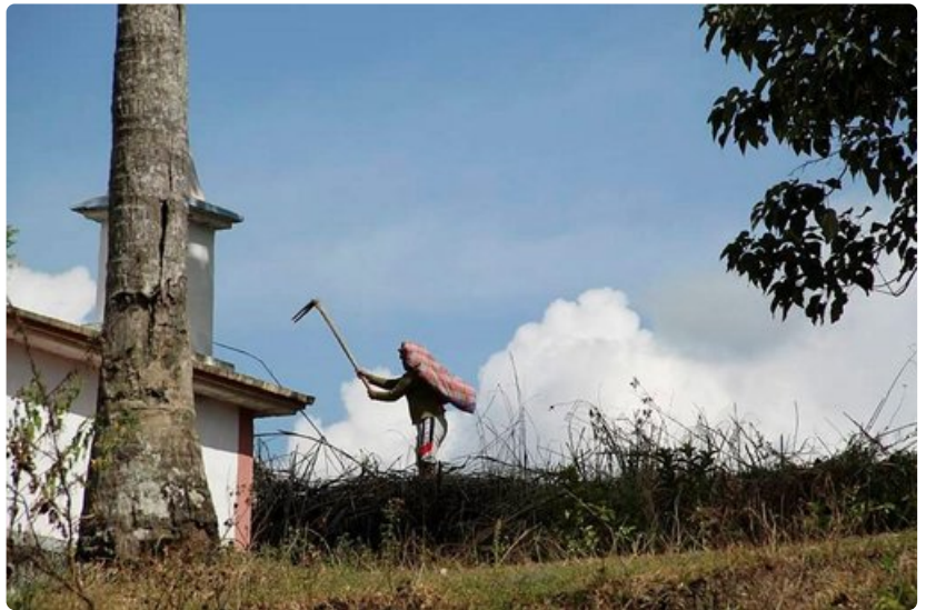
Maata viljellään edelleen perinteisin menetelmin.