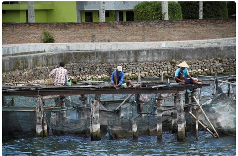
Kalastus ja kalankasvatus ovat tärkeitä elinkeinoja Lake Toballa.