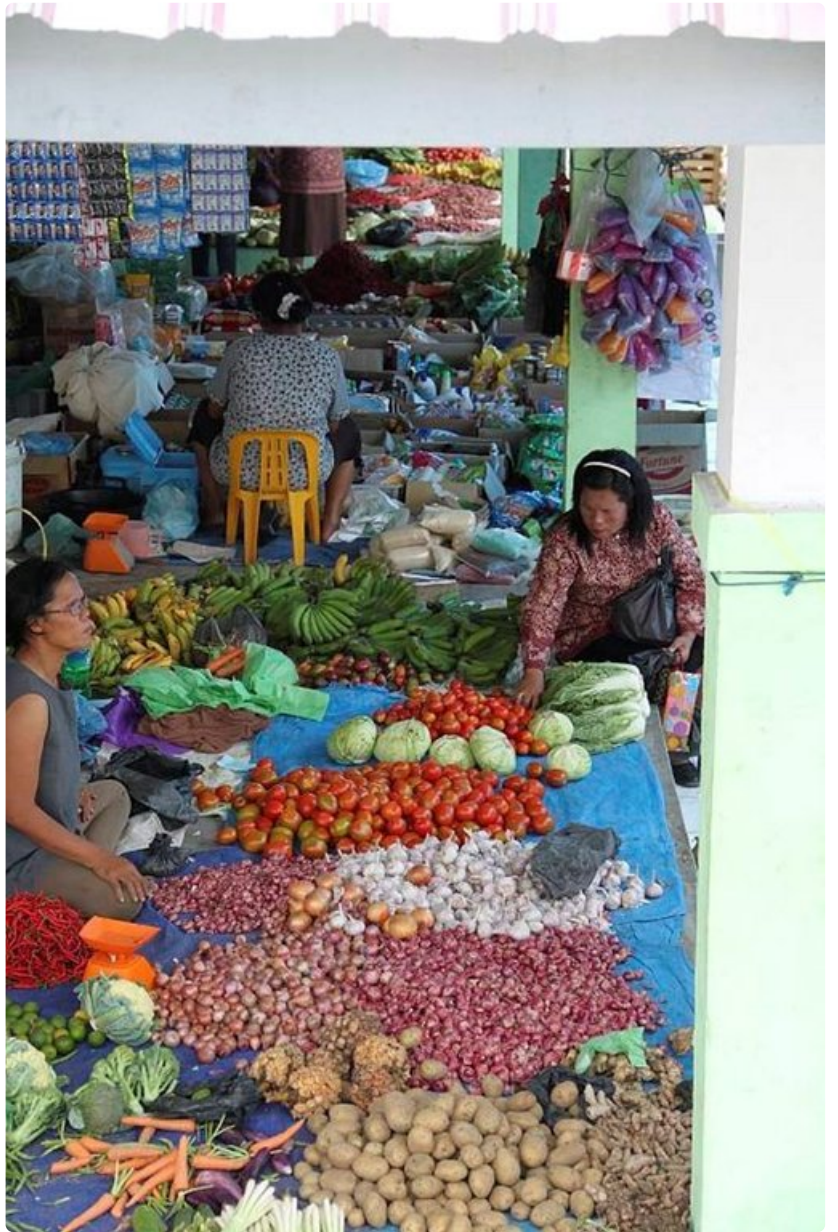
Tuoreiden hedelmien ja vihannesten väriiloista markkinoilla.