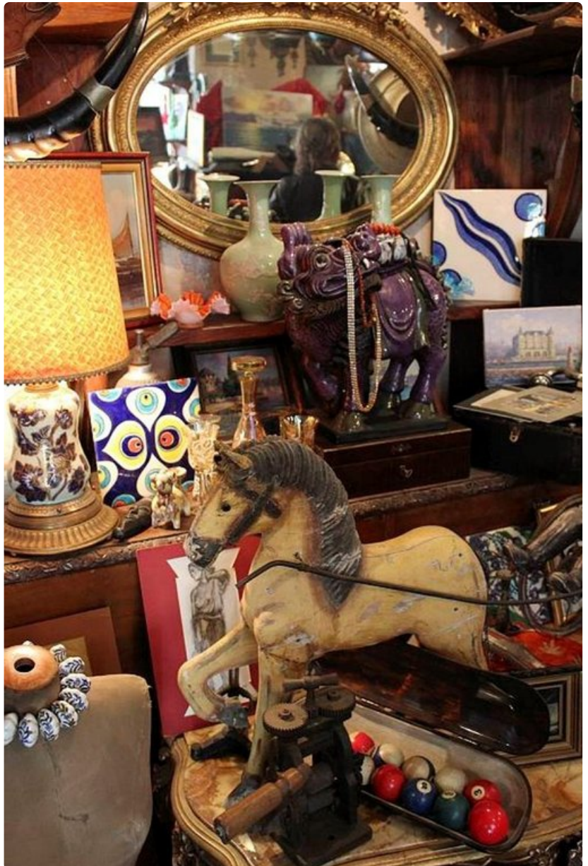
Aarteita vanhan tavarain liikkeessä.