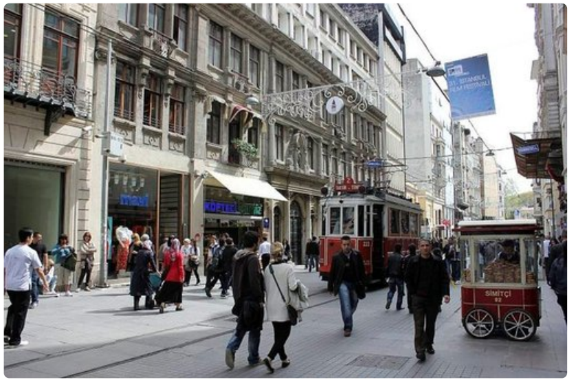
Ostoskadulla liikennöivät vanhat punaiset raitiovaunut.