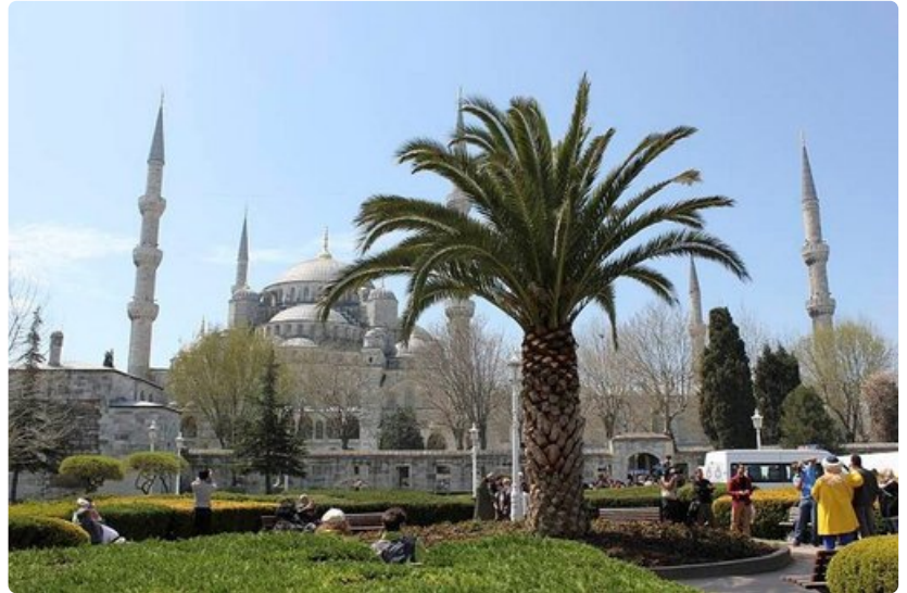
Sinisen moskeijan ja Hagia Sofian välisellä puistoalueella voi istua ihaillemaan mahtipontisia pyhäkköjä.

Aikoinaan osmanisulttaanien asuma Topkapin palatsialue on nykyään kaikille avoin. Palatsi on toiminut suluttaanien, heidän perheidensä ja lähipiirinsä asuntona, joskin palatsialueen väkiluku on ollut tuhansissa. Tarpeellisia tiloja ovat olleet esimerkiksi haaremi, ympärileikkaushuone, kirjasto ja tallit. Palatsin piha-alueilta voi ihailaa näkymää salmelle, ja nurmelle voi istahtaa syömään eväitä. Sisä- ja ulkotilojen seinillä on tuhansittain upeita Iznikin keramiikkalaattoja.