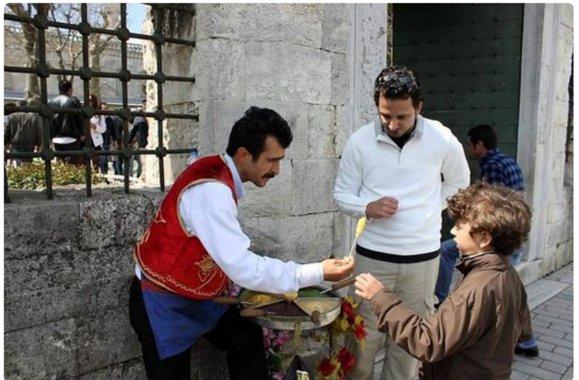
Katukauppias myy venyvästä massasta tikkuun pyöritettäviä makeisia.