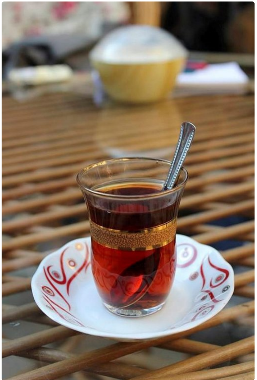
Turkkilainen teelasi jäljittelee tulppaanin muotoa.

Kaupungin yö houkuttelee kurkistamaan, miten kaduilla juhliitaan. Kapeiden katujen ylle kaartuvat koristeelliset kyltit kertovat kadun nimen. Cicek Pasaj eli Kukkakuja oli ennen kukkakauppiaiden aluetta. Iltapuhuri oikaisee kylttiin ripustetun punaisen lipun paljastaen puolikuun ja Atatürkin arvokkaan olemuksen. Kukkakuja ja läheinen Nevizade-katu ovat vilkkaita iltaisin. Vieriviereen sovitutuneet kuppilat ja ravintolat pullistelevat paikallisia ja kansainvälisiä illanistujia. Jostain kantautuu kitaransoittoa, ja länsimaalaisen näköinen nuori pariskunta pelaa korttia huteralla pikkupöydällä. Enemmistö istuskelijoista on nuoria miehiä, joiden univormuna on piukka, musta nahkatakki. Huivipäiset naiset viettävät iltaansa muualla, baarien ikkunoissa heilahtelevat vallattomasti tanssivien tyttöjen hahmot.