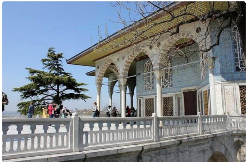
Topkapin palatsialueella on lukuisia koristellisia rakennuksia.