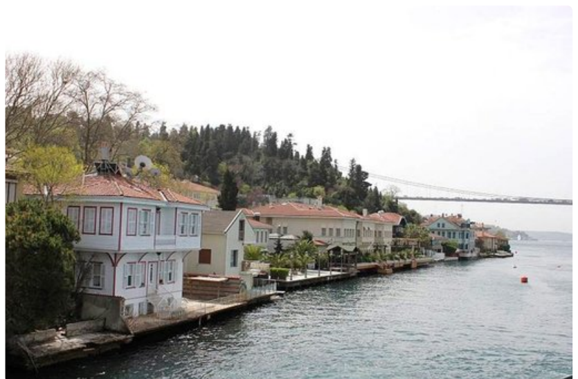
Bosporin rantoja täplittävät puuhuvilat.