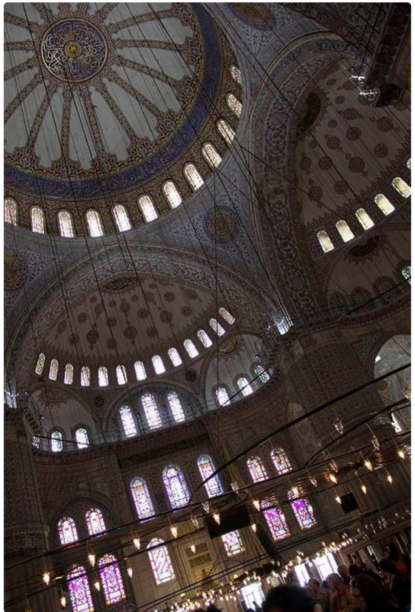
Sinisen moskeijan koristeellinen katto saa pään pyörälle.

Kylvyn jälkeen voi nauttia lasin punertavaa turkkilaista teetä. Hamamin puodista saa saippuoita ja perinteisiä puupohjaisia kylpylāsandaaleja