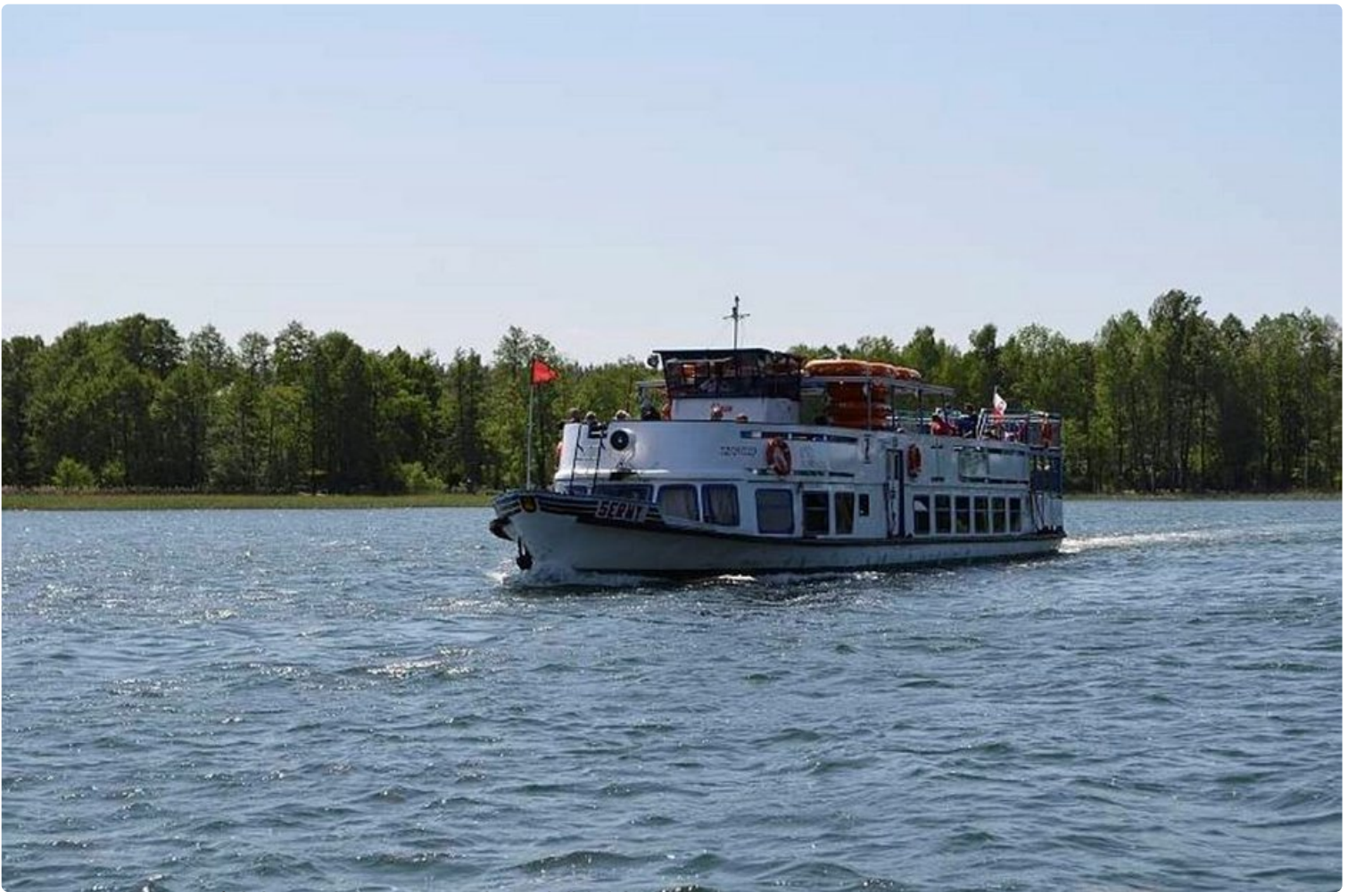
550 vuotta vanhan Augustówin kaupungin kanava on suosittu matkailukohde.