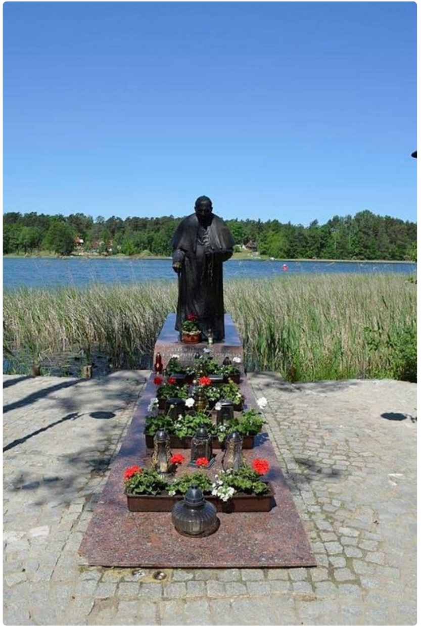
Puolalaisyntyinen paavi Johannes Paavali II vieraili Puolassa ja Augustówin alueella 1999.