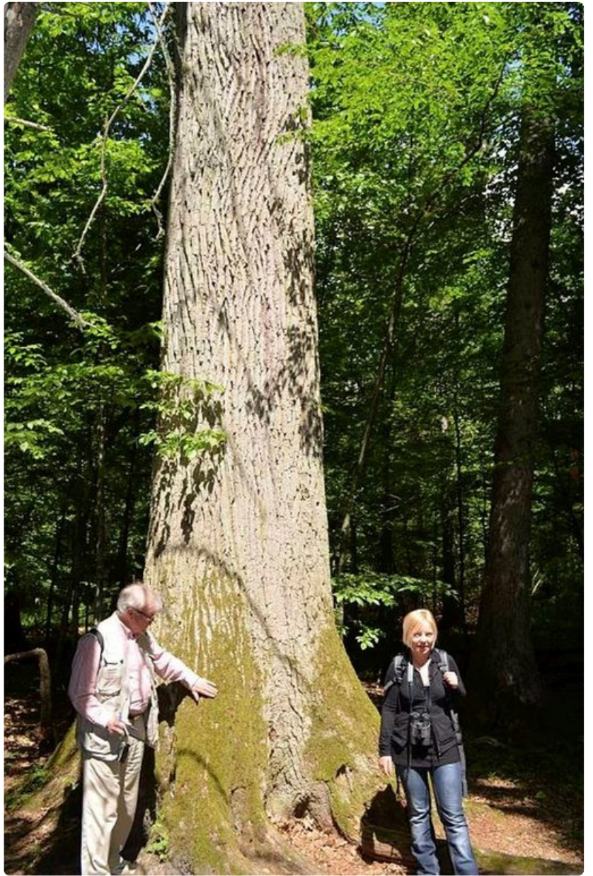
Białowiezan kansallispuiston puut voivat olla 500 vuotta vanhoja.