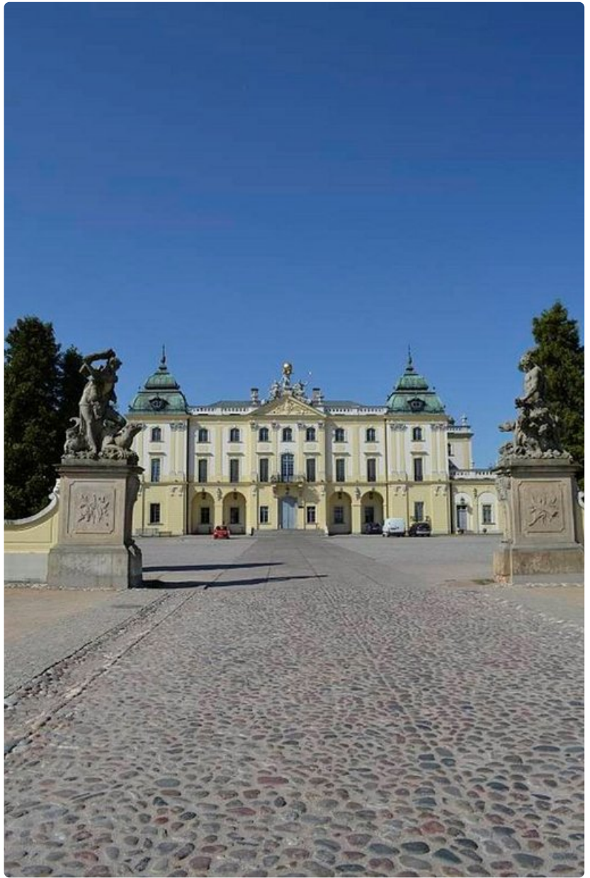
Itä-Puolan pääkaupungin Białystokin komein rakennus on Branicki-suvun palatsi, nykyinen yliopisto.

www.cultureunplugged.com/play/2937/The-Nature-of-Rebirth