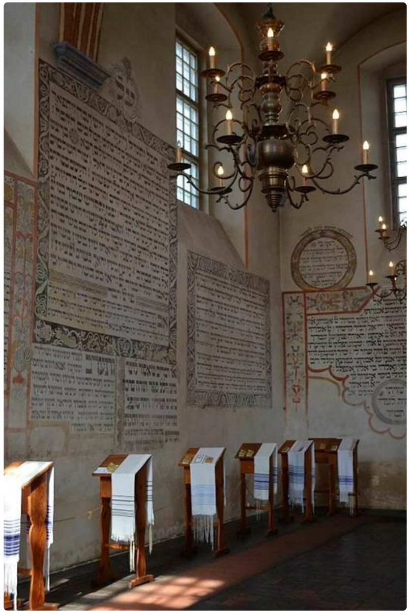
Tykocinissa oli ennen sotaa suuri juutalaisyhteisö. Nyt paikkakunnalla on museo entisessä synagogassa.