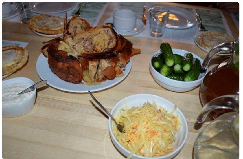
Ravintola Tatarska Jurta tarjoaa mainiota tataariuukaa Kruszyanyssä moskeijan naapurissa.