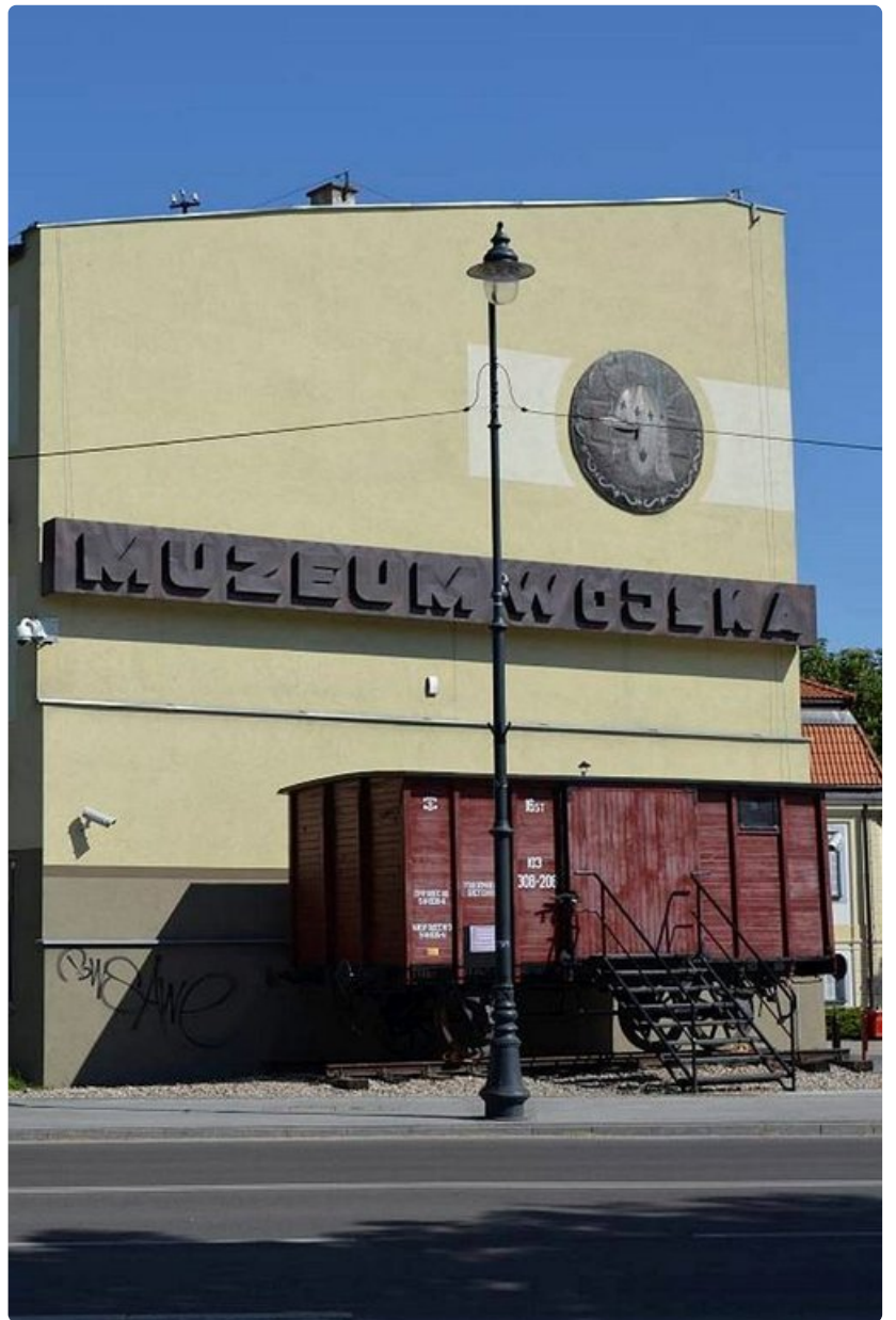
Białystokin sotamuseon edessä on karjavaunu, jolla Stalin rahtasi puolalaisia Siperiaan.