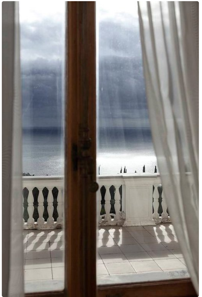
Näkymä merelle Livadian palatsista.