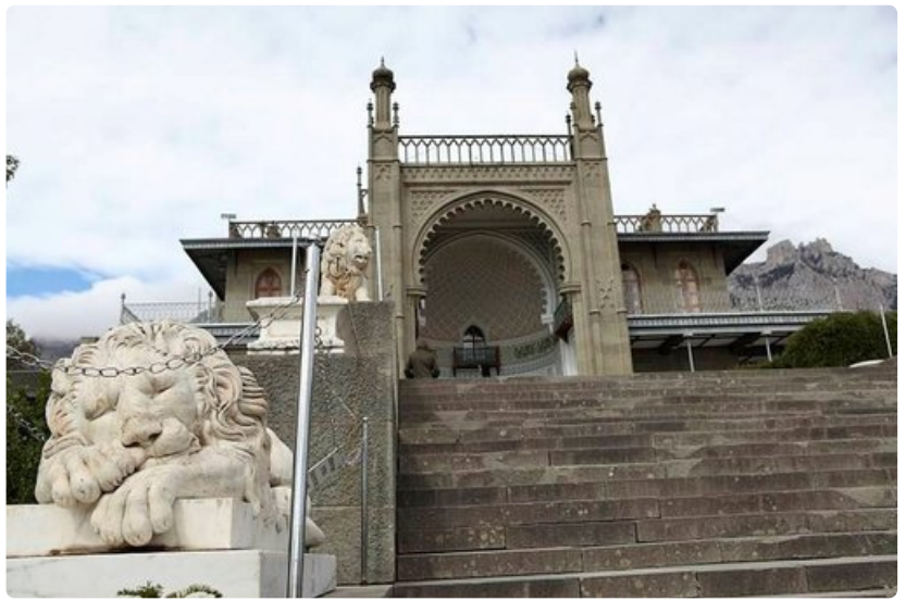
Livadian palatsi sijaitsee hienolla paikalla ja sieltä on hyvät näköalat merelle ja Jaltan keskustaan.

o Historiallisesti merkittävä ja mielenkiintoinen paikka, jossa riittää nähtävää.