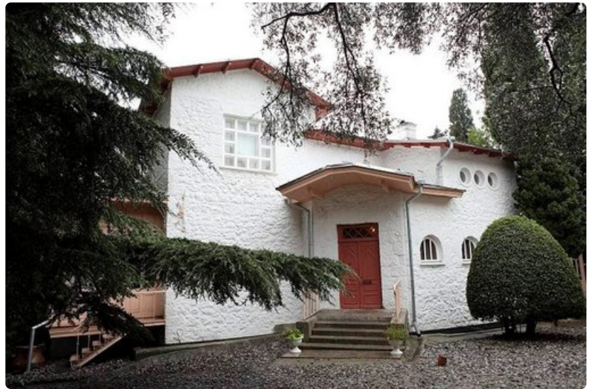
Tšehovin talo ei ole mikään pieni mökki.