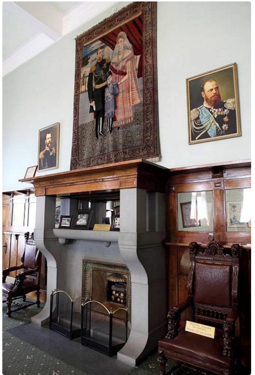
Persian shaahin Nikolai II:lle lahjoittama ryijy, joka katosi Venäjän vallankumouksen yhteydessä.