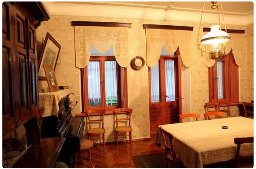
Tässä talossa Tšehov kirjoitti viimeiset suuret näytelmänsä.