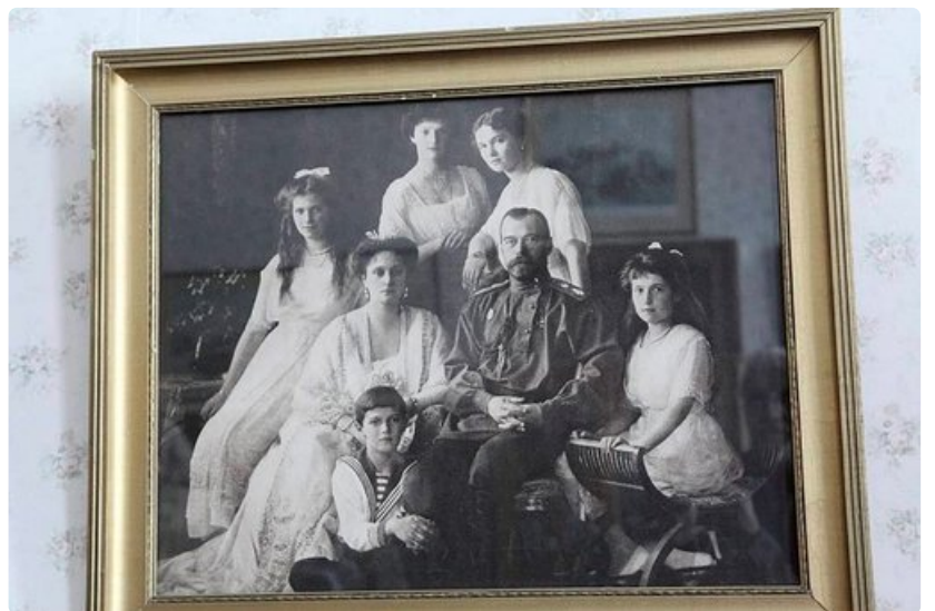
Viimeinen valokuva Nikolai II:sta ja hänen perheestään ennen kuin heidät teloitettiin.