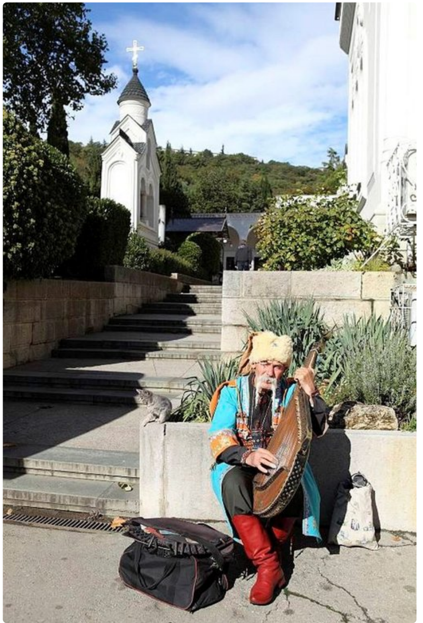
Kansantaiteilija Livadian palatsin edustalla.