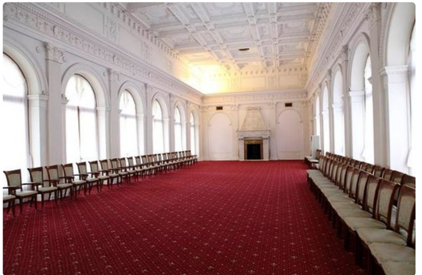
Livadian palatsin valkoinen sali, jossa Jaltan konferenssin neuvottelut käytiin.