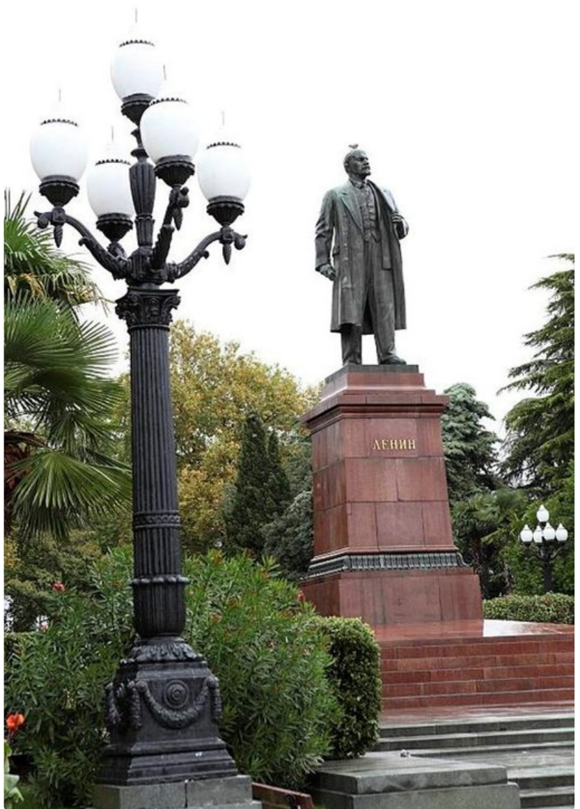
Leninin patsas seisoo vanhalla paikallaan rantakadulla.