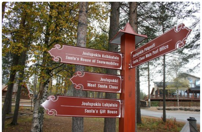
Joulupukin Pajakylän opastekyltit on uusittu ja tulevana talvena alueelle valmistuvat myös kosketusnäytölliset karttataulut sekä uusi, informatiivisempi bussipysäkki aikataulunäyttöineen.