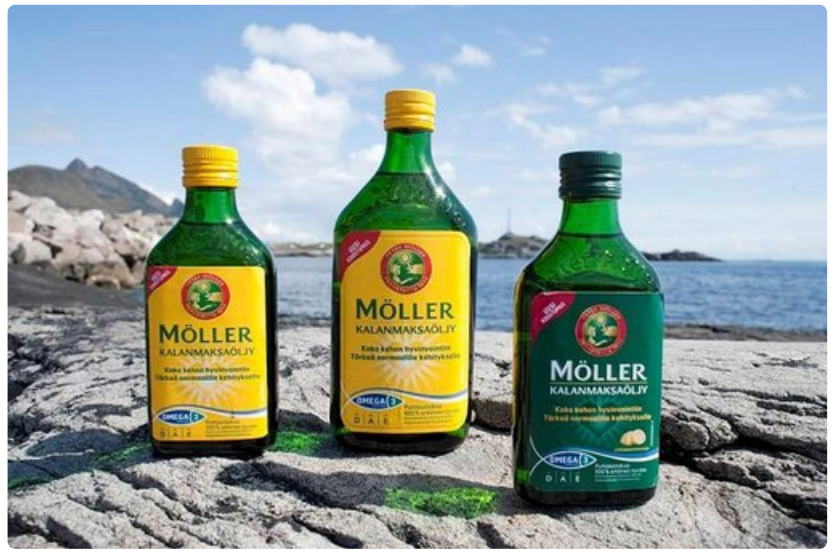
Jo klassikoksi muodostuneen Möllerin kalanmaksaöljyn koti on Lofoteilla.