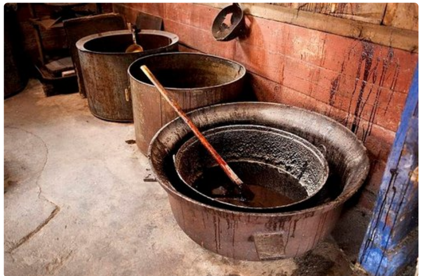
Kalanmaksäöljy oli mustaa mönjää 150 vuotta sitten. Paikalliset uskoivat, että mitä pahempaa, sen tehokkaampaa.