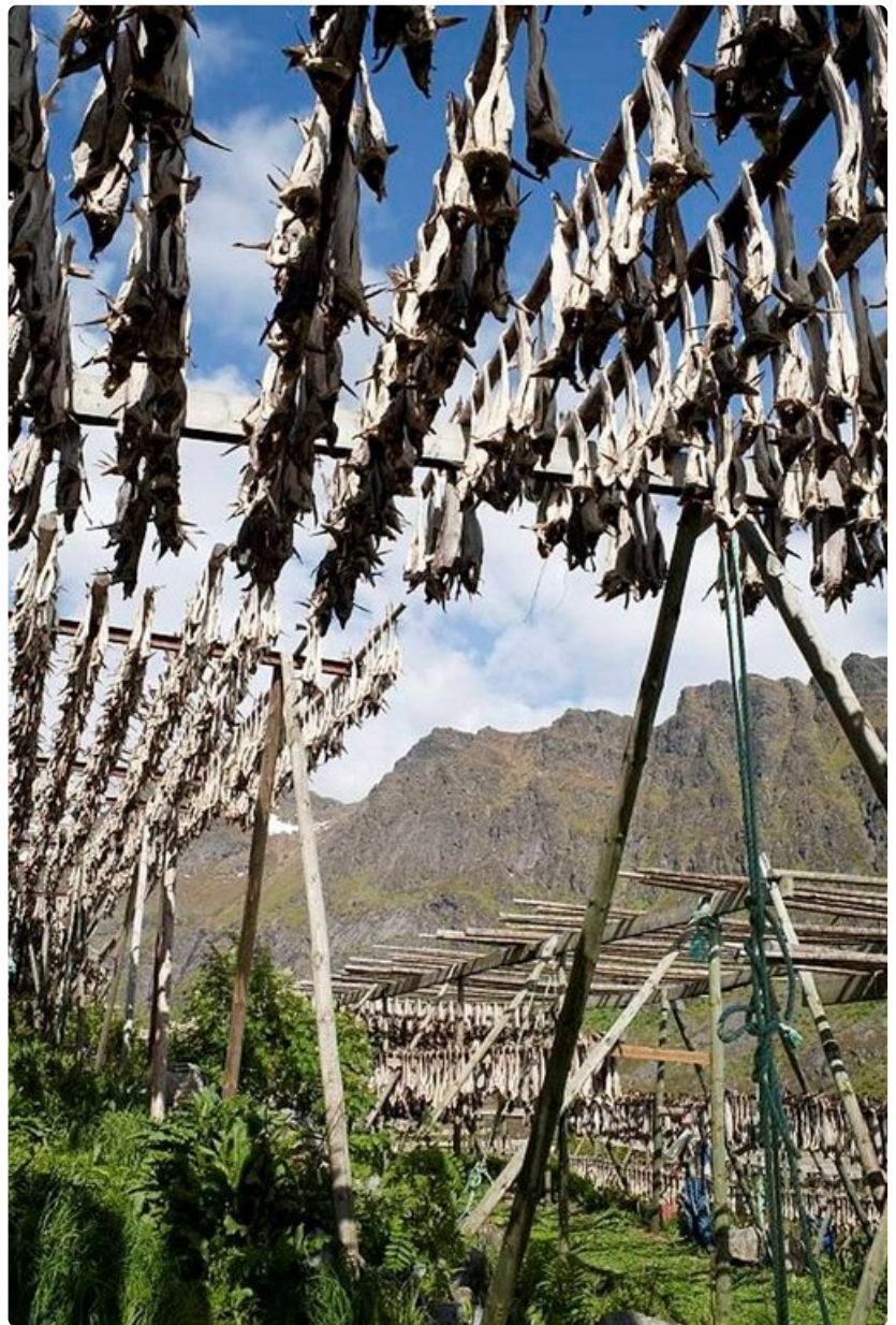
Turska on kuivunut kuukausia telineillä.

Miten pääsee? Autolauttayhteydellä mantereelle, Svolværistä Skutvikiin ja Moskenesista Bodöhön. Valtatie E10 yhdistää saariryhmän suurimmat saaret toisiinsa ja Manner-Norjaan siltojen ja merenalaisen tunnelien kautta. Lofoteilla kulkee päivittäin muutamia bussivuoroja saarten ja mantereen välillä.