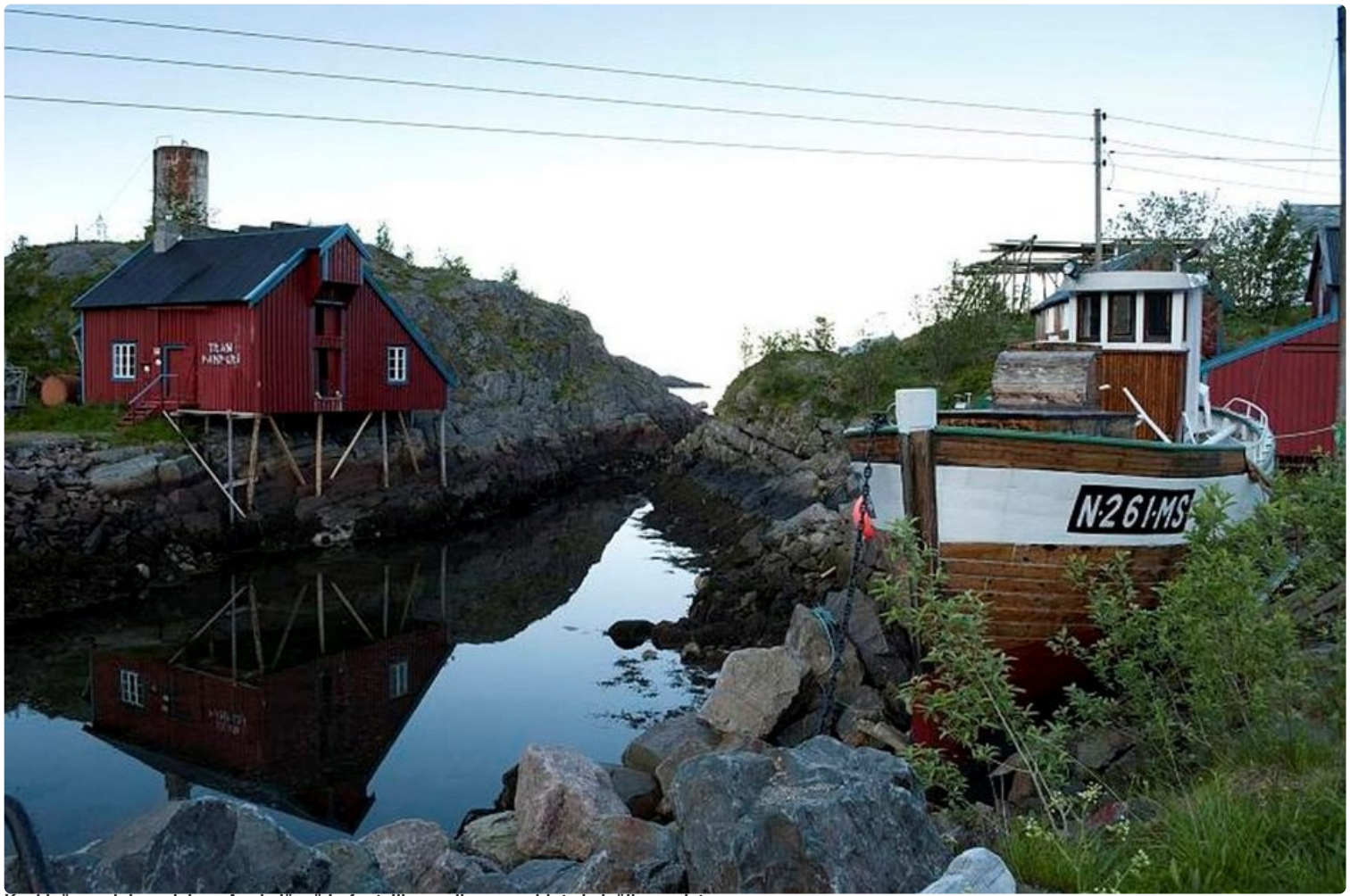
Keskiyön aurinko valaisee A:n kylässä Lofoteilla maailman vanhinta kalaöljynpuristamoa.