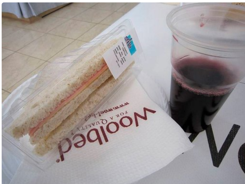
Tarjoiluna on kolmioleipä ja viiniä.