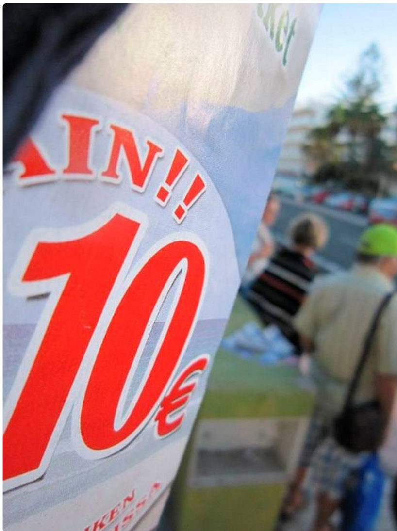
Inglesin kadut on koristeltu esitteillä, joilla houkutellaan retkille 10 euron hintaan. Suosiosta päätellen katumarkkinointi on onnistunut.