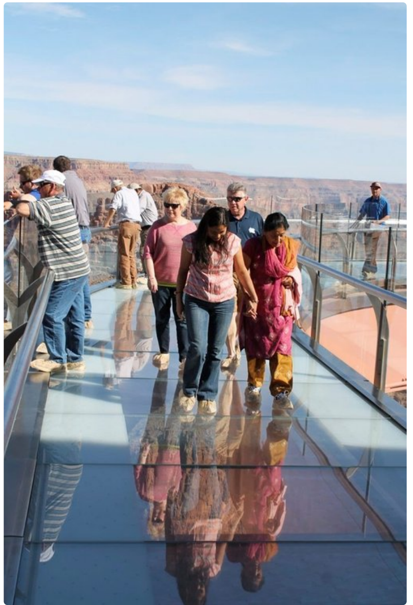
Kävely kanjonin yläpuolella on erikoinen kokemus, jota ei suositella korkeanpaikankammoisille.