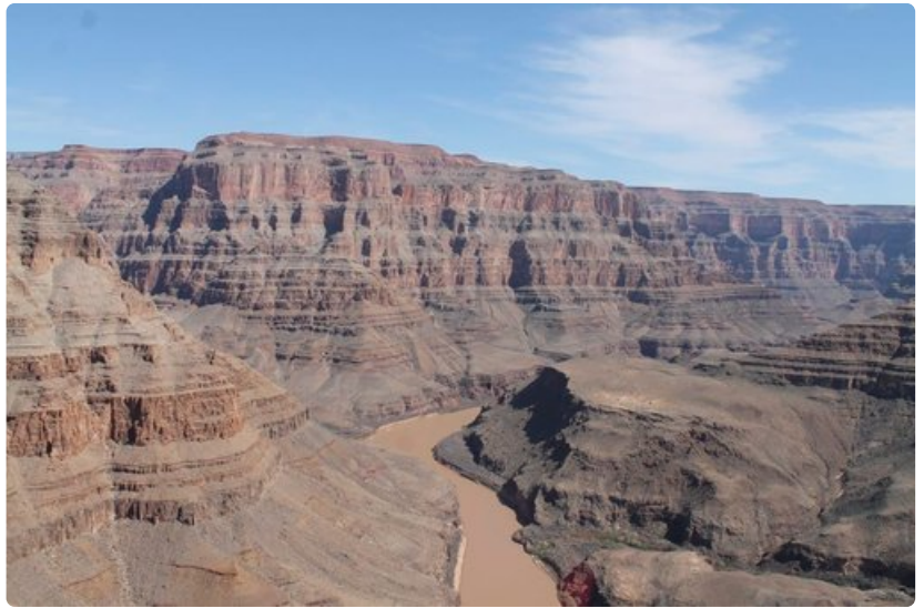
Kanjonin pääsee tutustumaan veneellä, hevosella tai helikopterilla. Myös vaelluskierrokset laaksossa ovat mahdollisia.