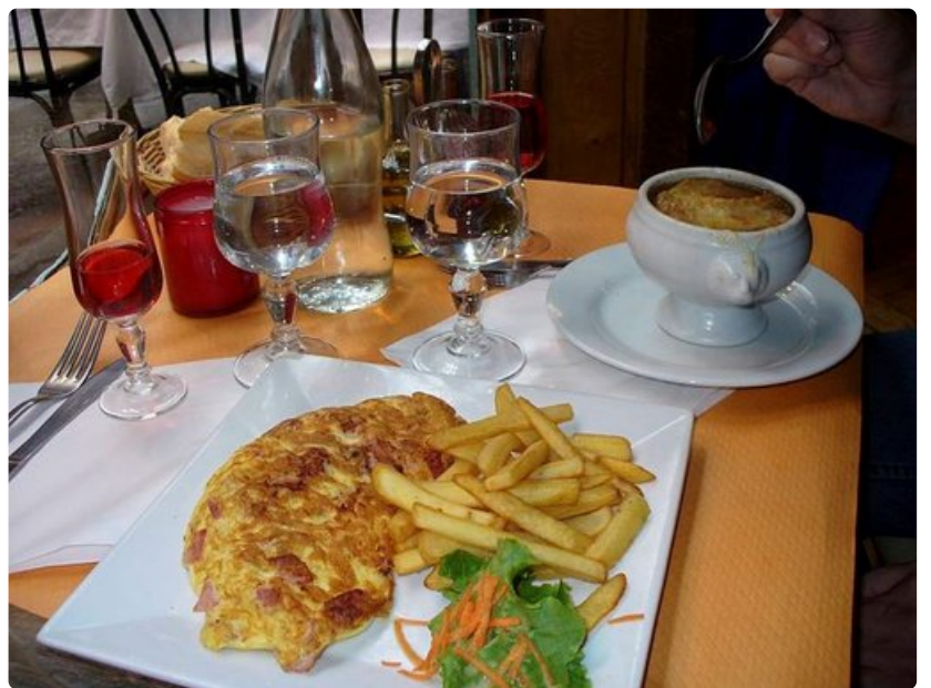
Latinalaiskorttelissa syö lounaaksi sipulikeiton ja omeletin kohtuuhintaan.