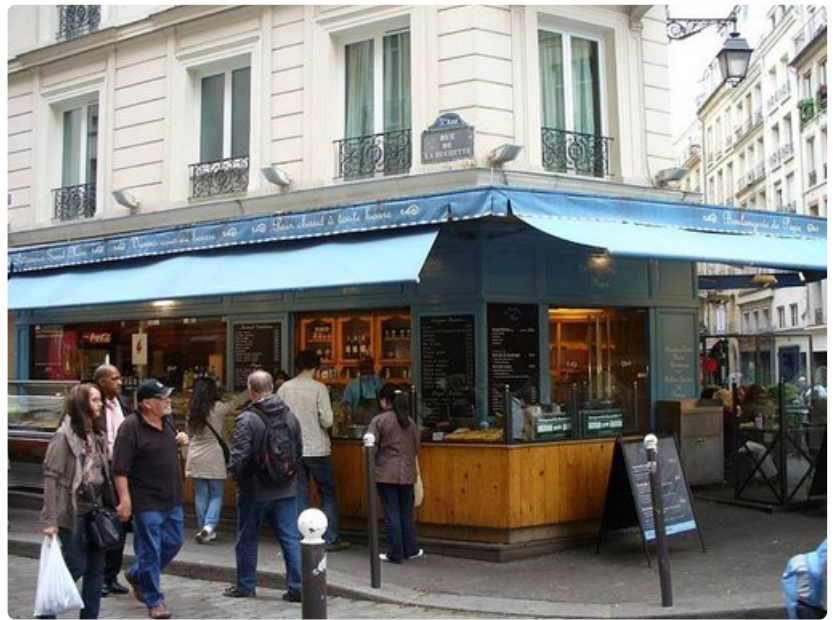
Boulangerie de Papasta saa lämpimät pullat, croissantit ja täytetyt patongit.