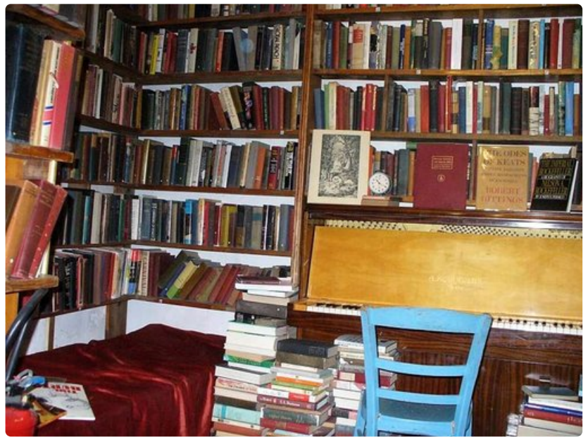
Shakespeare and Company -kirjakaupan perustajan Sylvia Beachin ajatus oli tarjota kirjailijoille myös makuusija.