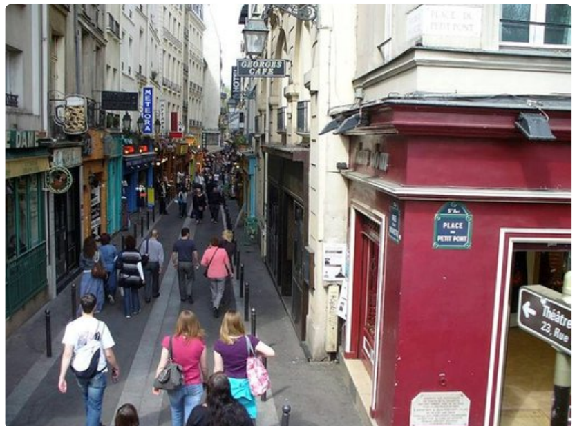
Rue de la Huchette, kapea kävelykatu on 800 vuotta vanha.