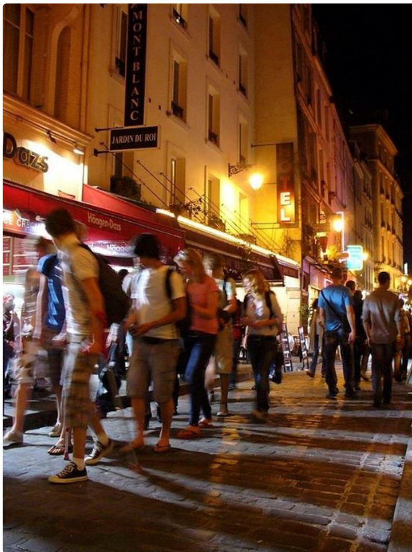
Hämärä laskeutuu Latinalaiskortteliin ja tuo mukanaan yhä enemmän ihmisiä.