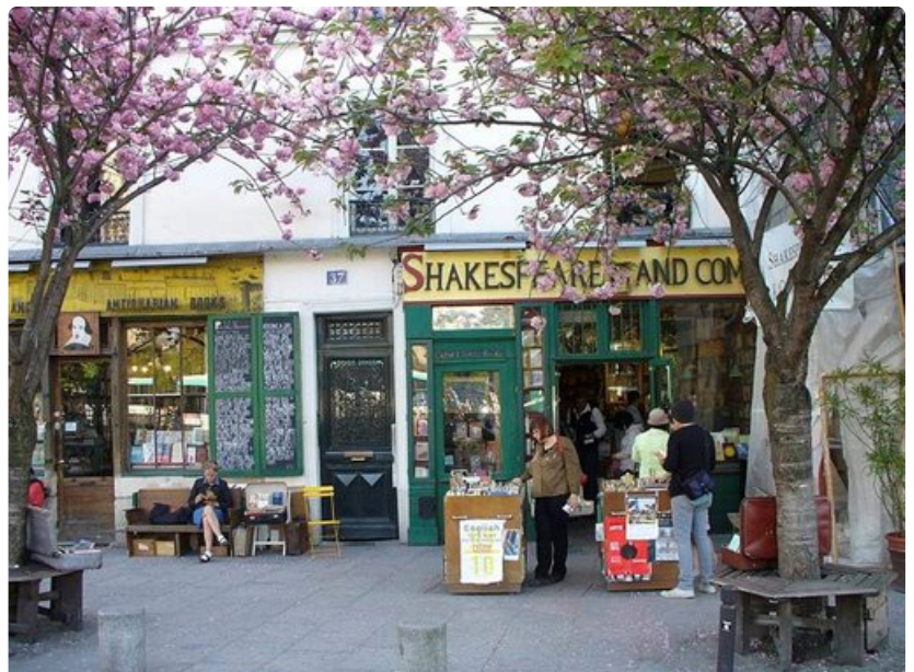
Vuonna 1919 perustetusta Shakespeare and Company- kirjakaupasta löytyy uutta ja käytettyä englanninkielistä kirjallisuutta.