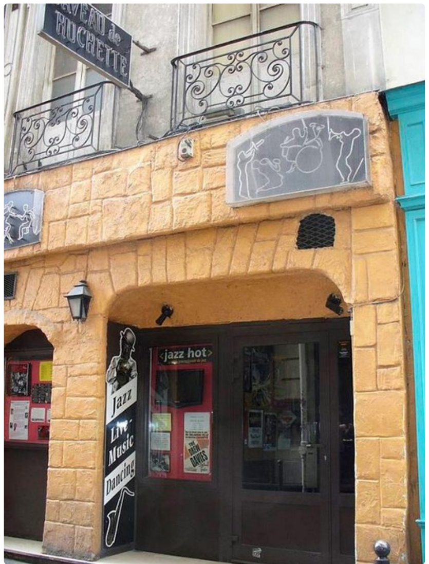
Pariisin vanhin jazzluola vuodelta 1925 löytyy Latinalaiskorttelista. Caveau de la Huchetessa jazzillaan aamuun saakka.