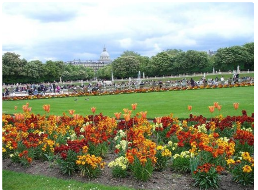
Luxemburgin puiston kukkaloistoon ei kyllästy koskaan. Taustalla näkyy Pantheon.