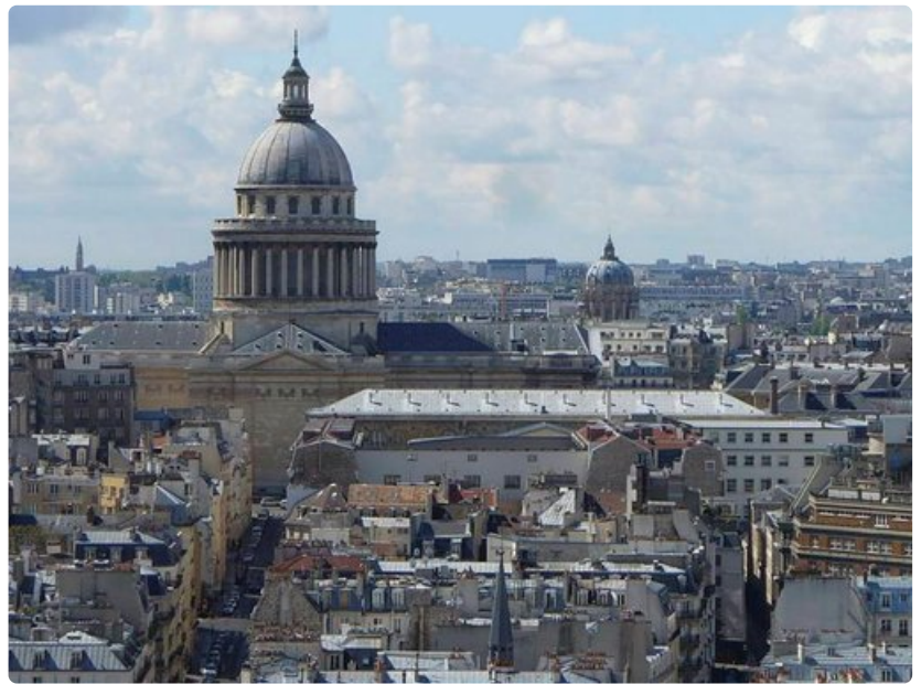
Valtava Panthéon kohoaa korkealle kaupungin kattojen yläpuolelle.

Second hand -kirjakaupat ja antiikkiliikkeet pitävät ovensa auki iltamyöhään. Vanhassa Shakespeare and Company - kirjakaupassa innokkaimmat kirjafanit lukevat korkeista kirjapinoista löytyviä klassikoita tikapuilla seisoen. Osa kulttuurinjanoisista jonottaa Teatteri Huchetteen katsoakseen näytelmän La cantatrice chauve , Kalju laulajatar, jota on esitetty keskeytyksellä jo vuodesta 1957.