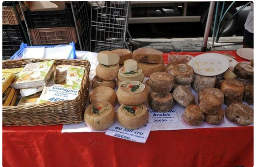
Näiden juustojen tuoksu voi pyörryttää.