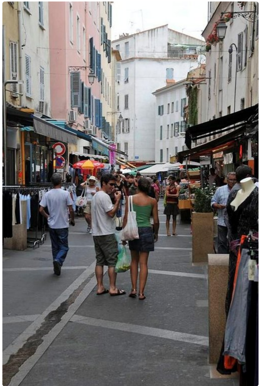
Tavaratalo Monoprix Ajaccion pääkadulla ei mene kiinni siestan ajaksi.

Miten pääsee: lentäen Nizzaan, josta lautalla saarelle