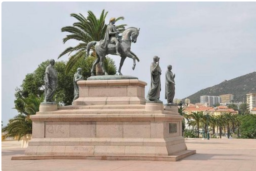
Napoleonin ratsastajapatsas on samannimisellä aukiolla.

Vuoristoisen Korsikan korkein huippu Monte Cinto kohoaa 2706 metriin ja lisäksi siellä on kolme muuta vuorta, joiden huiput ovat yli kahden kilometrin korkeudessa. Eräs maailman vaikeimpia patikkapolkuja kulkee suoraan saaren läpi kansallispuiston alueella. Vaativa reitti vie vuoren huipulta toiselle. Kerran vuodessa siellä kilpaillaan, kuka vaeltaa reitin nopeimmin. Parhaat taittavat taipaleen alle kahdessa viikossa.