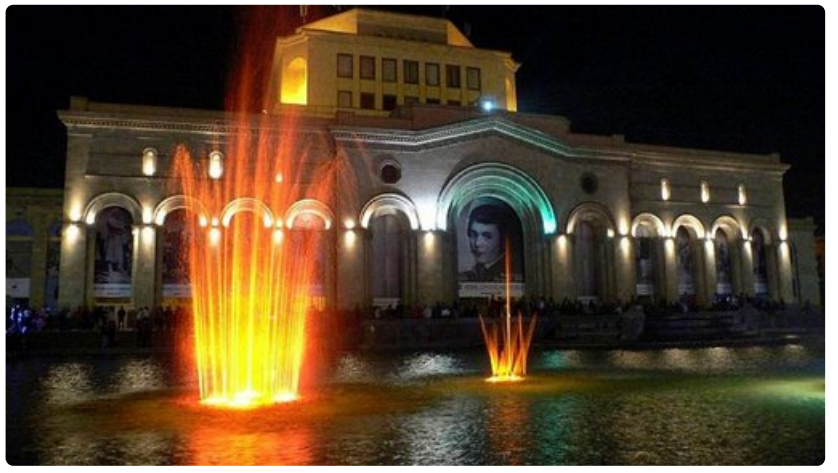
Kansalliskallerian edustalla pääsee ihaillemaan suihkulähdekonsertteja. Jerevan tarjoaa ylenpalttisesti kulttuurinautintoja.