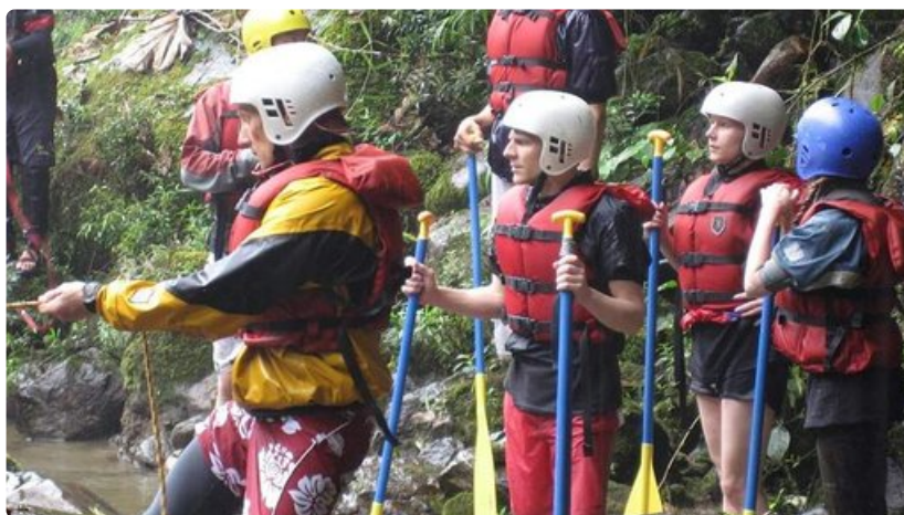
Pahan paikan tilannearviointia.