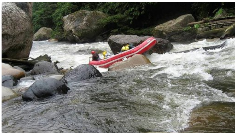
Reitille jämhätäneen uppotukin ylitys.