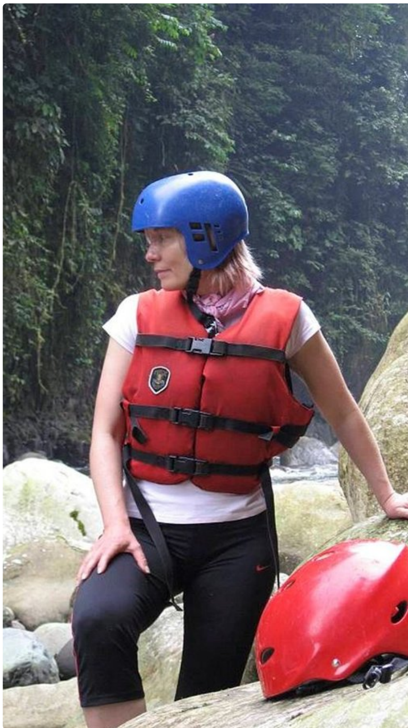
Millainen lie seuraava koski?