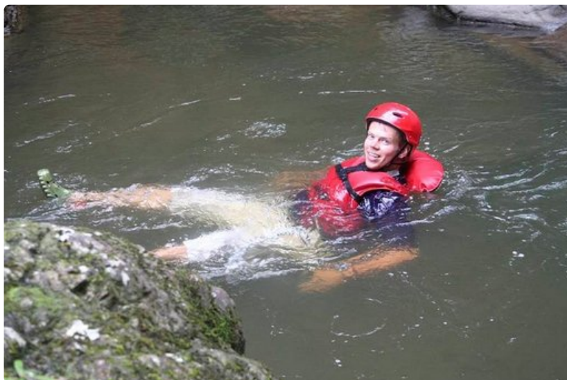
Reipas-Reima viilentää istumalihaksiaan.

Koskivuokitus on tekninen neljä, joka on siitä huomattavasti vaativampi.