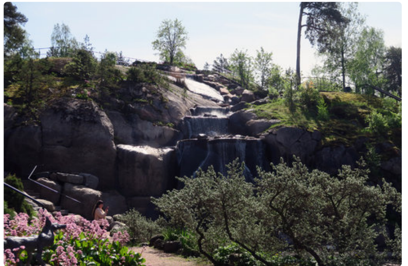
Sapokan valtavassa vesipuistossa riittää nähtävää ja koettavaa.