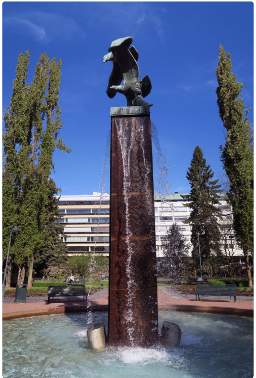
Sibeliuksenpuiston Kotkat siivittävät kaupungin mainetta.

Merellä läheisyys, hyvin hoidetut puistot ja raikas merituuli ovat tehneet entisestä satama- ja tehdaskaupungista viihtyisän ja vieraanvaraisen.