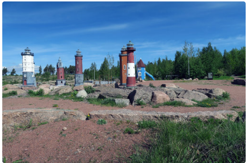
Katariinan meripuistossa voi ihailla Suomen majakoiden pienoismalleja.