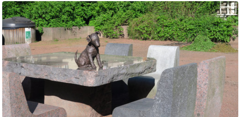
Pieni koira odottaa Sibeliuksenpuistossa seuraansa piknik-vieraita.