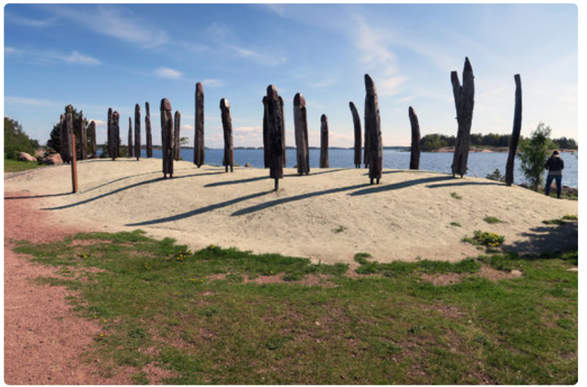
Kypäräpäiset Tammisotilaat Katariinan meripuistossa muistuttavat sotien melettömyydestä.