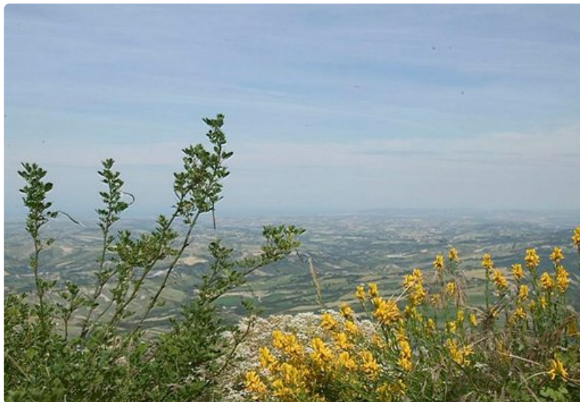
Adrianmeren rannikon rantakohteet näkyvät kirkkaana päivänä Titano-vuorelta.