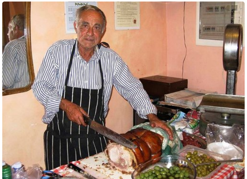
Cantina Ottavianin -tavernassa on tarjolla perinteistä lähiruokaa oliiveista salamiin ja