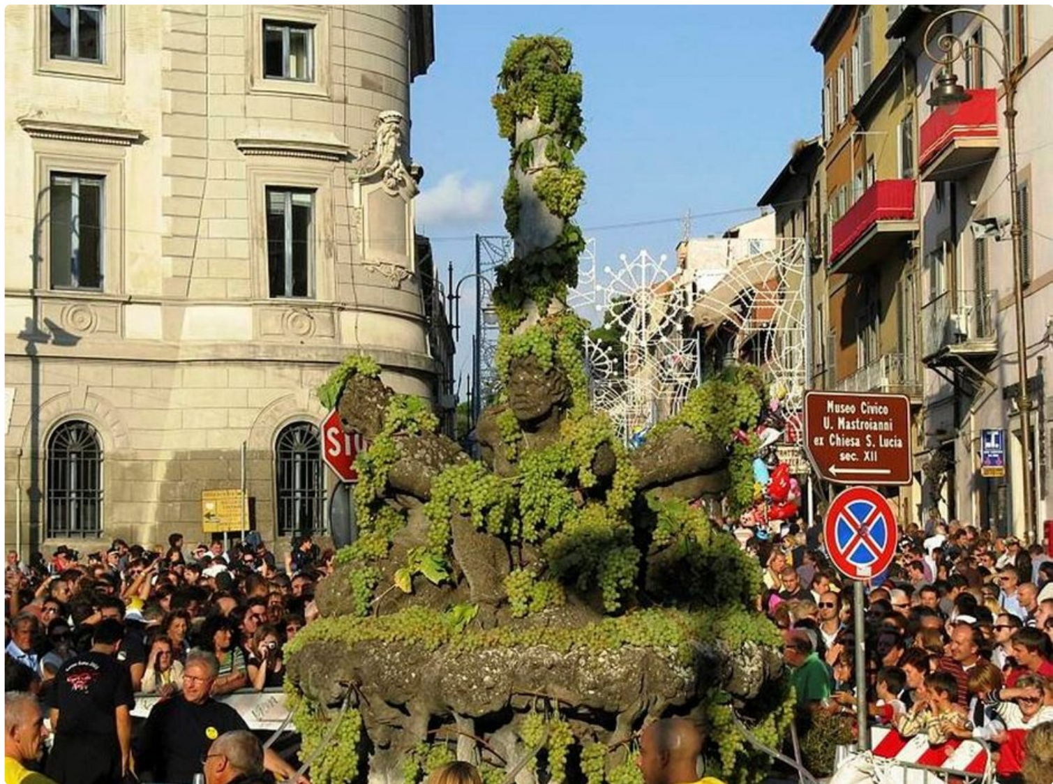
Tuhatpäinen väkijoukko kerääntyy Marinon keskusaukiolle odottamaan suihkulähteen ihmettä.