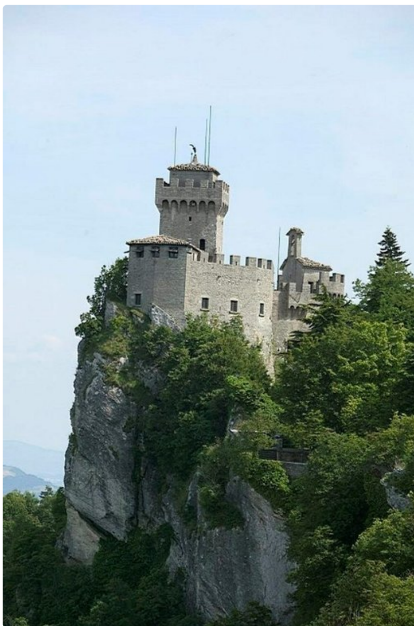
La Cestan vartiotorni on San Marinao kiertävän muurin korkein kohta.