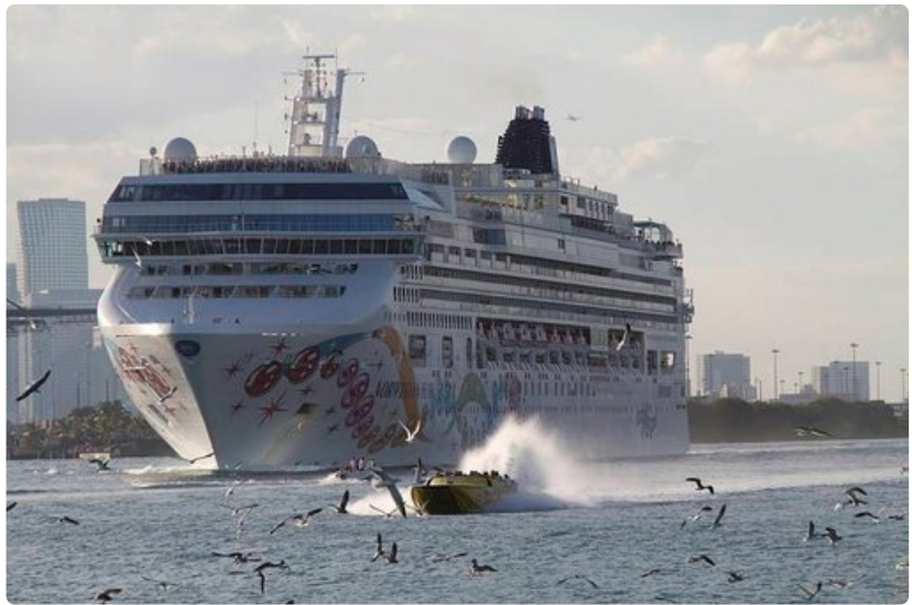
Suosituimmat Karibian risteilyjen lähtösatamat ovat Fort Lauderdale ja Miami.