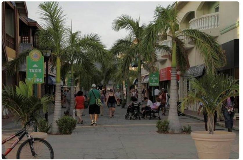
Putiikit ja liikkeet satamien läheisyydessä tarjoavat hyvät mahdollisuudet tuliaisostoksille.