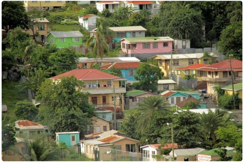
Värikkäät rakennukset toivottavat matkailijat tervetulleiksi.

urheilukenttä, maailman ensimmäinen merellä kulkeva ranta-allas, surf-simulaattori, kiipeilyseinä, golfsimulaattori, koripallokenttä, jäähalli, köysirata, show-areena www.