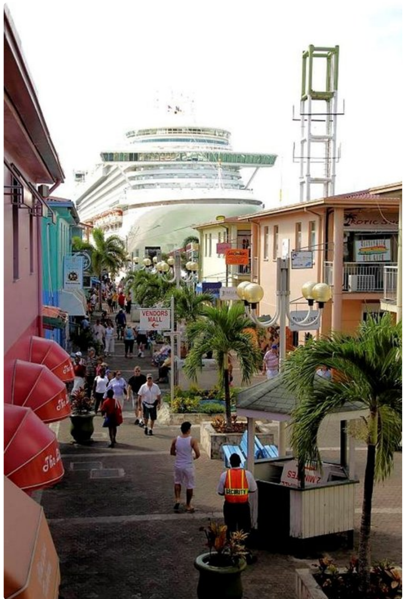
Laiva on saapunut satamaan. Risteilyaluksen rinnalla talot näyttävät pieniltä.

Muut palvelut: 4 uima-allasta ja 10 poreallasta, täysikokoinen