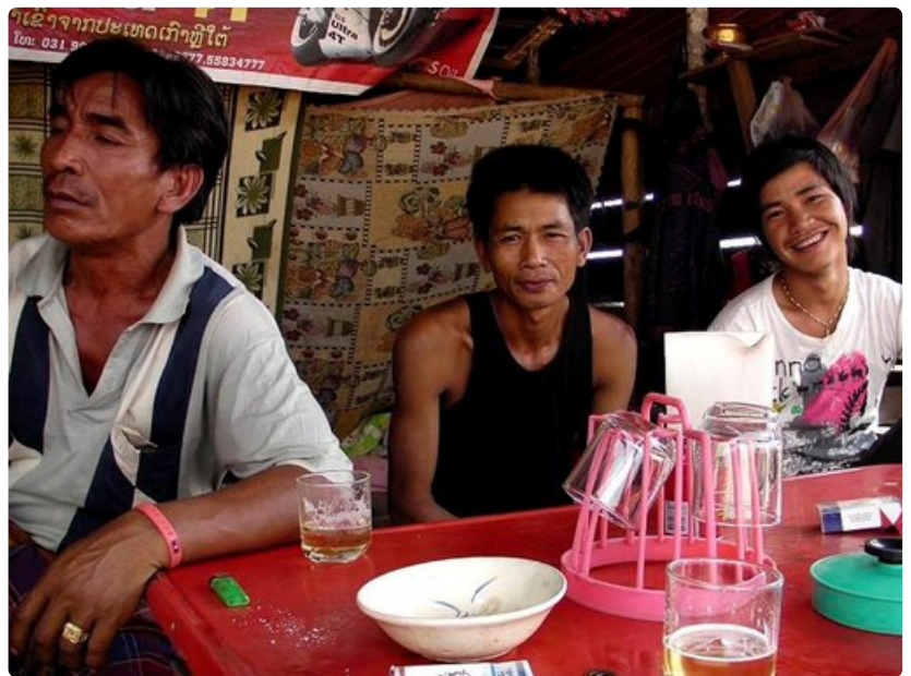
Ban Phaphon kylä Etelä-Laosissa on kappale ystävällisintä ja aidointa Indokiinaa.

Ota yhteyttä läheisiisi ja lähimpään Suomen suurlähetystöön, etenkin jos olet matkalla yksin. Ilman tukijoukkoja saatat murtua tunnustamaan tekemättömiäkin asioita, sillä poliisit saattavat luvata, että saat sen jälkeen jatkaa matkaa. Tunnustuksen jälkeen olet kuitenkin entistä pahemmassa pulassa.