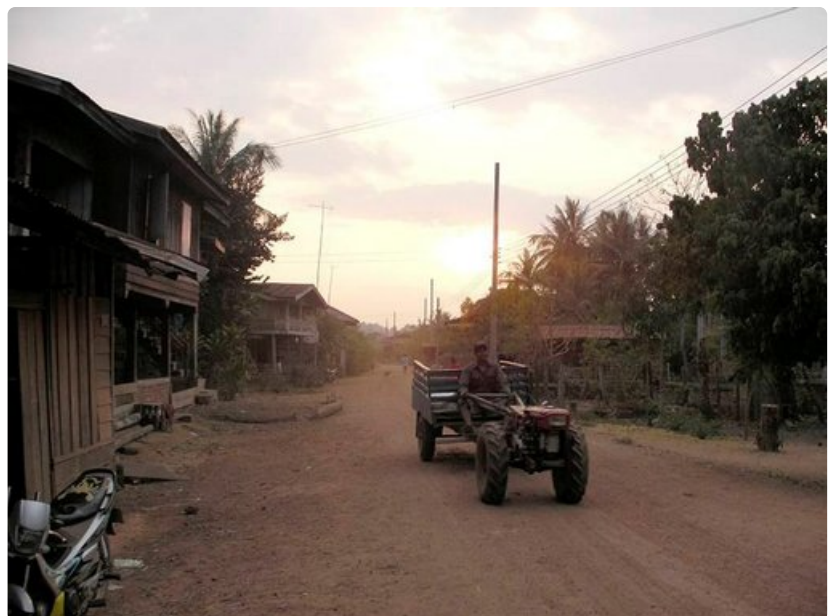
Laos kärsii heikosta infrastruktuurista. Tieverkosto on riittämätön eikä rautateitä käytännössä ole.