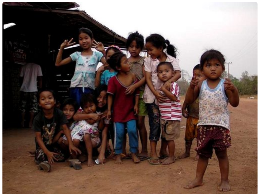
Lapsissa on tulevaisuus. Koulutussektori on yksi nykyisen hallituksen prioriteeteista, mutta edelleen alle 70 prosenttia lapsista pääsee peruskouluun, jota käydään keskimäärin neljä vuotta. Lisäksi erot eri provinssien välillä ovat huomattavia. Vaikka koulunkäynti on alle 10-vuotiaille ilmaista, niin monilla perheillä ei ole varaa hankkia koulutarvikkeita.