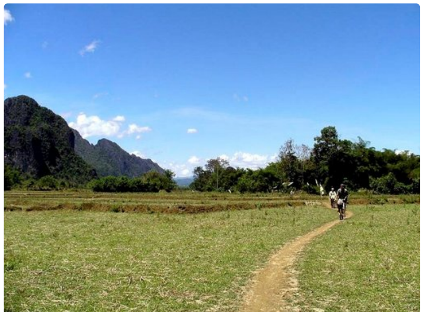
Vang Viengiä ympäröivä maaseutu on kuin toisesta maailmasta.