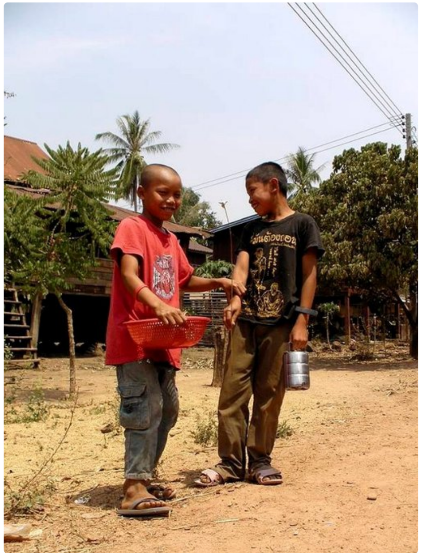
Raha ei tuo onnea. Köyhyydestä huolimatta laot – eli laosilaiset – vaikuttavat onnellisilta ja osaavat nauttia elämän pienistä asioista.