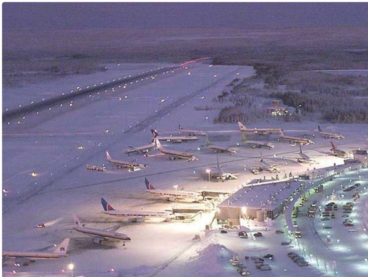
ARKISTOKUVA: Rovaniemen lentoaseman jouluruuhkaa vuosien takaa. Nyt lentoliikennekin on palautunut koronan jälkeen.