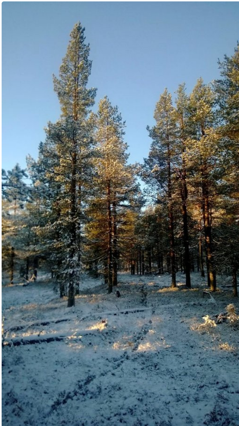
Vuokratun mökin osoitteessa saattoi pahimmillaan löytyä pelkkää metsää.