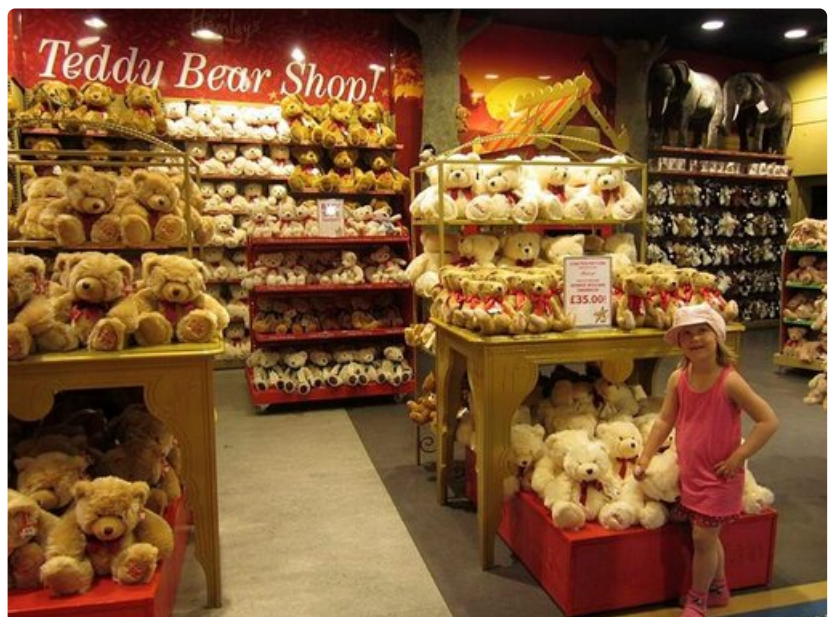
Historiallisessa Hamley'sin lelukaupassa Regent Streetillä kussakin kerroksessa on oma teemansa.