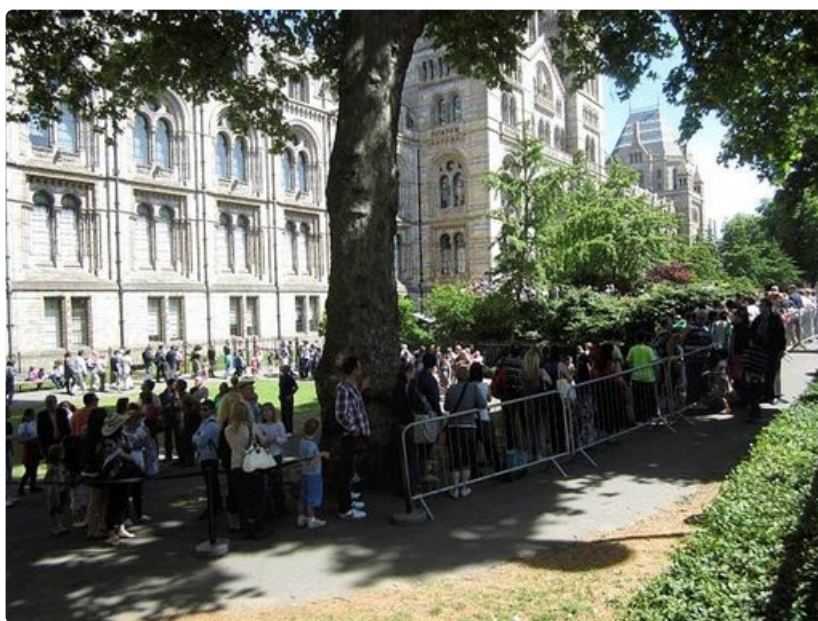
Pitkät jonot nähtävyyksiin välttää, kun menee niihin heti aamulla, kun ne avaavat ovensa.