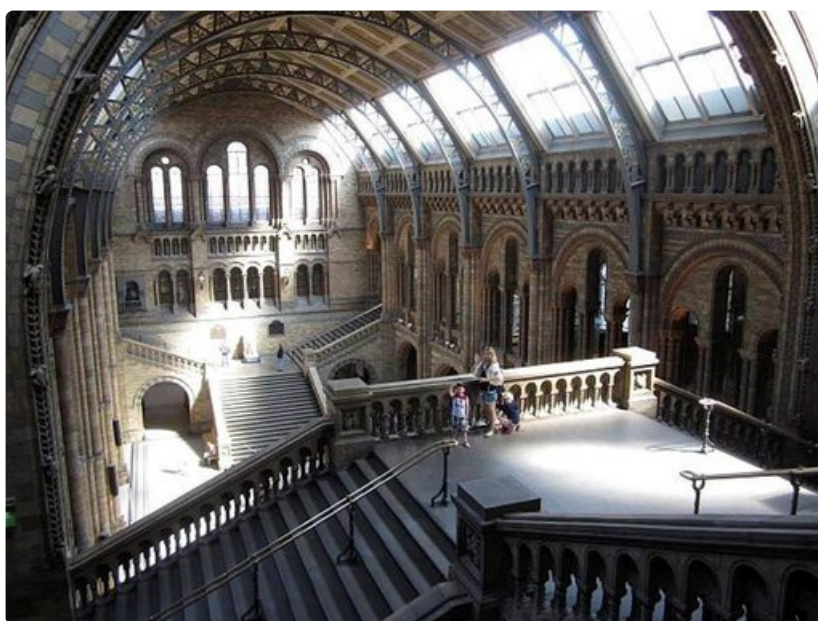
Luonnonhistoriallinen museo on kuin suoraan Harry Potter -elokuvista.