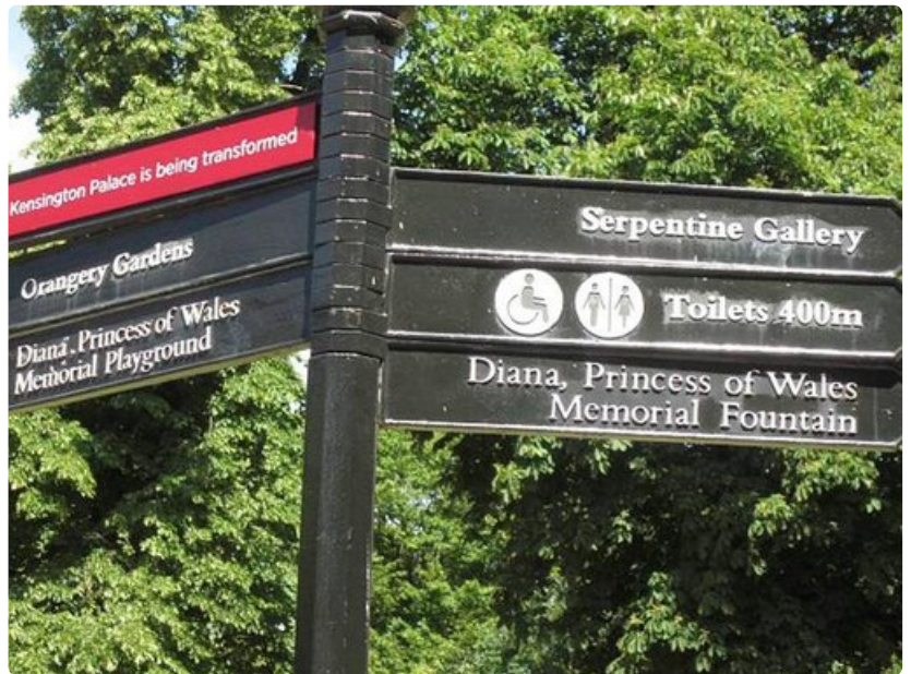
Kensington Gardens ja Hyde Park -puistoissa voi lepäämisen lisäksi harrastaa urheilua tai vaikka taidetta.

Kymmenen minuutin kävelymatkan päässä luonnonhistoriallisesta museosta aukeaa valtava puisto, jota lapset rakastavat. Kensington Gardens ja Hyde Park seisovat rinta rinnan ja niiden välissä on joenmuotoinen lampi. Puisto kutsuu niin paikallisia kuin matkailijoiakin lepäämään, syömään eväitä, potkimaan palloa ja leikkimään. Myös tennistä, uintia ja veneilyä voi harrastaa. Suuressa puistossa on runsaita puutarhoja, lintutarhoja, palatsi, taidenäyttely, huvimajoja, kahviloita ja erilaisia lasten leikkipuistoja.