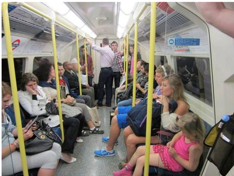
Lontoolaiset ovat lapsiystävällisiä ja tarjoavat lapsille herkästi paikkaa metrossa.