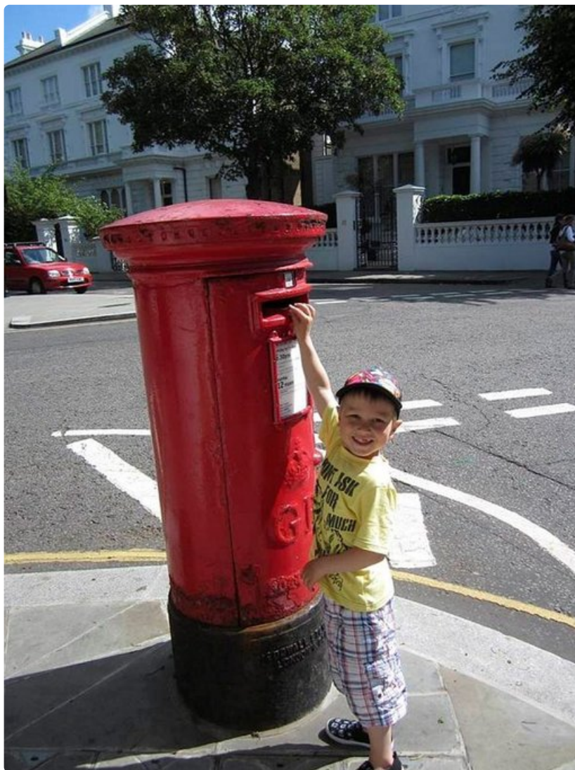
Miksei meillä ole näin hienoja postilaatikoita?