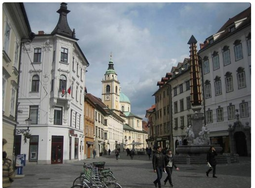
Vanhankaupungin taloja on kunnostettu kunkin aikakauden piirteitä vaalien.