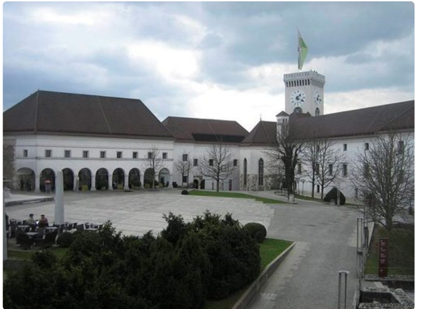
Kaupungin linna on rakennettu 1200-luvulla tukikohdaksi, mutta on sen jälkeen toiminut myös kuninkaallisten asuntona.