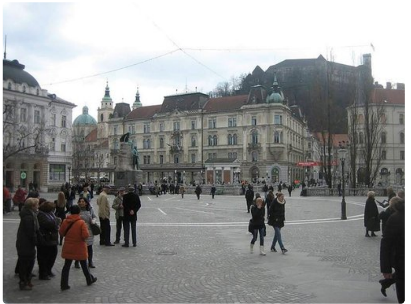
Kaupungin sydän on Presernov trg –aukio, josta Kolmoisilta johdattaa Vanhankaupungin kaduille.