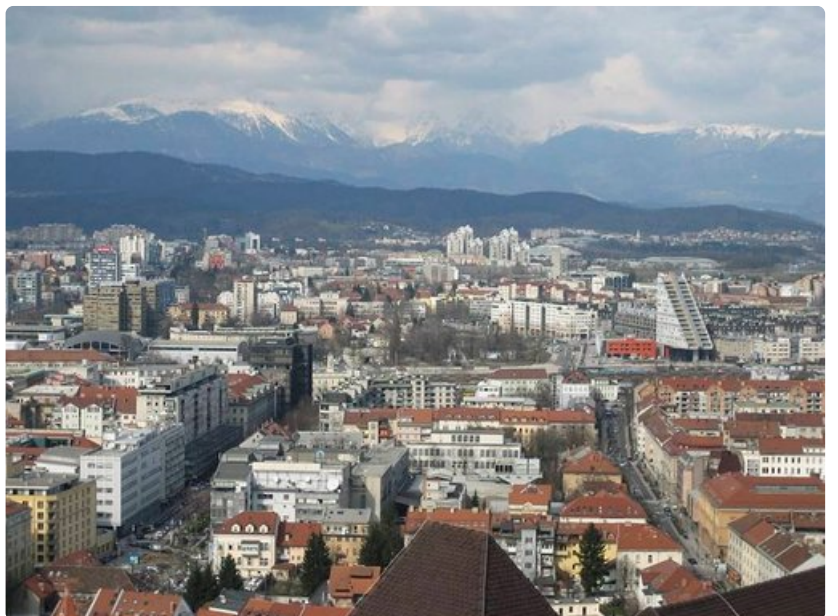
Ljubljanan linnasta aukeaa hieno näköala ympäri kaupunkia.