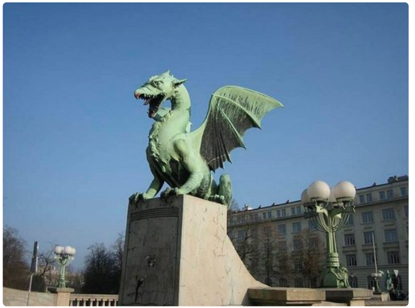
Ljubljanan symboli on lohikäärme.