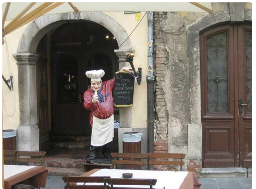
Rantakadun kahvilat ja ruokapaikat houkuttelevat varhaisesta keväästä pitkälle syksyyn.