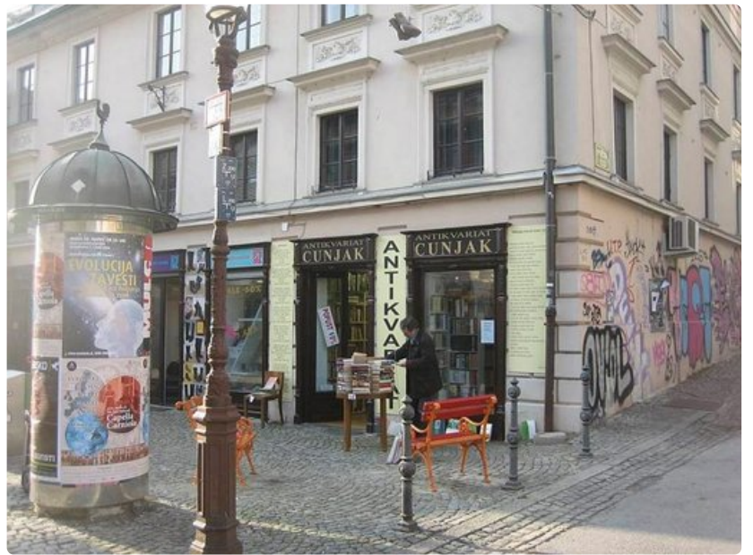
Vanhankaupungin kauppiat virittelevät pihakauppaa jo maaliskuun alussa.