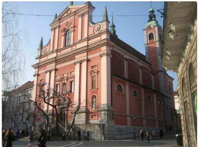
St. Nicholasin katedraali sijaitsee Vanhassakaupungissa.