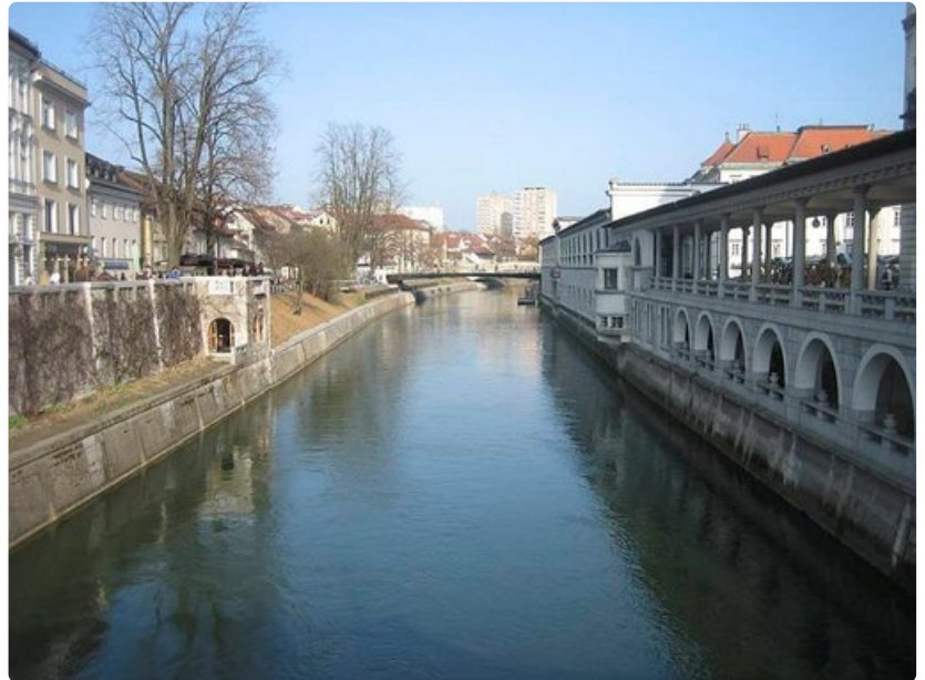
Kaupunkia halkoo Ljubljanica-joki.